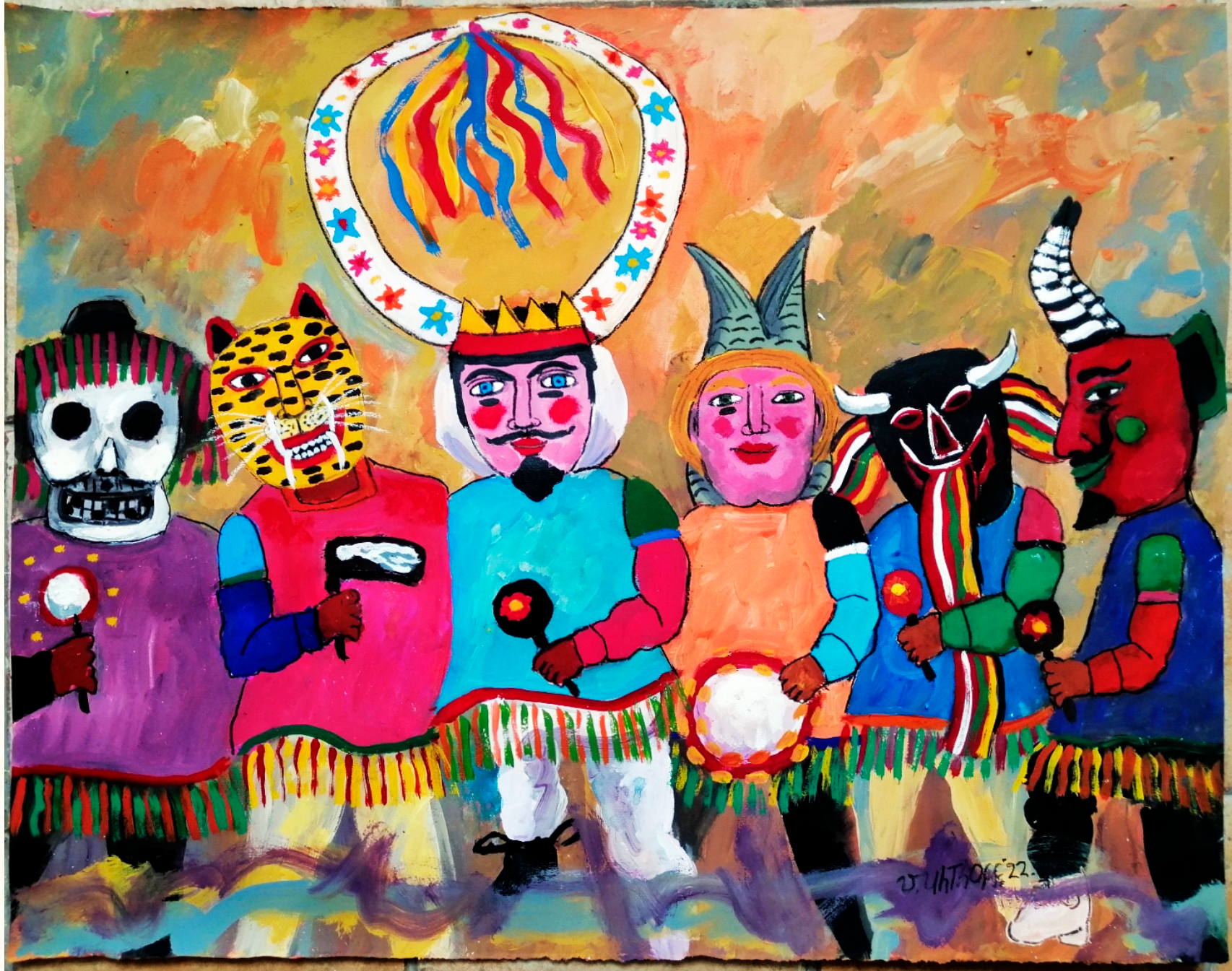
Pintura: Víctor Uthoff