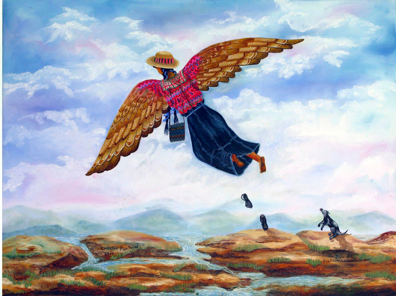
Crusando fronteras. Por Paula Nicho Cumez, pintora kaqchikel