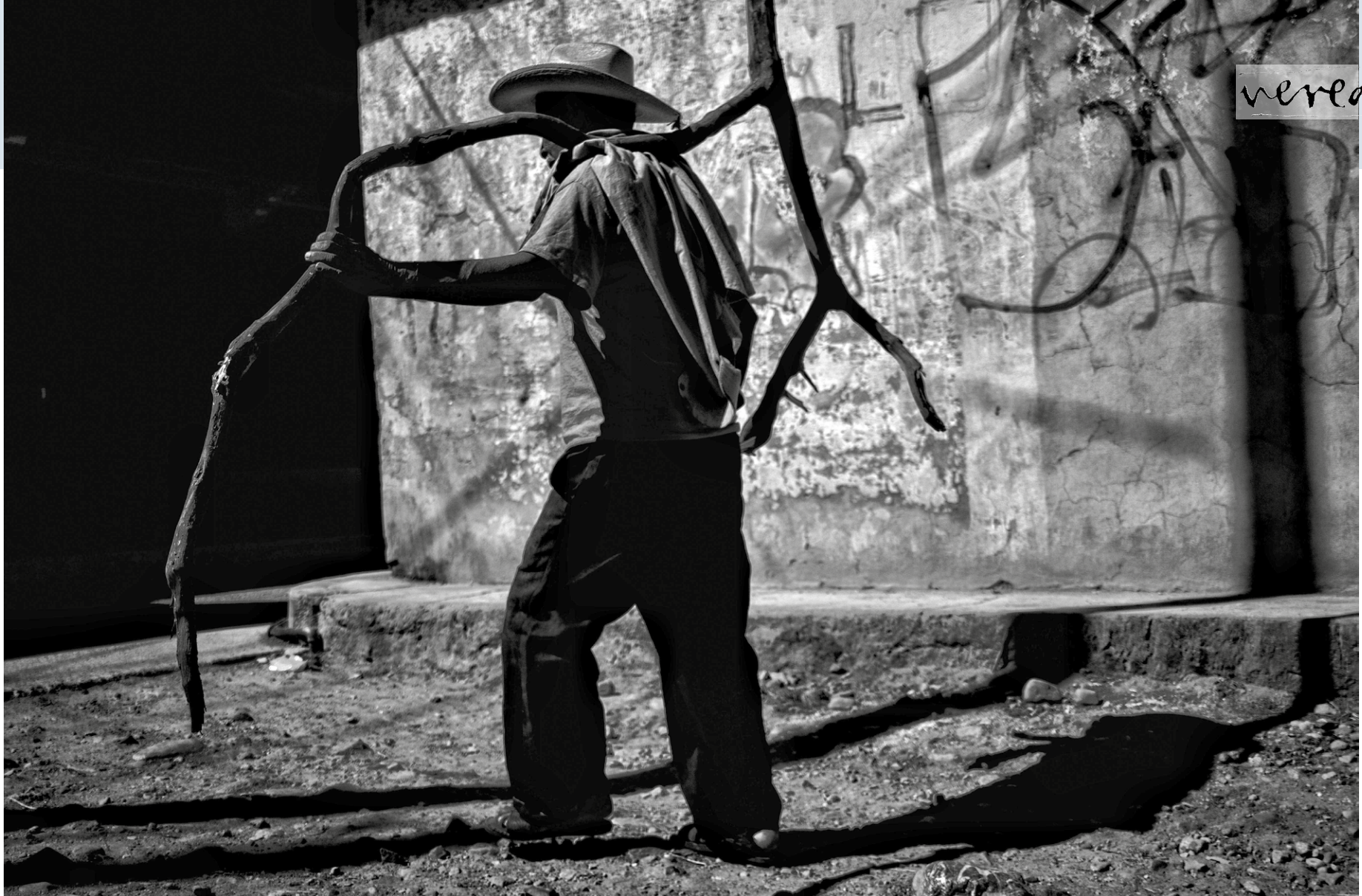
De la serie "Aquí descubrí dónde despierta el sol", Atzacaloya, Guerrero, febrero de 2024.