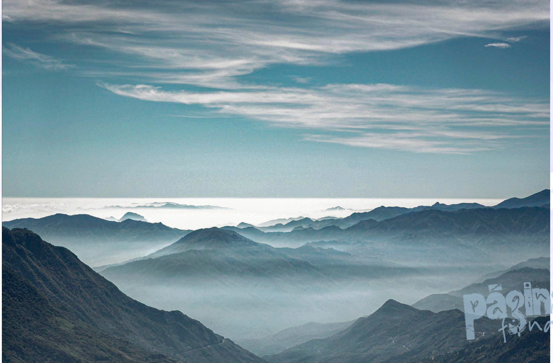
Tlahuitoltepec, territorio ayuuik.