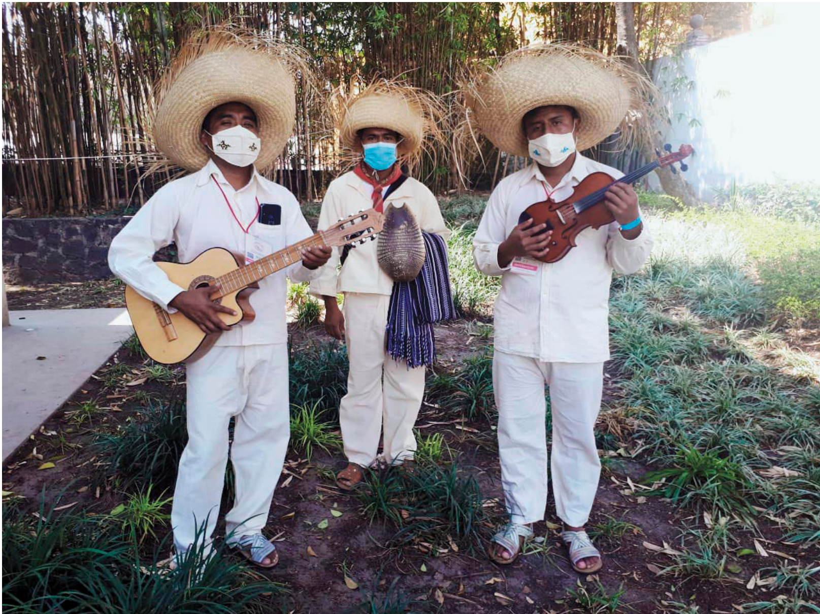
Los Tigrillos de Cochoapa el Grande, Guerrero.

E n las dos décadas recientes se han dado a conocer diversas agrupaciones musicales y compositores de música en lenguas originarias. Este hecho ha sido muy visible en la región Montaña del estado de Guerrero. Es interesante resaltar que justo en esta región convergen los pueblos me'phaa, ñuu savi y nahua, y se puede decir que la comunicación entre estos pueblos ha sido plural y diversa. Así como podemos escuchar varios idiomas locales, también se puede disfrutar música tradicional de los tres idiomas mencionados.