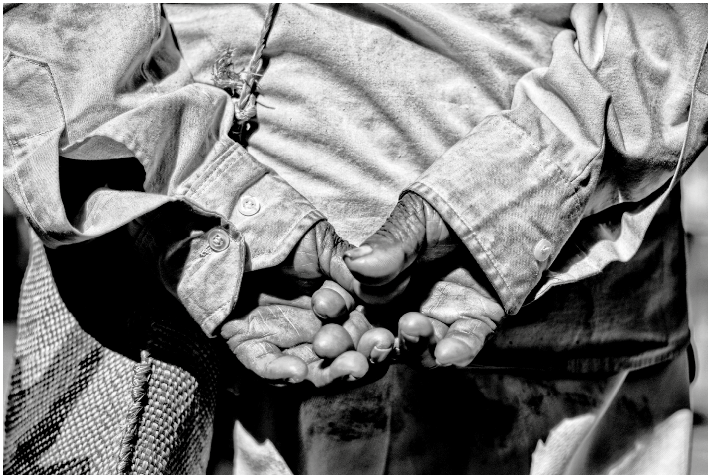
De la serie “Aquí descubrí dónde despierta el sol”, Atzacaloya, Guerrero, febrero de 2024.

Y en lo real se van desplegando también la fábrica, el restorán, los apartamentos y colonias de la ciudad, los vagones y estaciones del metro, el mundo del cabaret, de los grupos de sicarios, de la entrada al “hampa” de algún personaje y los vericuetos que eso va tejiendo en la