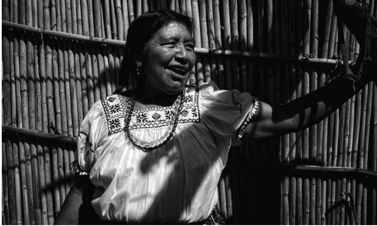
De la serie "Aquí descubrí dónde despierta el sol", Atzacoyaloya, Guerrero, febrero de 2024.