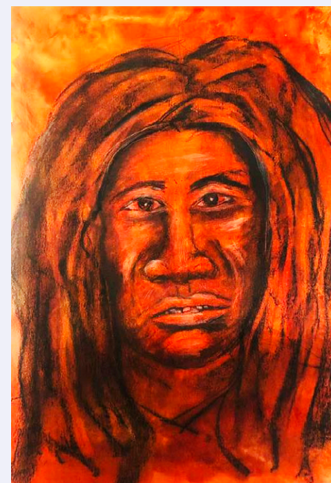
Ilustración de Lamberto Roque Hernández