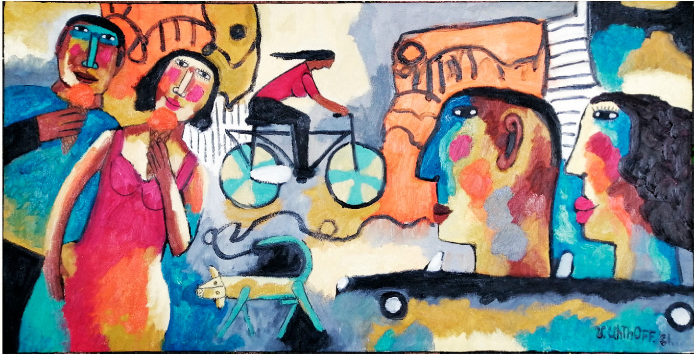
Pintura: Víctor Uthoff

H ace mucho tiempo, hazle cuenta que los huastecos no nos llevábamos con los náhuatl, si aquí son huastecos y más allá náhuatl, no podemos pasar en su