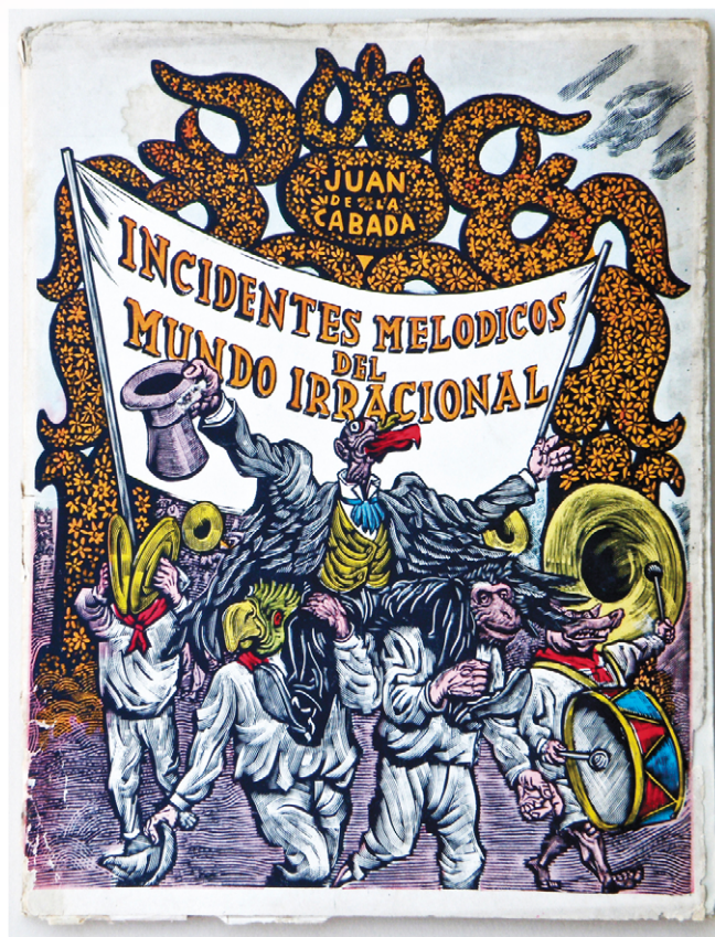
Ilustraciones originales de Incidentes melódicos del mundo irracional para el relato de Juan de la Cabada. Grabados de Leopoldo Méndez, 1944

Los pobladores estaban asustados, pues ya se corría el rumor del avistamiento de la serpiente en otros lugares. Al día siguiente,