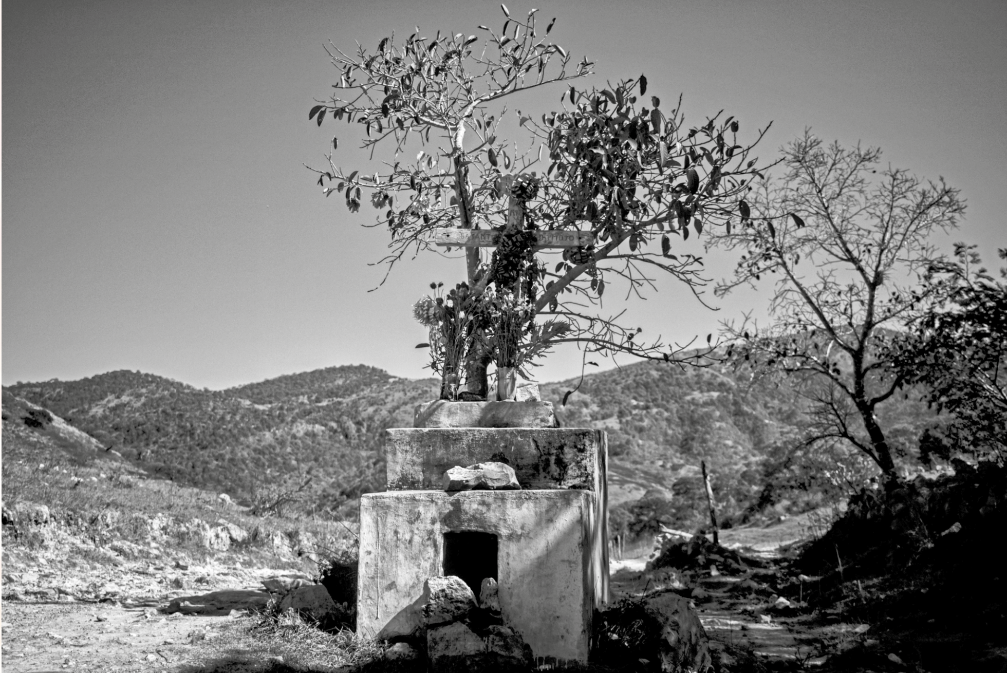
De la serie "Aquí descubrí dónde despierta el sol", Atzacaloya, Guerrero, febrero de 2024.