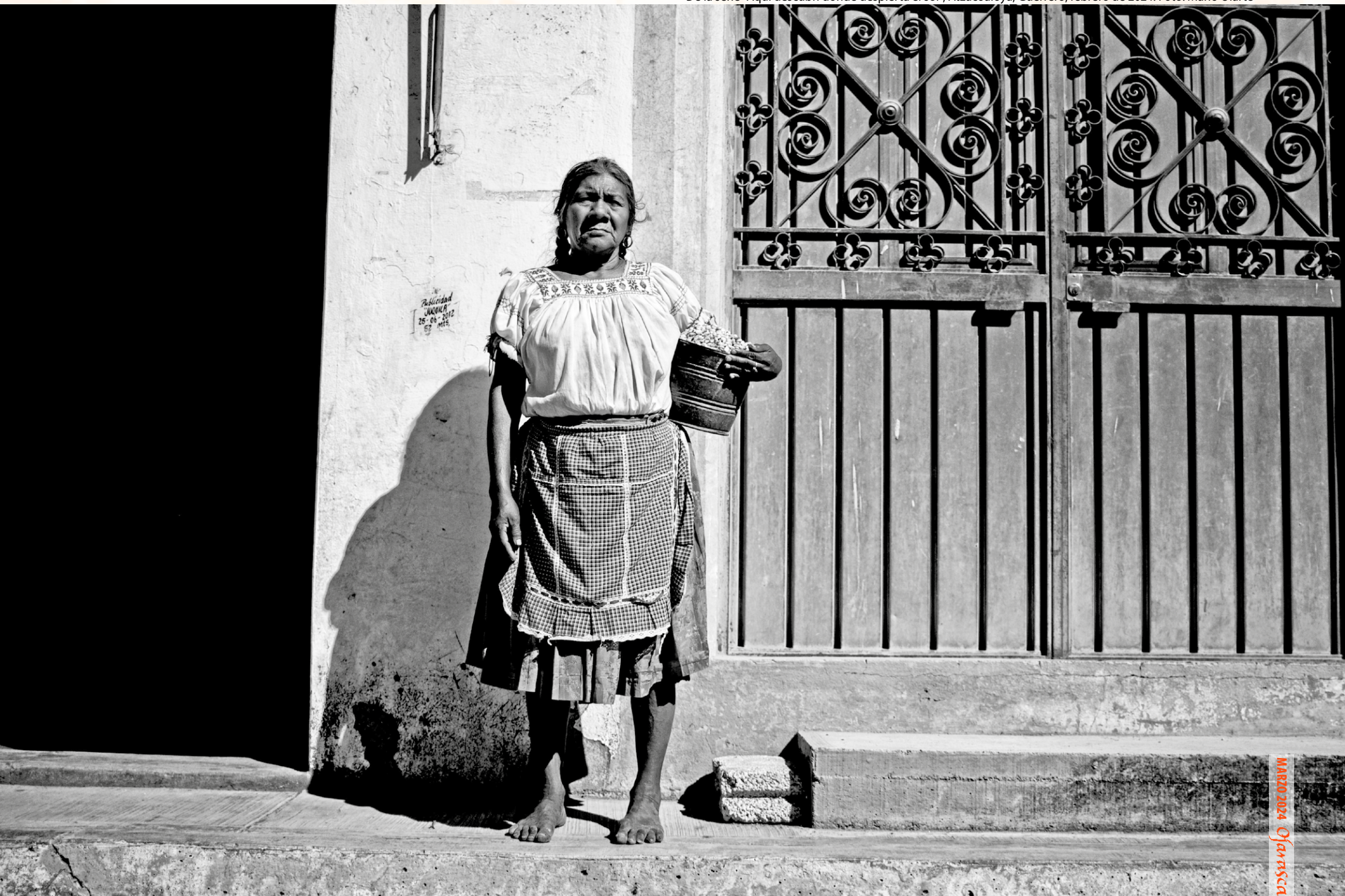
De la serie “Aquí descubrí dónde despierta el sol”, Atzacualoya, Guerrero, febrero de 2024.