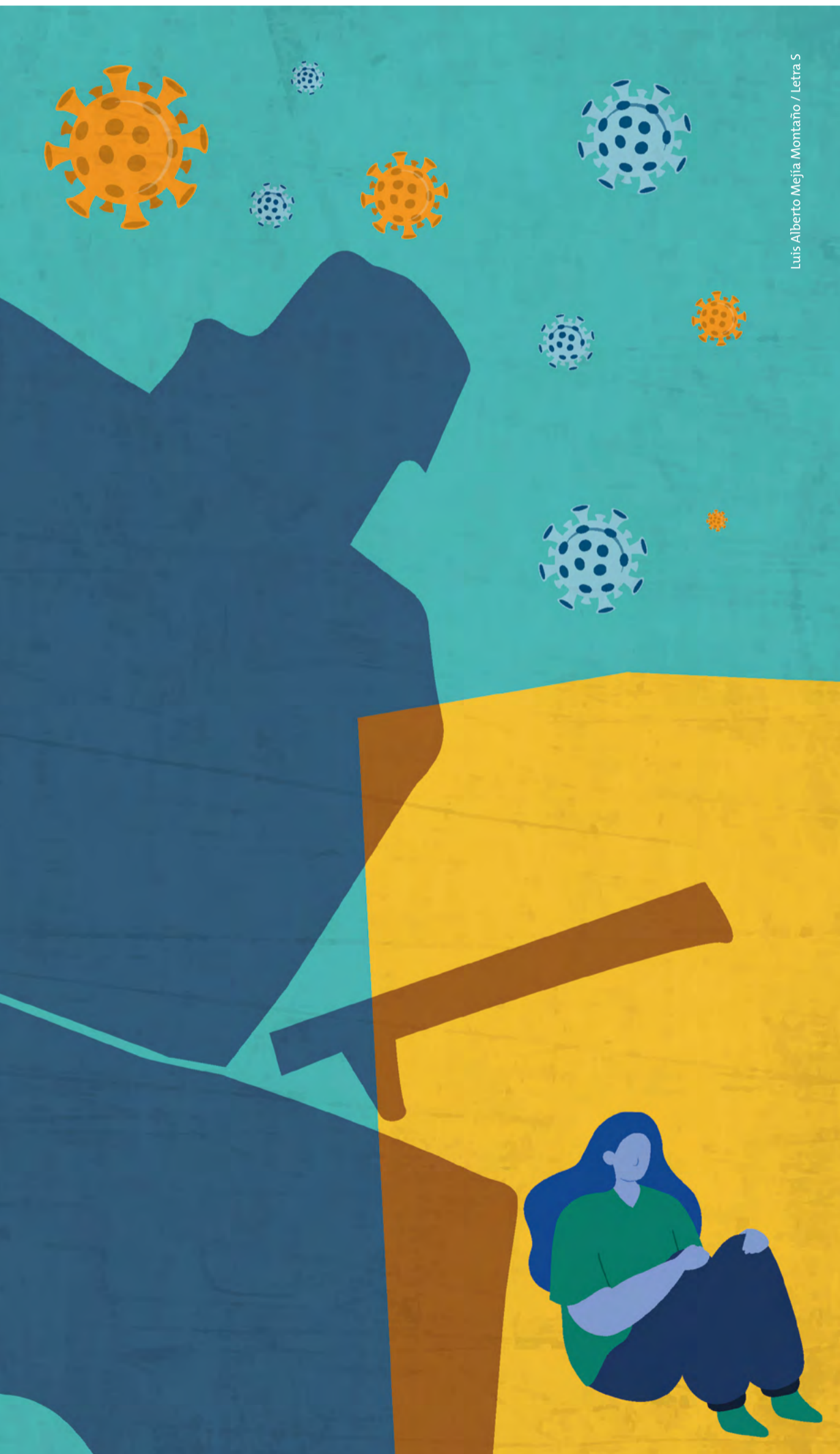
Luis Alberto Mejía Montaña / Letra 5

Jean Jacques Rousseau escribió en 1762 el Contrato social donde expuso su idea de la relación entre gobernantes y gobernados. El filósofo francés explicó que la suma de las voluntades individuales dará como resultado la voluntad general, entendida ésta como el bien o interés común, el cual es, en todo momento, de utilidad pública. Rousseau expone que si es necesario, el individuo presta sus servicios al Estado, siempre que lo haga con las leyes conforme a la razón y exista una causa justificada para el bien común. Los compromisos que nos unen al cuerpo social son obligatorios en la medida que son mutuos y al cumplirlos no sólo favorecemos al bien general, sino en principio, a uno mismo. De esta forma, nuestros derechos existen en la medida que también se ajusten a nuestros deberes como ciudadanos.