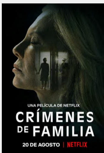
CRÍMENES DE FAMILIA

Homintern, cómo la cultura LGTB liberó al mundo moderno , editorial Dos bigotes, Madrid, 2019. Disponible en amazon.com o, en su versión electrónica en inglés, a través de la librería Gandhi.