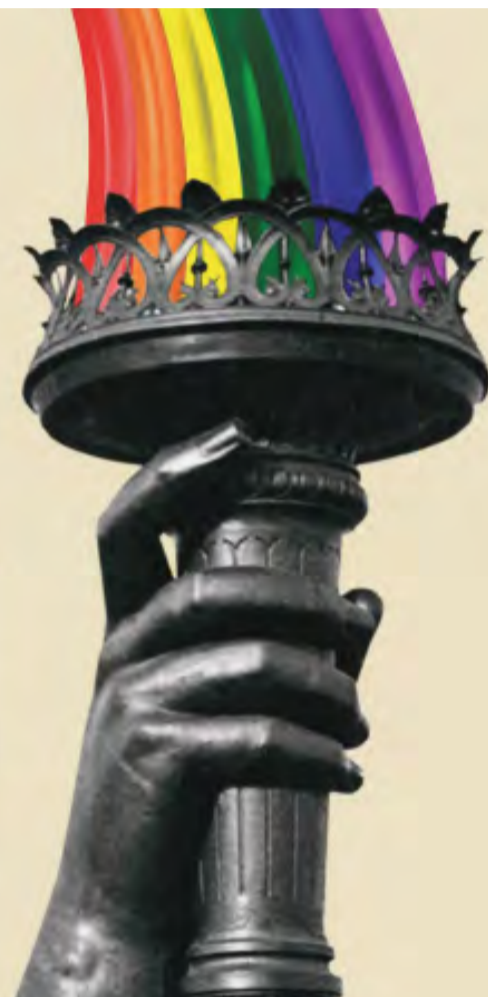
Foto: Jean Genet - Le condamné à mort (1942)

CÓMO LA CULTURA LGTB LIBERÓ AL MUNDO MODERNO GREGORY WOODS