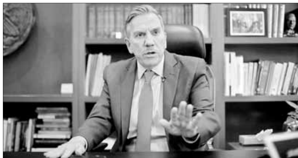
▲ El ministro Javier Laynez Potisek frenó la extinción de 13 fideicomisos del Poder Judicial de la Federación.

Twitter: @cafevega cfmexico_sa@hotmail.com