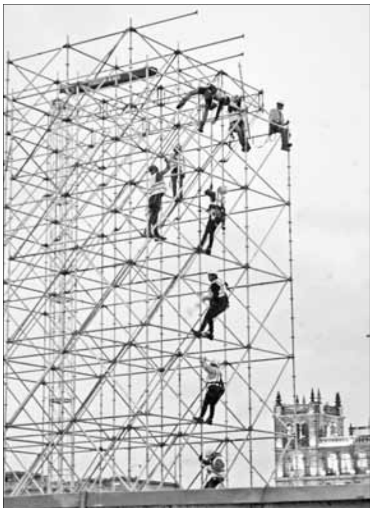
▲ Trabajadores del gobierno capitalino olvidan el frío y dan su máximo esfuerzo en el Zócalo de la Ciudad de México.