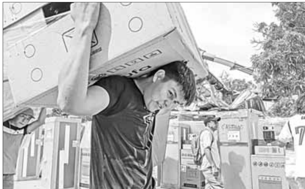
▲ Autoridades federales entregaron ayer enseres domésticos a los afectados por el