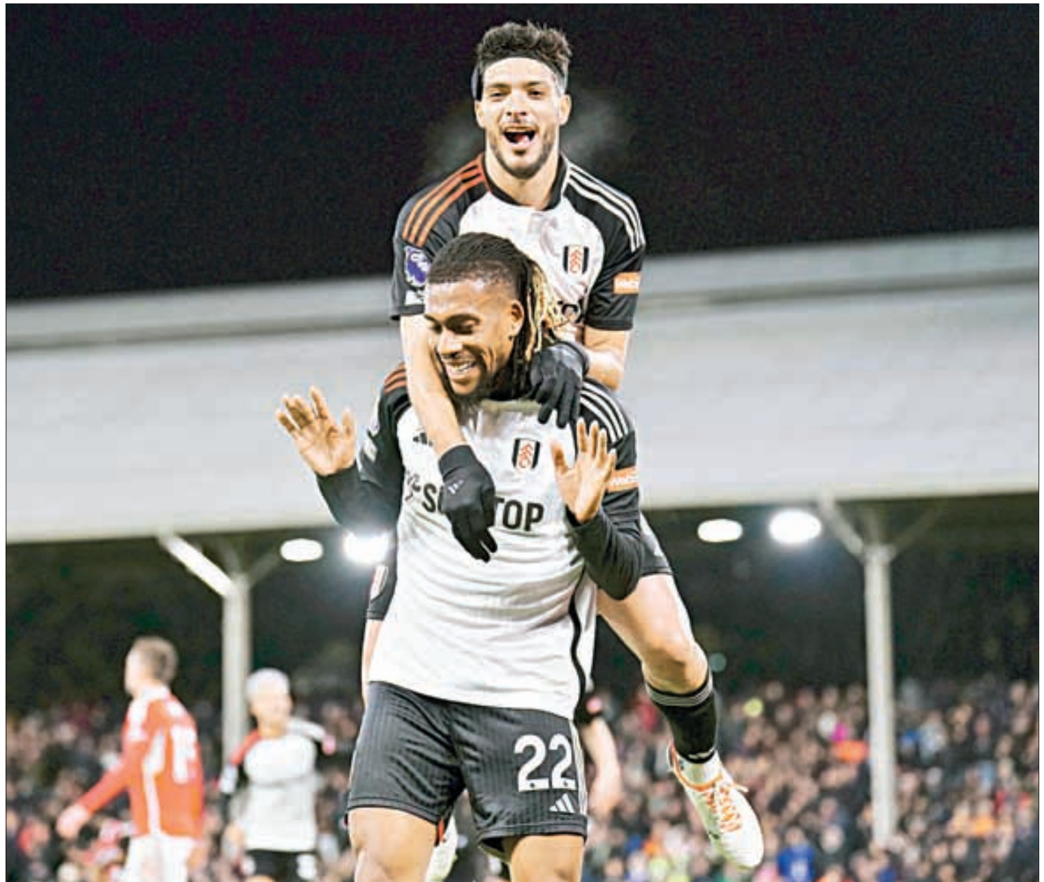
▲ El delantero mexicano festeja con su compañero Alex Iwobi (22) su encuentro con el gol en la Liga Premier.

Otros resultados: Manchester United 2-1 Chelsea; Liverpool 2-0 Sheffield United; Brighton 2-1 Brentford, y Bournemouth 2-0 Crystal Palace.