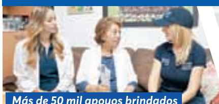
Más de 50 mil apoyos brindados