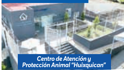
Centro de Atención y Protección Animal "Huixquican"