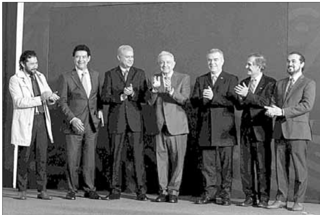
▲ El Presidente destacó el carácter “histórico” del incremento logrado por consenso. En la imagen, con representantes empresariales y de sindicatos.

Las negociaciones se llevaron a cabo en el Tribunal Federal de Asuntos Colectivos en la Ciudad de México con representantes de la empresa fabricante de bolsas de aire, volantes y cinturones de seguridad para vehículo.