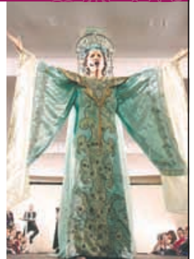
Hilos dramáticos: Una pasarela de vestuario operístico

22:00 TIEMPO DE FILMOTECA UNAM: FAMILIAS DISFUNCIONALES Canino De Yorgos Lanthimos (Grecia, 2009)