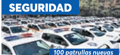
100 patrullas nuevas