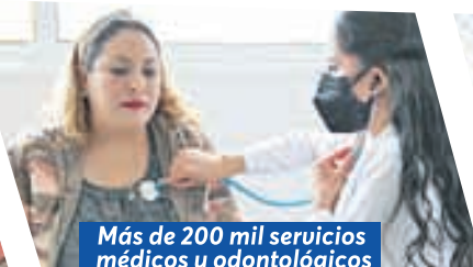
Más de 200 mil servicios médicos y odontológicos