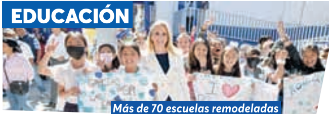
Más de 70 escuelas remodeladas