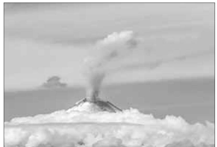
▲ El volcán Popocatepetl, en imagen del pasado 29 de noviembre.

Explicó que en caso de presentarse caída de ceniza en municipios aledaños al volcán, se exhortó a la población evitar actividades al aire libre, mantener puertas y ventanas cerradas, cubrir depósitos de agua, así como proteger ojos, nariz y boca de forma adecuada. El semáforo de Alerta Volcánica del Popocatepetl se encuentra en Amarillo fase 2.