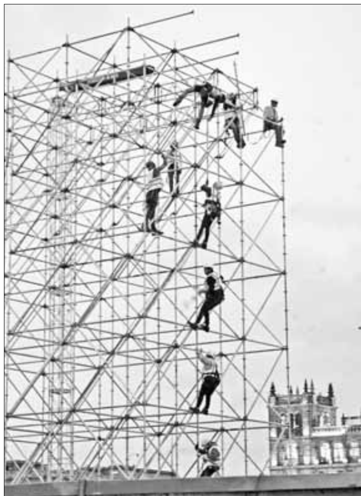
▲ Trabajadores del gobierno capitalino olvidan el frío y dan su máximo esfuerzo en el Zócalo de la Ciudad de México.

SECRETARÍA AUXILIAR DE EMPLAZAMIENTOS A HUELGA JUNTA ESPECIAL NÚMERO QUINCE EXPEDIENTE NÚMERO III-3089/2020 SINDICATO “TIERRA Y LIBERTAD” DEL GENERAL EMILIANO ZAPATA SALAZAR LABORATORIOS ZERBONI, S.A.