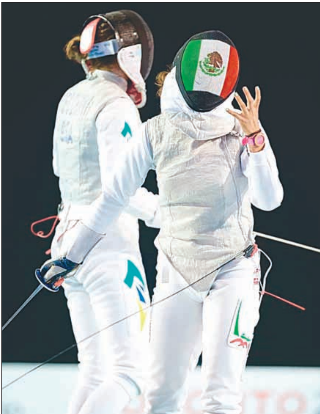
▲ El conflicto se desata cuando falta menos de un año para los Olímpicos de París.

Este conflicto, que involucra siglas de federaciones y autoridades, no es una simple lucha interna por el control de los organismos, advierte Jiménez. Además de que refleja la falta de colaboración entre dirigentes y oficinas, algunos de estos desencuentros pueden afectar el interés colectivo y provocar un daño en el erario.