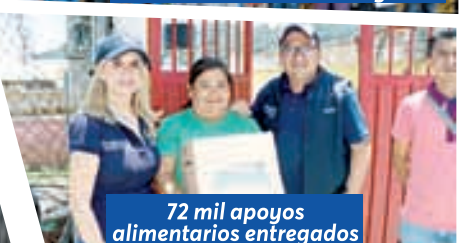
72 mil apoyos alimentarios entregados

18 VECES EL MEJOR GOBIERNO DE TODO EL PAÍS