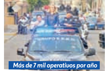
Más de 7 mil operativos por año