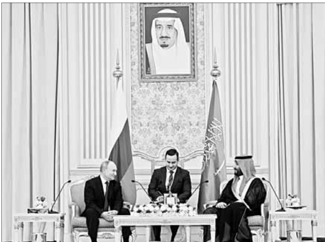
▲ Encuentro del mandatario ruso (izquierda) con el príncipe heredero saudita Mohamed bin Salmán, en el palacio Al Yamamah, en Riad. En la parte superior, imagen del rey Salmán.

Bin Zayed, tras agradecer que Putin expusiera su visión de “la crisis