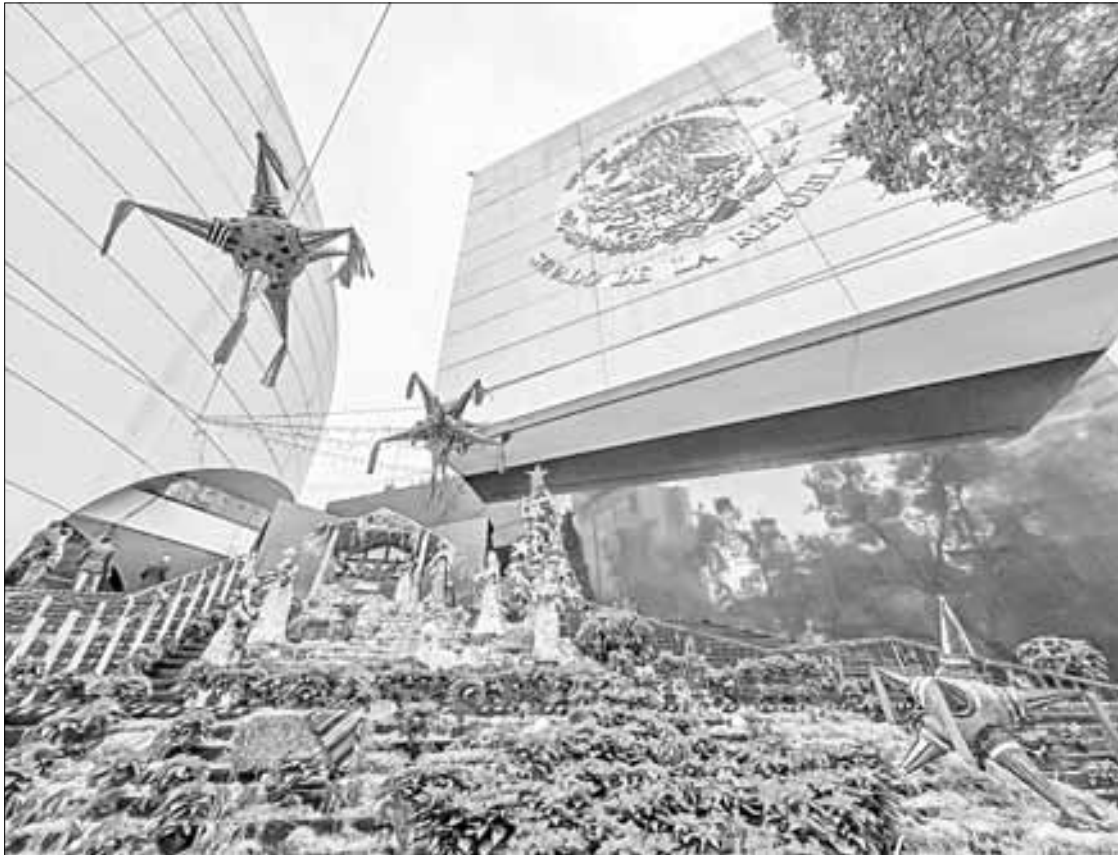
▲ En las escaleras principales de acceso al Senado.