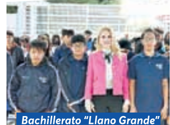
Bachillerato "Llano Grande"