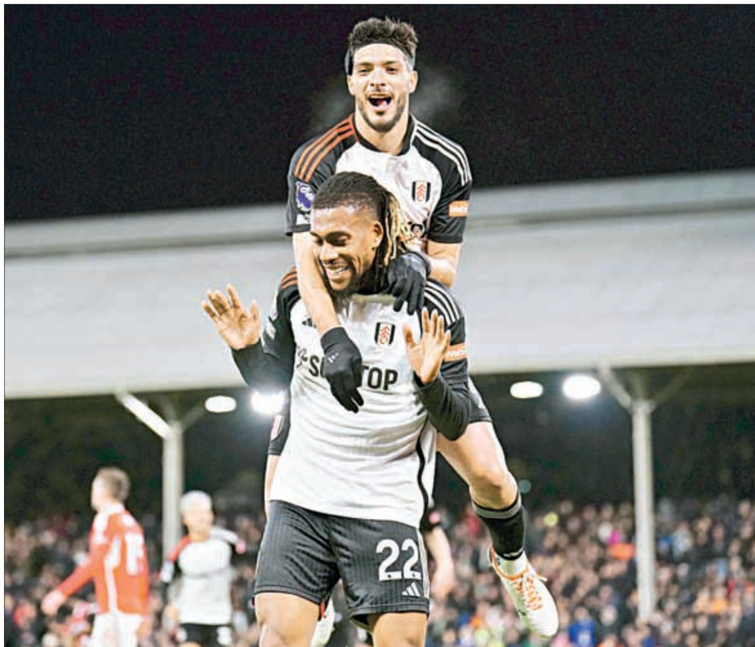
▲ El delantero mexicano festeja con su compañero Alex Iwobi (22) su encuentro con el gol en la Liga Premier.

Otros resultados: Manchester United 2-1 Chelsea; Liverpool 2-0 Sheffield United; Brighton 2-1 Brentford, y Bournemouth 2-0 Crystal Palace.