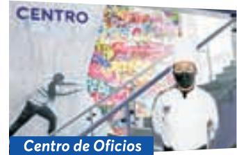
Centro de Oficios