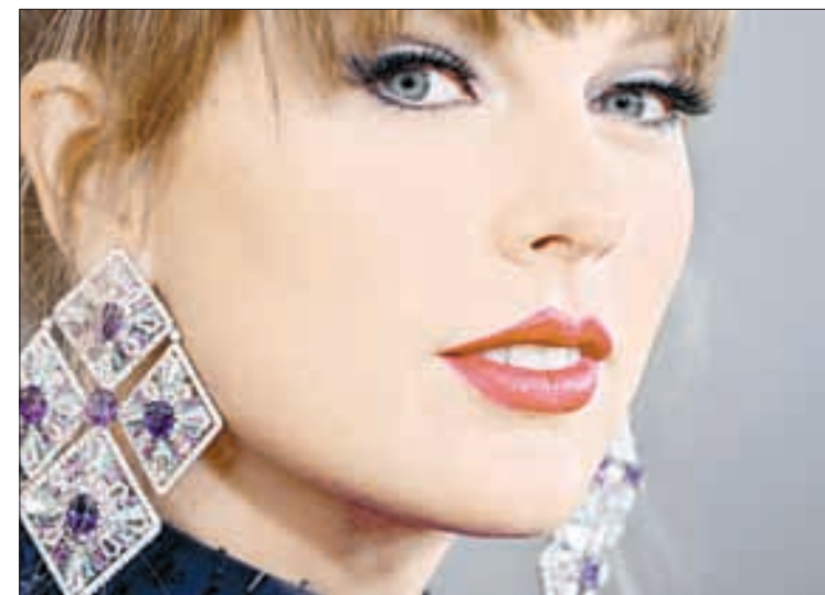
▲ Entre otros aspectos, la cantante ha dejado huella en las mujeres que han sido maltratadas y por recuperar los derechos de su música, justificó la publicación.

Vencedora de una lista de finalistas en la que estaban los presidentes de Rusia y China, el director ejecutivo de OpenAI, los huelguistas de Hollywood, los fiscales que inculparon a Donald Trump y hasta Barbie , Swift es una de las pocas mujeres en recibir esta distinción.