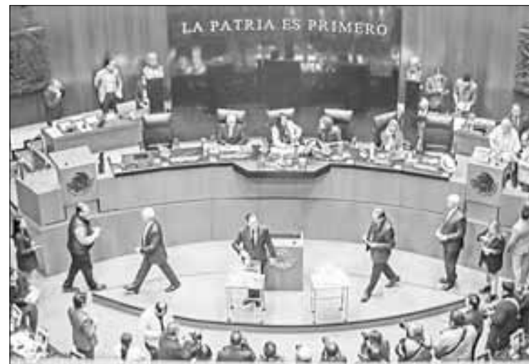
▲ Senadores votaron ayer, como apremió la Corte, dos ternas para comisionados del instituto de transparencia.