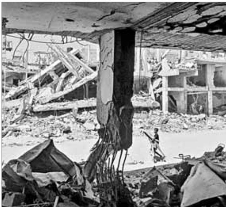
▲ En la imagen de arriba, momento en el que el tribunal anuncia el fallo de la Corte Internacional de Justicia. Sobre estas líneas, un niño carga chatarra entre edificios destruidos en Jan Yunis, Gaza.

El primer ministro israelí, Benjamin Netanyahu, se encuentra bajo fuerte presión dentro de su país para poner fin a la guerra. Cientos