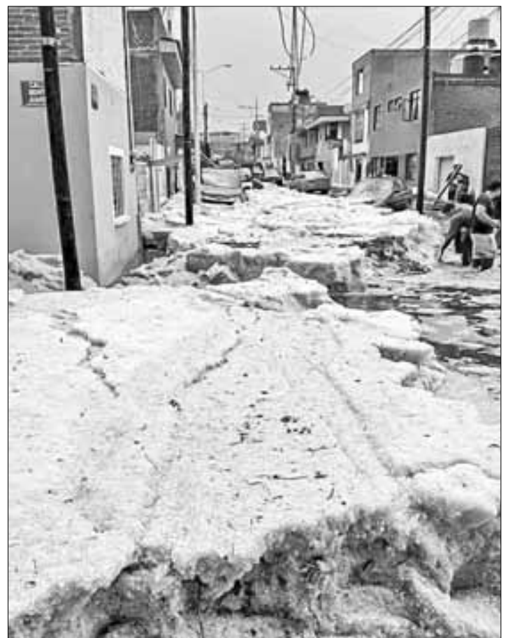
▲ Una de las zonas más afectadas por la granizada de ayer fue la norponiente, en la capital de Puebla, donde el granizo alcanzó hasta 50 centímetros de altura.