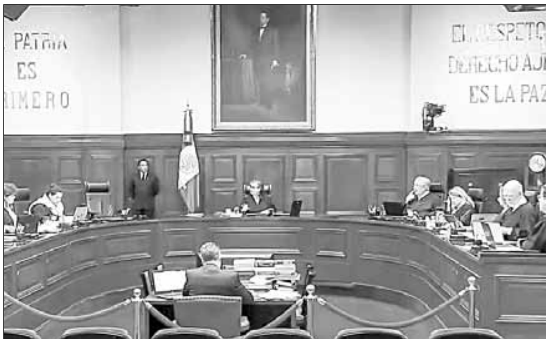
◀ Las denuncias por irregularidades en fallos del Poder Judicial se presentaron del 26 de enero de 2023 al pasado día 6.

La Procuraduría Fiscal presentó una queja ante la Corte y solicitó el inicio de un procedimiento al ministro Luis María Aguilar por “beneficiar” a Grupo Elektra, en juicios en los que se le exigen más de 25 mil millones de pesos en impuestos.