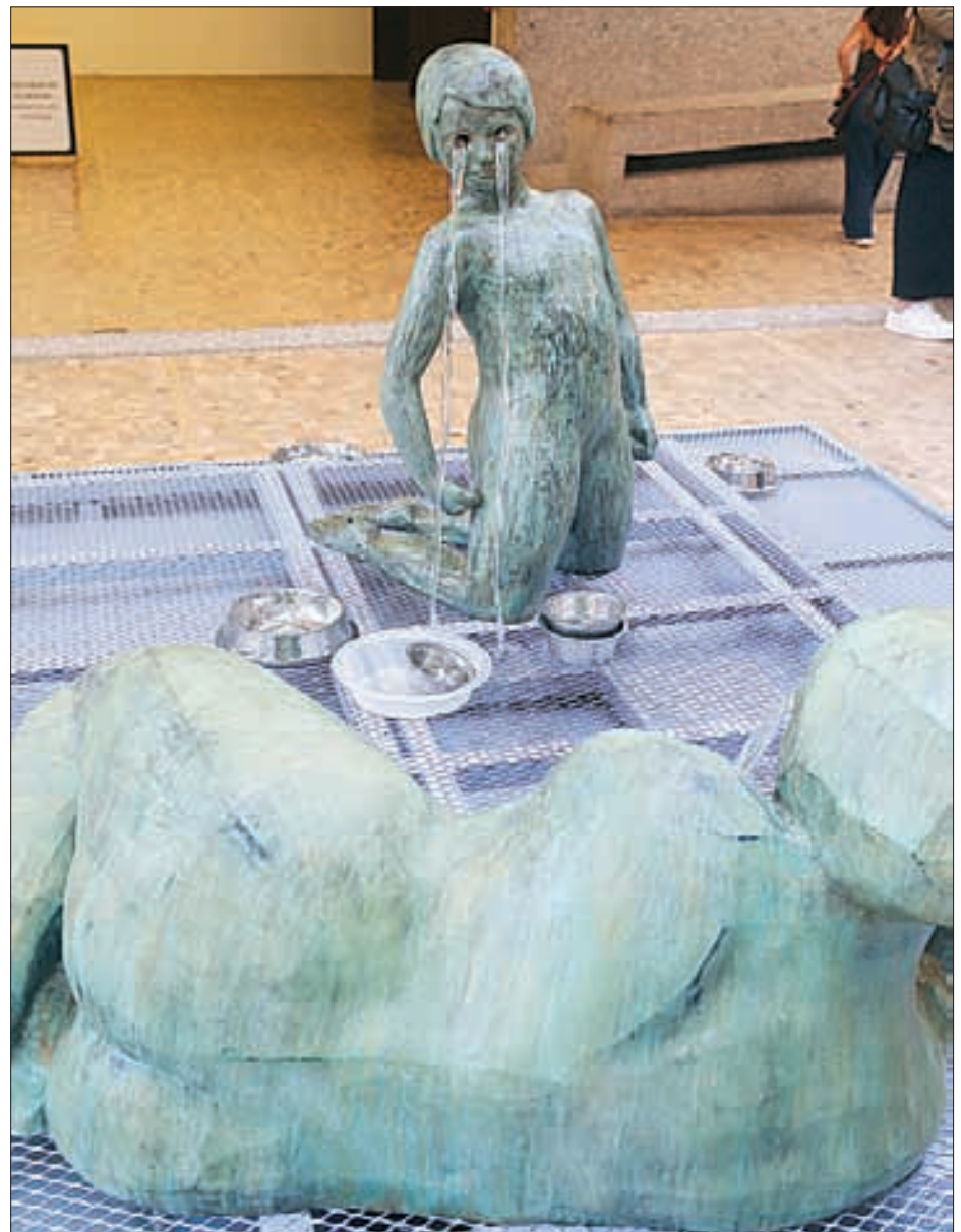
LA ARTISTA DANESA Nina Beier inauguró ayer su exposición Casts , en el Museo Tamayo. La muestra pretende convertirse en el escenario de una serie de encuentros performáticos , discretos e intermitentes, que resignifican el contenido de las salas de