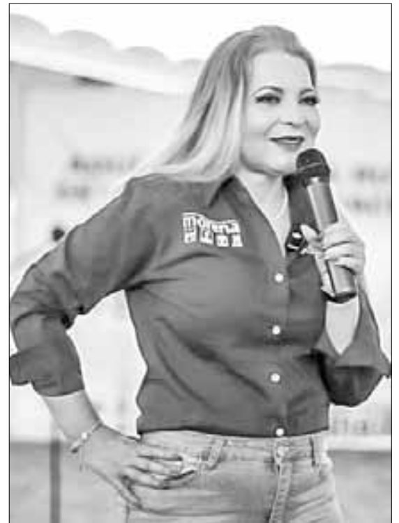
▲ Los candidatos a la gubernatura de Jalisco, Pablo Lemus, de Movimiento Ciudadano, y Claudia Delgadillo, de la coalición Sigamos Haciendo Historia (Morena, PT, PVEM y los partidos locales Futuro y Hagamos).