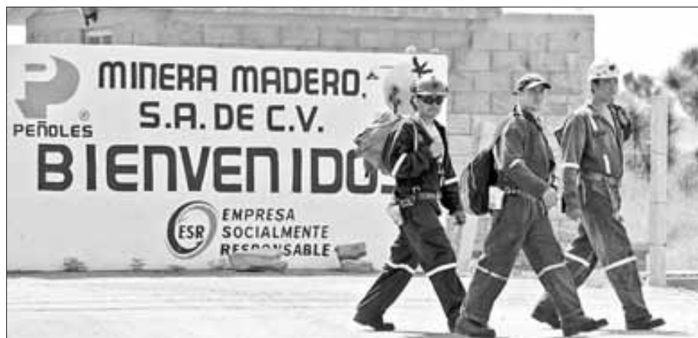
▲ La concentración de la minería generó fortunas de ensueño en el país.

Twitter: @cafevega cfvmexico_sa@hotmail.com