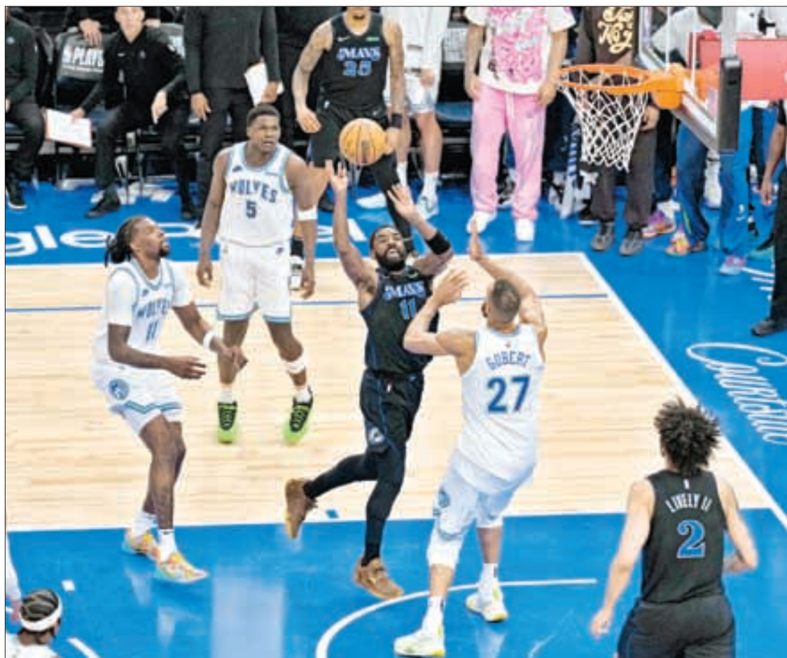
▲ La estrella Kyrie Irving (11) contribuyó también a la victoria de Dallas al encestar 20 puntos, lograr

tampoco, pero así son las cosas”, comentó Zverev, quien llega reforzado al torneo parisino con su reciente título en el Masters 1000 de Roma.