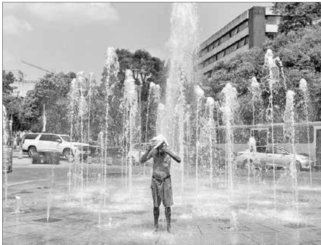
▲ Sin pena, al fin los 32 grados a la sombra lo valen.