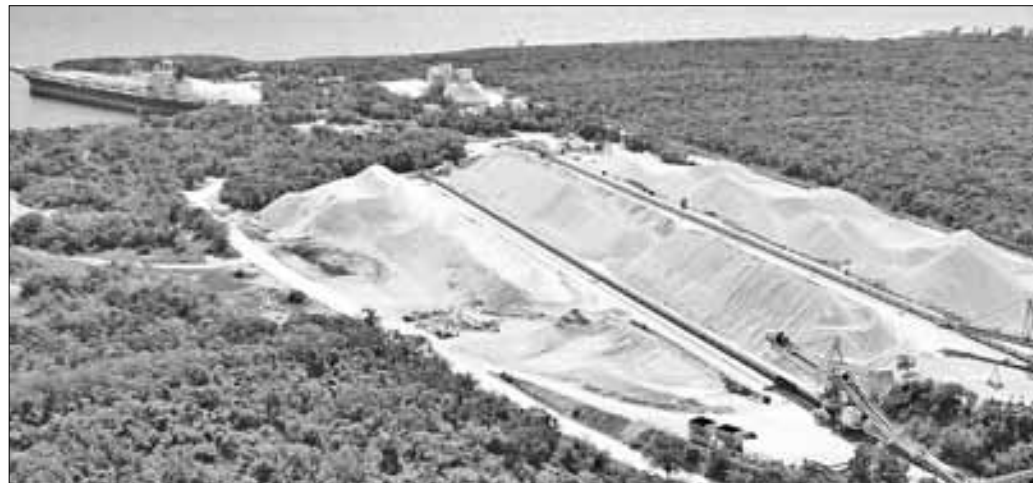
▲ El presidente Andrés Manuel López Obrador ha señalado que la empresa Calica se burló y engañó al gobierno mexicano porque ha

X: @cafevega Correo: cfvmexico_sa@hotmail.com