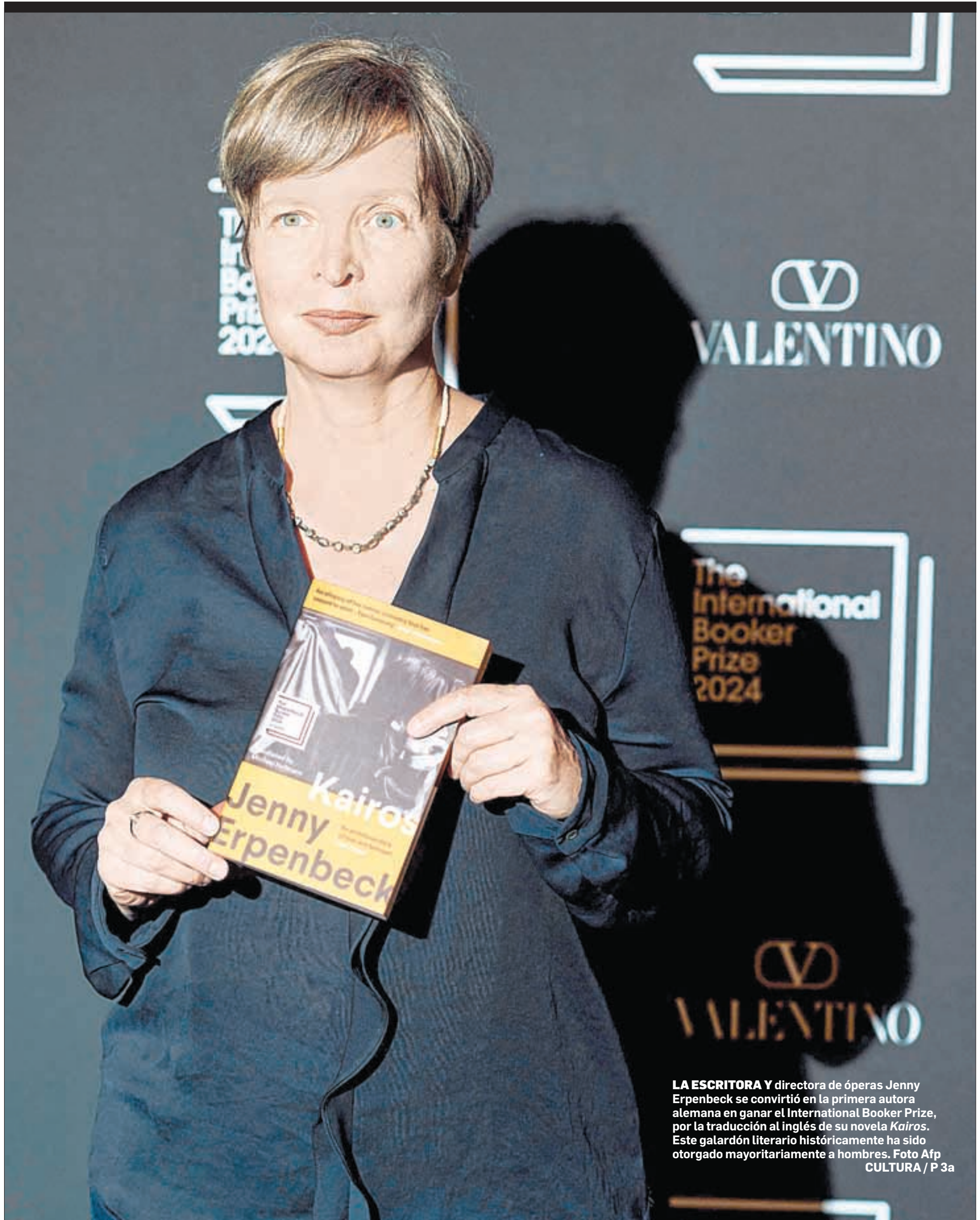
LA ESCRITORA Y directora de óperas Jenny Erpenbeck se convirtió en la primera autora alemana en ganar el International Booker Prize, por la traducción al inglés de su novela Kairos. Este galardón literario históricamente ha sido otorgado mayoritariamente a hombres. CULTURA / P 3a