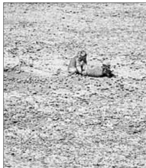
▲ Grupos de conservación de fauna silvestre y la Universidad Autónoma de Zacatecas llevan zana-

El especialista informó que ante la emergencia climática, el grupo de conservación de fauna silvestre al que él pertenece, y con el respal-