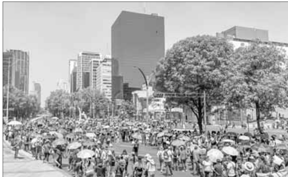
▲ En otra jornada del paro indefinido al que convocaron los maestros disidentes, ayer