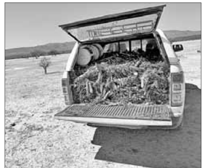
horias de desecho a perritos de la pradera, especie afectada por la fuerte sequía en Concepción del Oro y El Salvador, que fueron donadas por labriegos del municipio de Guadalupe.

do de la Universidad Autónoma de Zacatecas, han emprendido un programa de sobrevivencia de una de las tres colonias del perrito de la pradera, que hace cinco años se reintrodujo en la entidad.