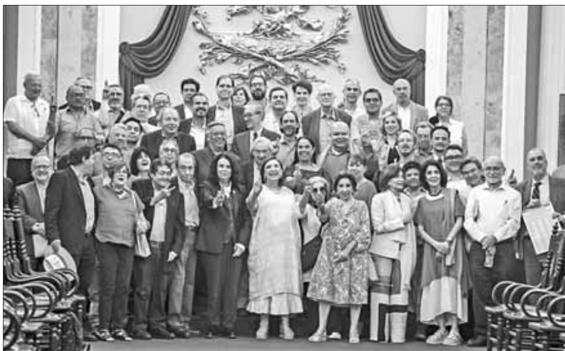
▲ En vísperas de las elecciones, Xóchitl Gálvez recibió el apoyo de unos 250 intelectuales. Unos 50 de ellos se reunieron ayer con la candidata en la Ciudad de México.

Por la tarde, en la Plaza de los Mártires de Toluca, reiteró su acusación contra Mario Delgado. “Cuando ellos llegan, entran por la aduana Reynosa, miles, millones de barriles de gasolina sin pagar impuestos. Datos del SAT y que salga a desmentirme, 150 millones de barriles entraron. ¿Saben cuánto dinero es eso? 700 mil millones de pesos que se han robado del erario. Por eso no hay dinero, por eso no hay dinero para la salud, por eso cerraron las estancias infantiles”, dijo la hidalguense.