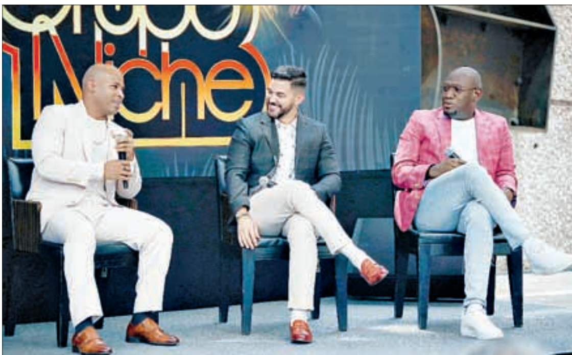
▲ Integrantes de la banda colombiana de salsa, en conferencia de prensa.

“ Tocarán temas clásicos como Gotas de lluvia ”