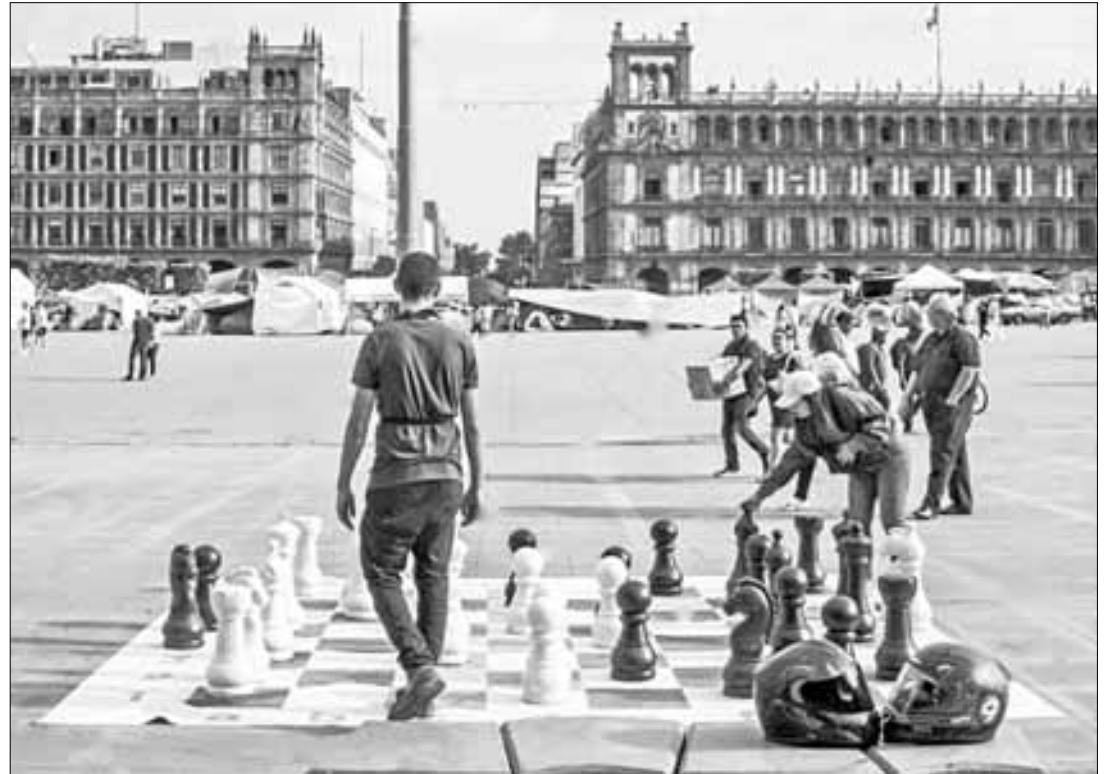
▲ Aficionados del ajedrez en el corazón de la Ciudad de México.