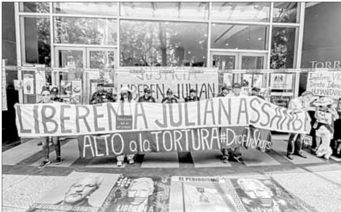
▲ El Colectivo #24F Coalición Vida y Libertad Julian Assange criticó que "ya son 13 años de sufrir

El amparo fue resuelto el año pasado en la Sala por mayoría de cuatro votos, motivo por el cual constituyó jurisprudencia por precedente obligatorio.