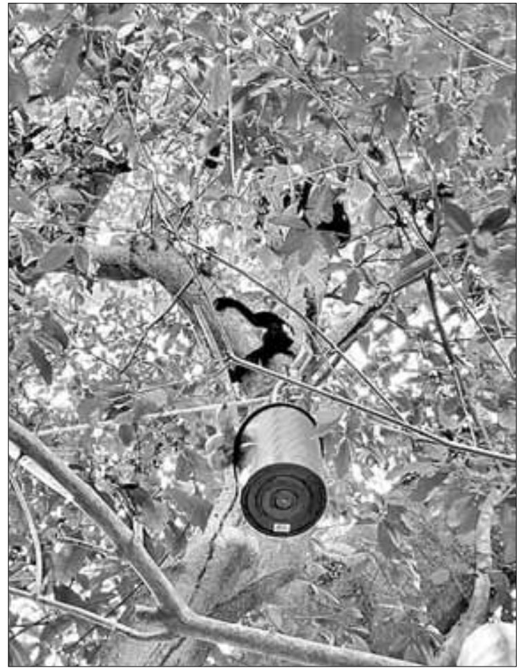
▲ Pobladores de Comalcalco, Tabasco, han colocado cubetas con agua en lo alto de los árboles con la finalidad de que los monos saraguatos puedan hidratarse, luego de la mortandad que ha comenzado a registrarse de esa especie.

Mencionó que “en el transcurso de mayo se han recibido reportes sobre la muerte de ejemplares de vida silvestre, en particular monos aulladores, en la región que comprende la Chontalpa en los municipios de Cunduacán, Comalcalco, Paraíso, Nacajuca y Jalpa de Méndez, en Tabasco, así como en los municipios de Juárez y Pichucalco en Chiapas”.