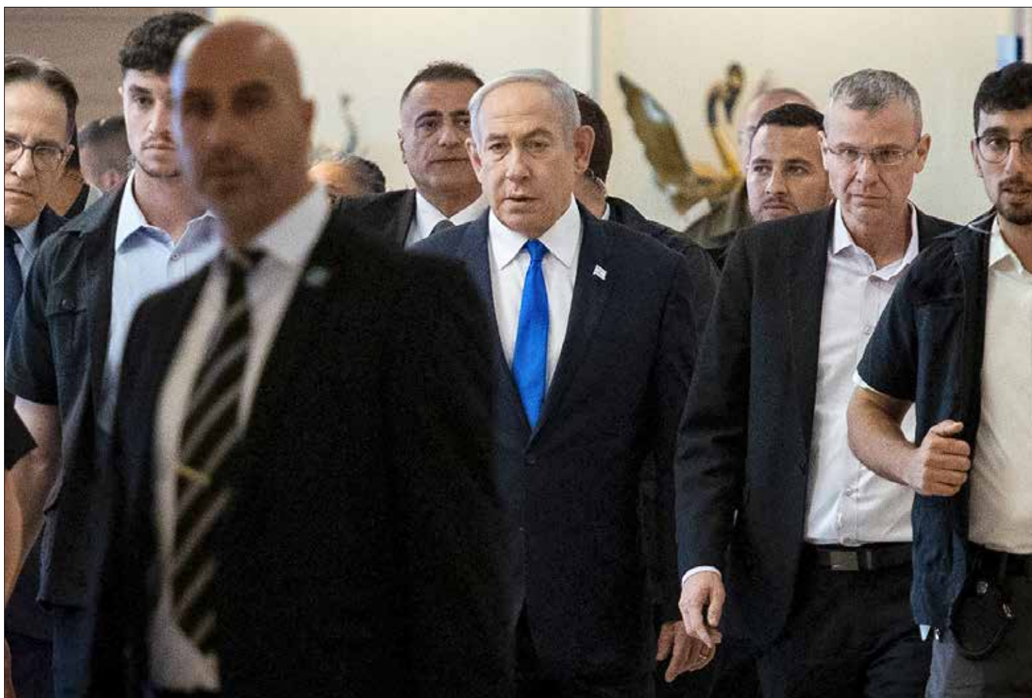
▲ Benjamin Netanyahu llega a una reunión en el Parlamento israelí, en Jerusalén. En declaraciones tras conocer la petición del fiscal en jefe de la Corte Penal Internacional para su detención, el gobernante

“¿Cómo se atreven a compararnos?”, dice el premier