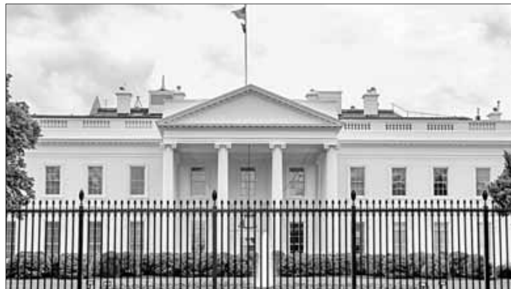
▲ La Casa Blanca tildó de “vergonzosa” la decisión de la Corte Penal Internacional, que solicitó el arresto del premier israelí y altos

Twitter: @cafevega cfvmexico_sa@hotmail.com