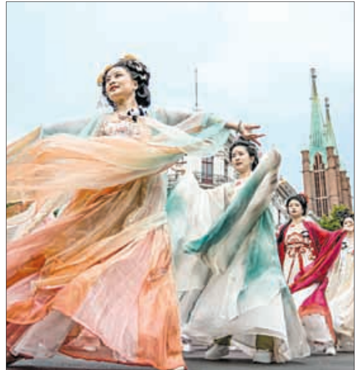
▲ Representantes de China en el certamen anual que se lleva a cabo en Berlín, Alemania.