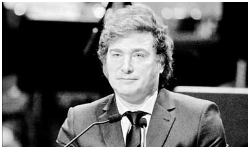
▲ En Londres, un portavoz de la monarquía declinante de Gran Bretaña alucina que “Milei convertirá a Argentina en la Texas de AL” con sus reservas de gas esquisto y litio.

http://alfredojalife.com https://www.facebook.com/AlfredoJalife https://vk.com/alfredojalifeoficial https://t.me/AJalife https://www.youtube.com/channel/UCIfxfOTHzDPL_cOLd7psDsw?view_as=subscriber https://vm.tiktok.com/ZM8KnkKQn/ https://twitter.com/AlfredoJalife Instagram: @alfredojalifer