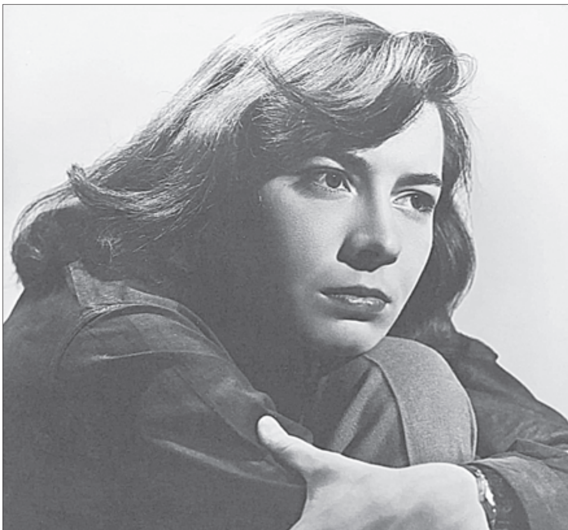
▲ La narradora estadounidense Patricia Highsmith retratada en 1948.