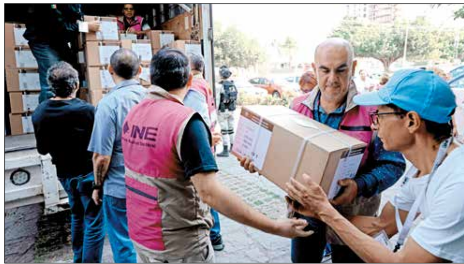
▲ Personal del INE descarga los insumos en Zapopan, Jalisco.