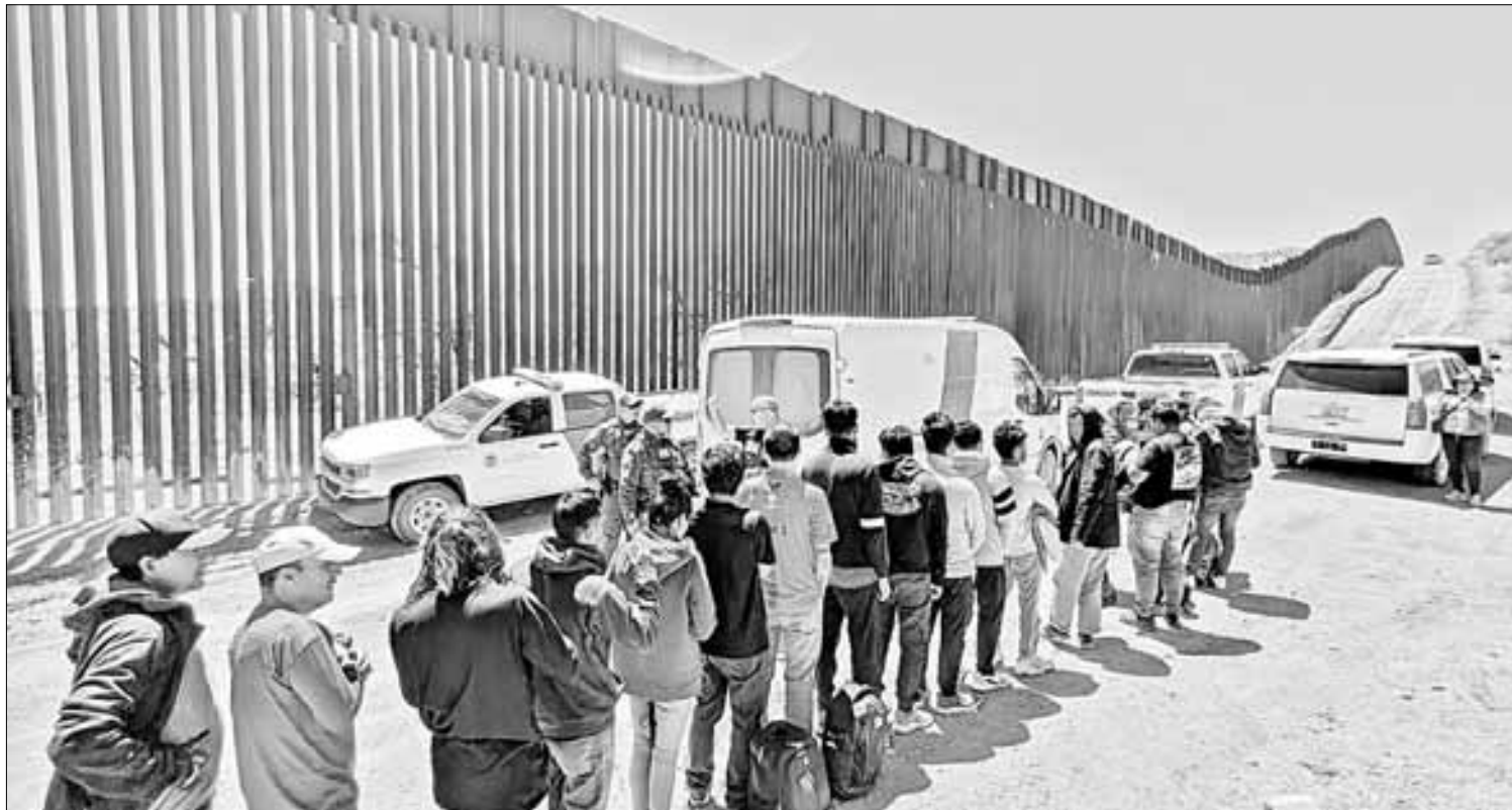
◀ En el Puerto de Entrada Hidalgo, de McAllen, Texas, procesan 200 solicitudes de asilo al día.

MEXICANA RECOMIENDA "QUE NO SE DESESPEREN"