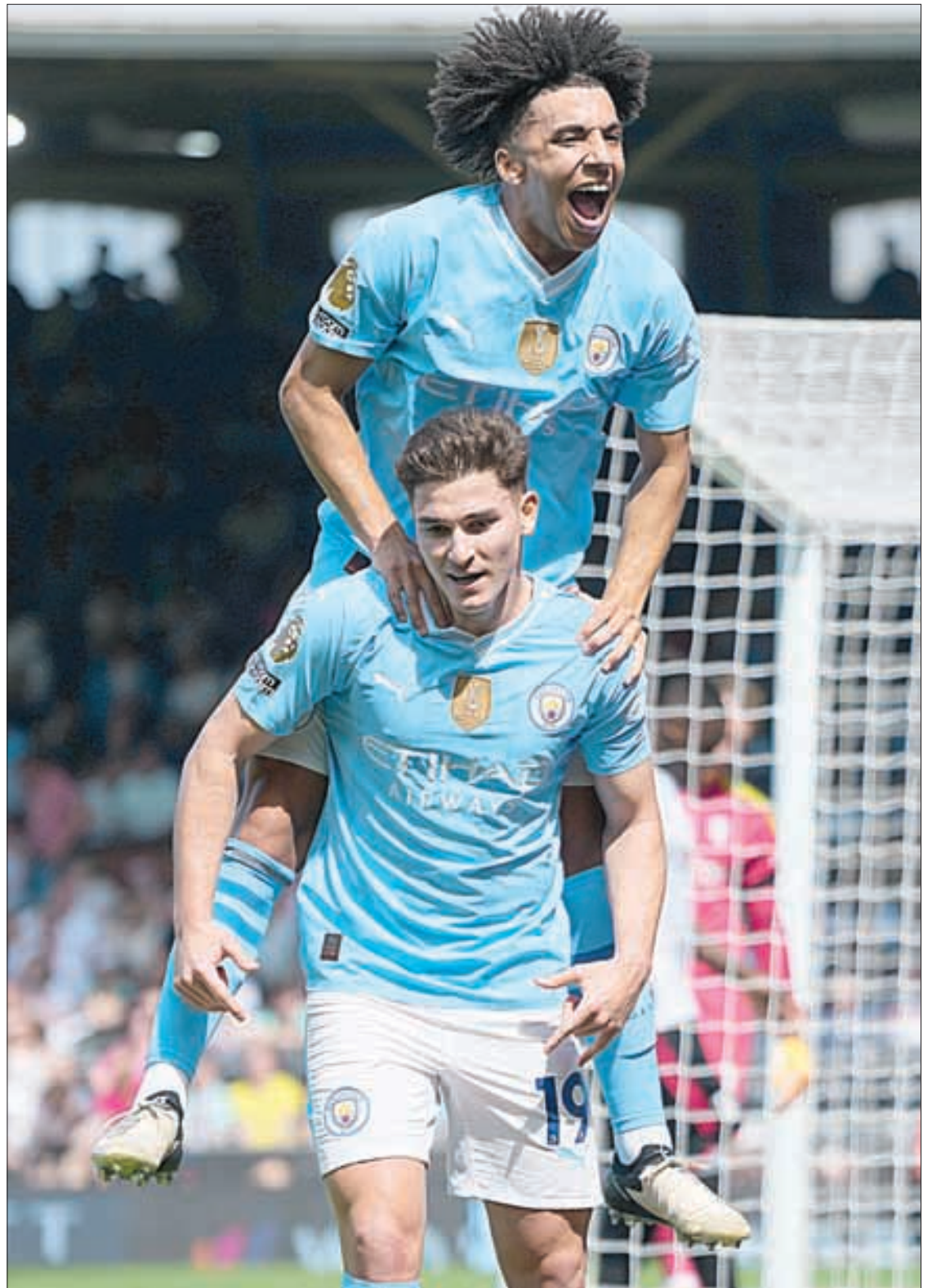
▲ El argentino Julián Álvarez (19) celebra con Rico Lewis después de anotar el cuarto gol en el triunfo de su equipo Manchester City por 4-0 sobre Fulham en el estadio Craven Cottage de Londres.

Más resultados: Bournemouth 1-2 Brentford; Everton 1-0 Sheffield United; Newcastle 1-1 Brighton; West Ham 3-1 Luton; Wolverhampton 1-3 Crystal Palace, y Nottingham 2-3 Chelsea.