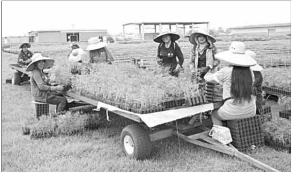
▲ Trabajadoras de la Comisión de Recursos Naturales capitalina, en Tláhuac.

Es factible que las trabajadoras se acerquen a sus jefes inmediatos para hablar de su situación, ya sea que necesiten laborar más días desde casa, establecer horarios de trabajo o de reuniones o llevar a sus hijos a la oficina. Compartir, por ejemplo, los horarios escolares de los hijos, la guardería o las citas médicas, allana el camino hacia la transparencia y la confianza.