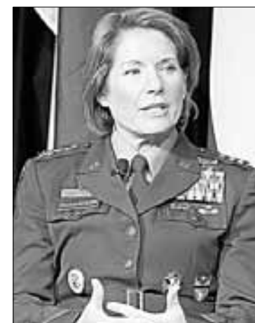
▲ Laura Richardson, jefa del Comando Sur de EU.

Antes, la jefa del Comando Sur ya había arremetido contra China en términos similares, por lo que desde Pekín acusaron a Washington de "doble rasero" y recordaron que Estados Unidos "tiene alrededor de 800 bases militares en el ultramar, con 173 mil militares estacionados en 159 países".