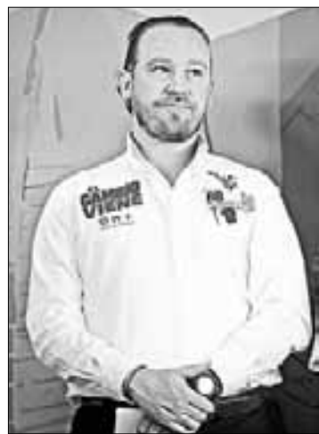
▲ A tres semanas de las elecciones, los tres abanderados apostarán por machacar los puntos