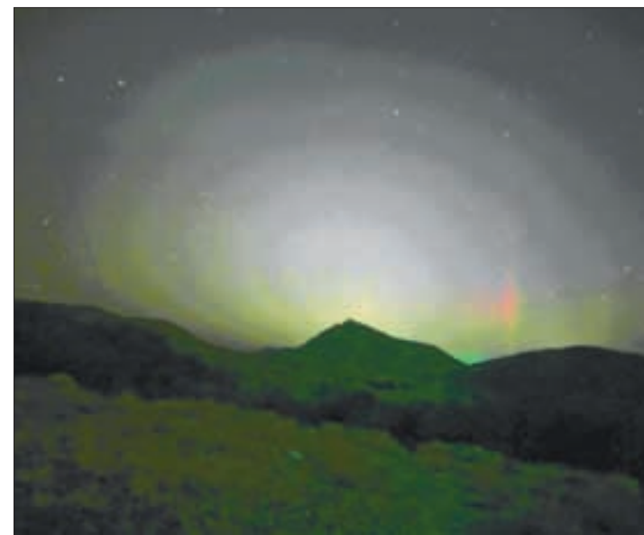
AFP Y REUTERS PARÍS Y CIUDAD DE MÉXICO

El fenómeno se apreció en Mexicali, Sonora, Chihuahua y Zacatecas