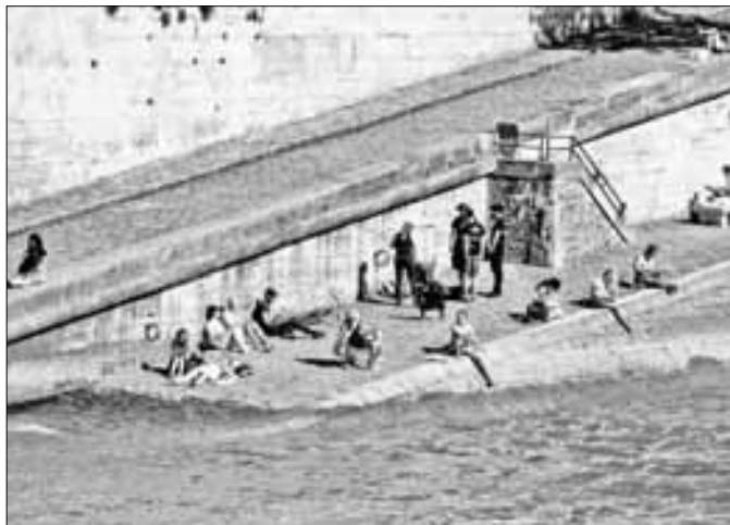
▲ Con el deshielo, el Sena se desborda en sus muelles bajos en el centro de París; el agua marrón y la corriente fuerte no hacen conveniente sumergirse en sus aguas.