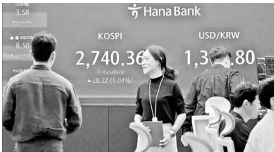
◀ Operadores de divisas pasan junto a la pantalla que muestra el índice compuesto de precios de las acciones de Corea (KOSPI), a la izquierda, y el tipo de cambio entre el dólar estadounidense y el won surcoreano en la sede del KEB Hana Bank en Seúl.

Por su parte, el índice referencial de la Bolsa Mexicana de Valores (BMV), el S&P/BMV/IPC, retrocedió 0.22 por ciento y cerró en 57 mil 718.04 puntos; no obstante, acumuló una ganancia semanal de 1.02 por ciento. La BMV siguió la tendencia de la bolsa de Nueva York, donde los principales índices también cerraron con modestas ganancias y anotaron un avance semanal.