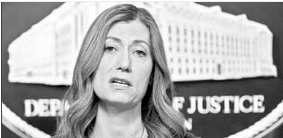
▲ La administradora de la agencia antidrogas estadounidense, Anne Milgram, durante una

Twitter: @cafevega cfvmexico_sa@hotmail.com