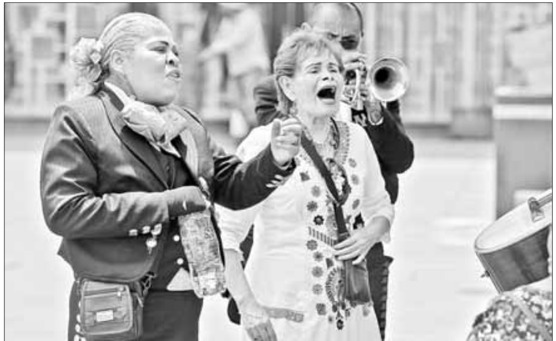
▲▶ Con el sentimiento a flor de piel, algunas se unieron al canto y en otras los recuerdos volvieron.

En Jamaica hay para todos los bolsillos: una rosa, 20 pesos; la docena, 130; ramos de 130 flores, mil