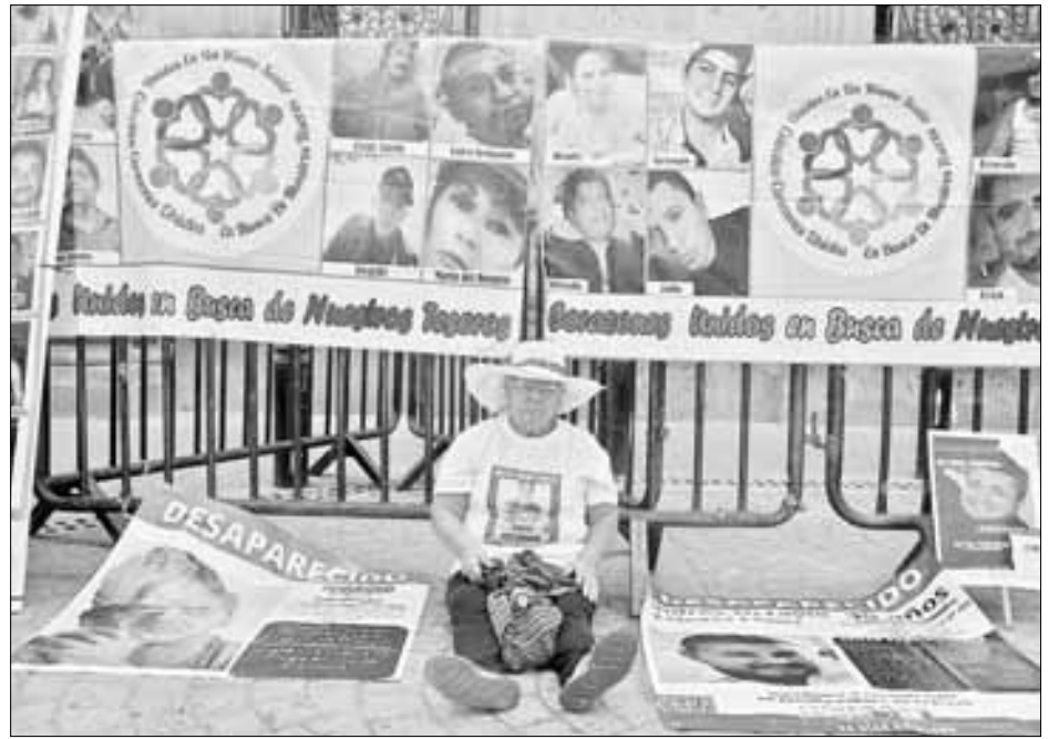
▲ Madres buscadoras en Veracruz protestaron ayer en la avenida Independencia, en la capital, para exigir la localización de sus familiares desaparecidos. A la derecha, inte-