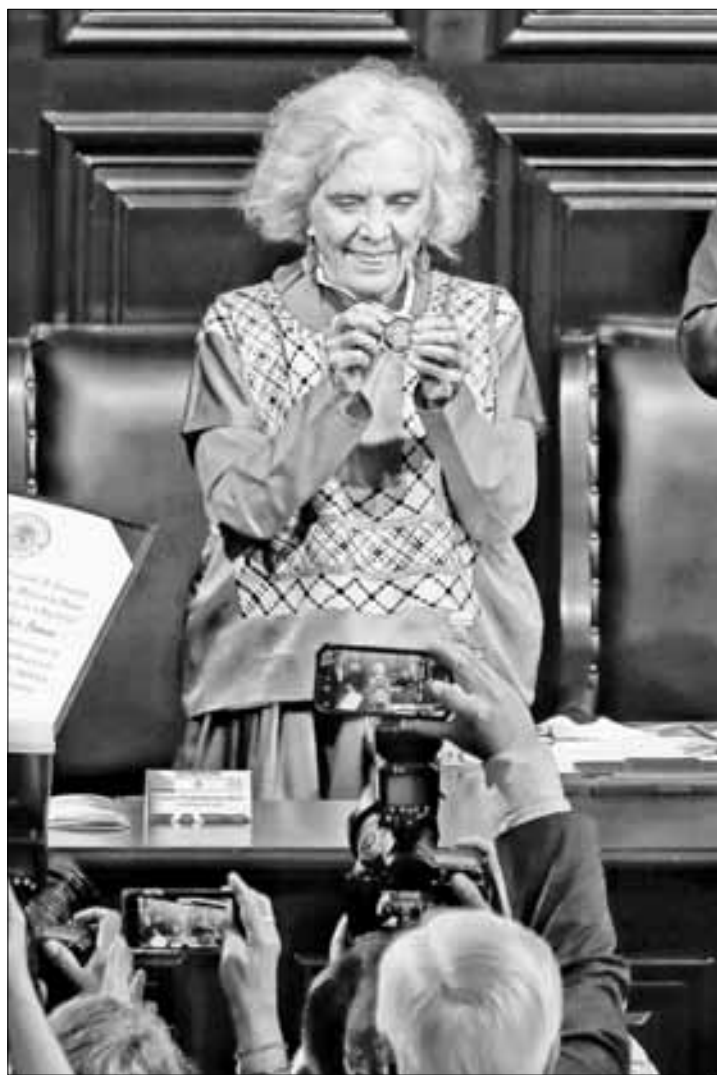
▲ El 19 de abril de 2023 se entregó la última Medalla Belisario Domínguez a la escritora y periodista Elena Poniatowska.

Vino luego la pandemia y en 2020 no se pudo llevar a cabo la ceremonia, que se pospuso hasta 2021, toda vez que aunque el