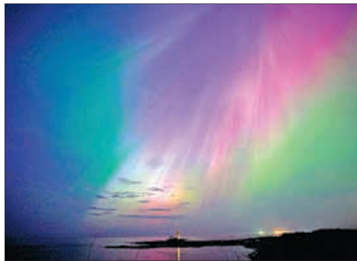
▲ Imagen de la aurora boreal que brilla en el horizonte en el faro de St. Mary en Whitley Bay, en la costa noreste de Inglaterra.