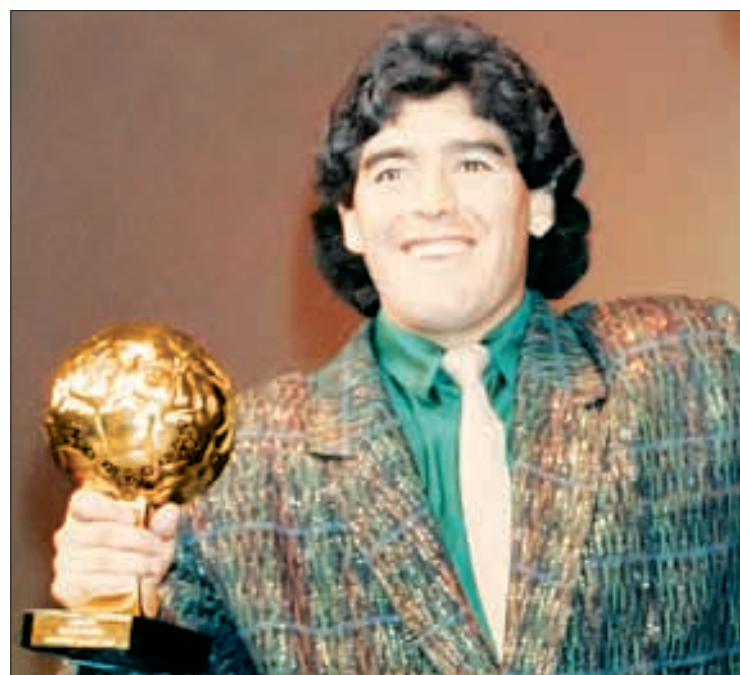
▲ Diego Maradona sostiene el Balón de Oro que obtuvo en la Copa Mundial de México 1986, durante la ceremonia de entrega celebrada en París, Francia, el 13 de noviembre de 1986.

Asimismo, la camiseta con el número 10 que vistió El Pelusa cuando marcó los goles ante Inglaterra, La mano de Dios y El gol del siglo , en cuartos de final de México 1986, fue ofrecida en mayo de 2022 por Sotheby's, alcanzando un valor de 8.4 millones de euros. Esta cantidad supuso un récord para cualquier artículo vendido anteriormente por la casa de subastas.