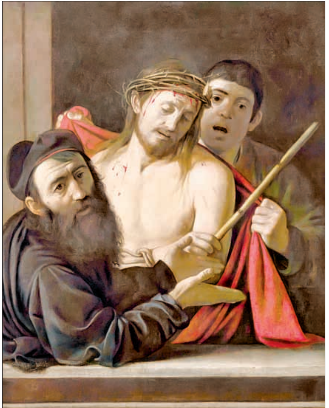
▲ “La obra es un poderoso ejemplo de la maestría de Caravaggio, (con) una hábil composición que presenta una escena tridimensional y dinámica