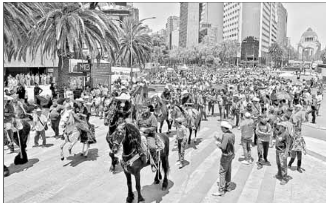
▲ Galleros, toreros y trabajadores de palenques marcharon ayer en la Ciudad de México para

demandar respeto a las tradiciones y a sus fuentes laborales.