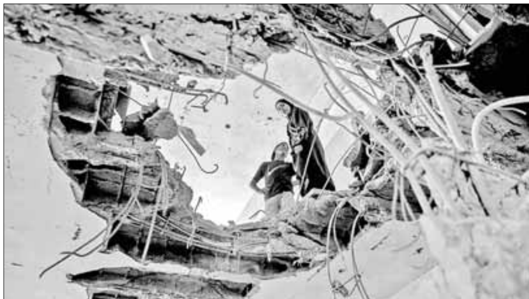
▲ Palestinos observan, ayer, la devastación por los bombardeos israelíes en una escuela manejada por la ONU en el campo de refugiados de Shati, en oeste de la ciudad de Gaza.

http://alfredojalife.com https://www.facebook.com/Alfredo.Jalife https://vk.com/alfredojalifeoficial https://t.me/AJalife https://www.youtube.com/channel/UCIfxfOThZD-PL_c0Ld7psDsw?view_as=subscriber https://vm.tiktok.com/ZM8KnkKQn/ https://twitter.com/AlfredoJalife Instagram: @alfredojalifer