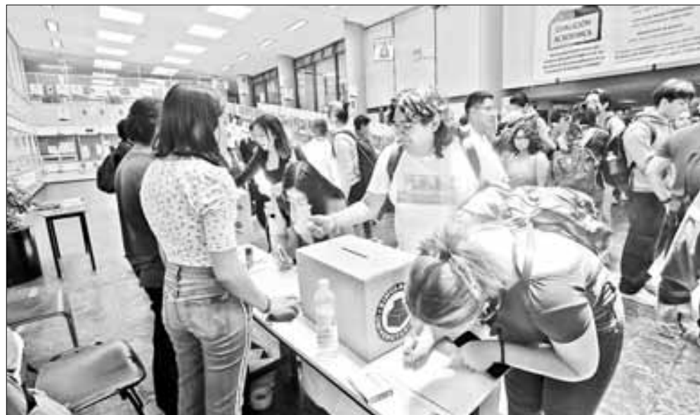
▲ Simulacro electoral ayer en Ciudad Universitaria para elegir al presidente de la República. Hubo actividad en la mayoría de

las facultades y sólo podían votar alumnos, docentes o trabajadores de la casa de estudios.