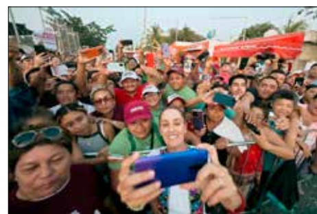
▲ Acto de campaña de Claudia Sheinbaum en Kanasín, Yucatán.