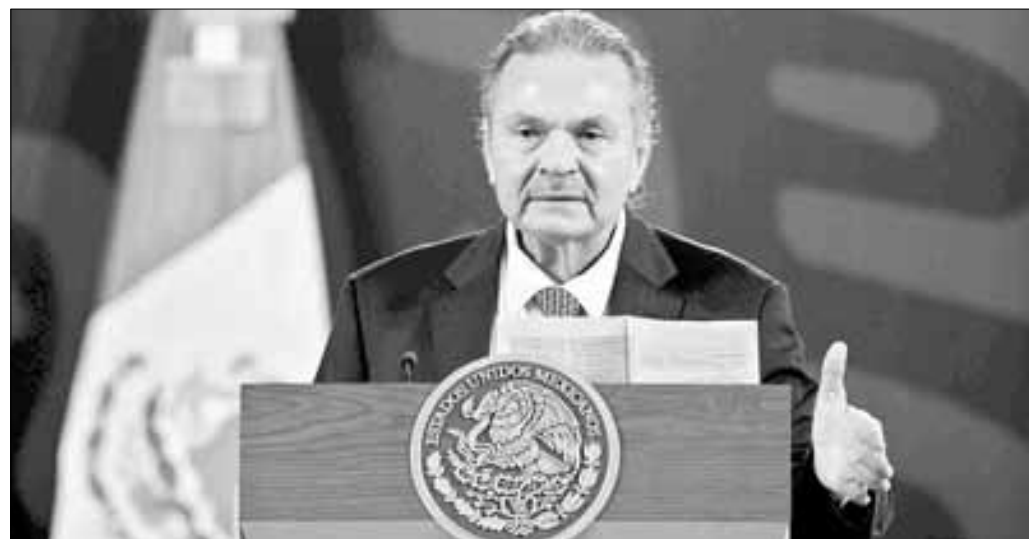
▲ En lo que va del actual gobierno, el saldo de la deuda de Petróleos Mexicanos se ha

Twitter: @cafevega cfvmexico_sa@hotmail.com