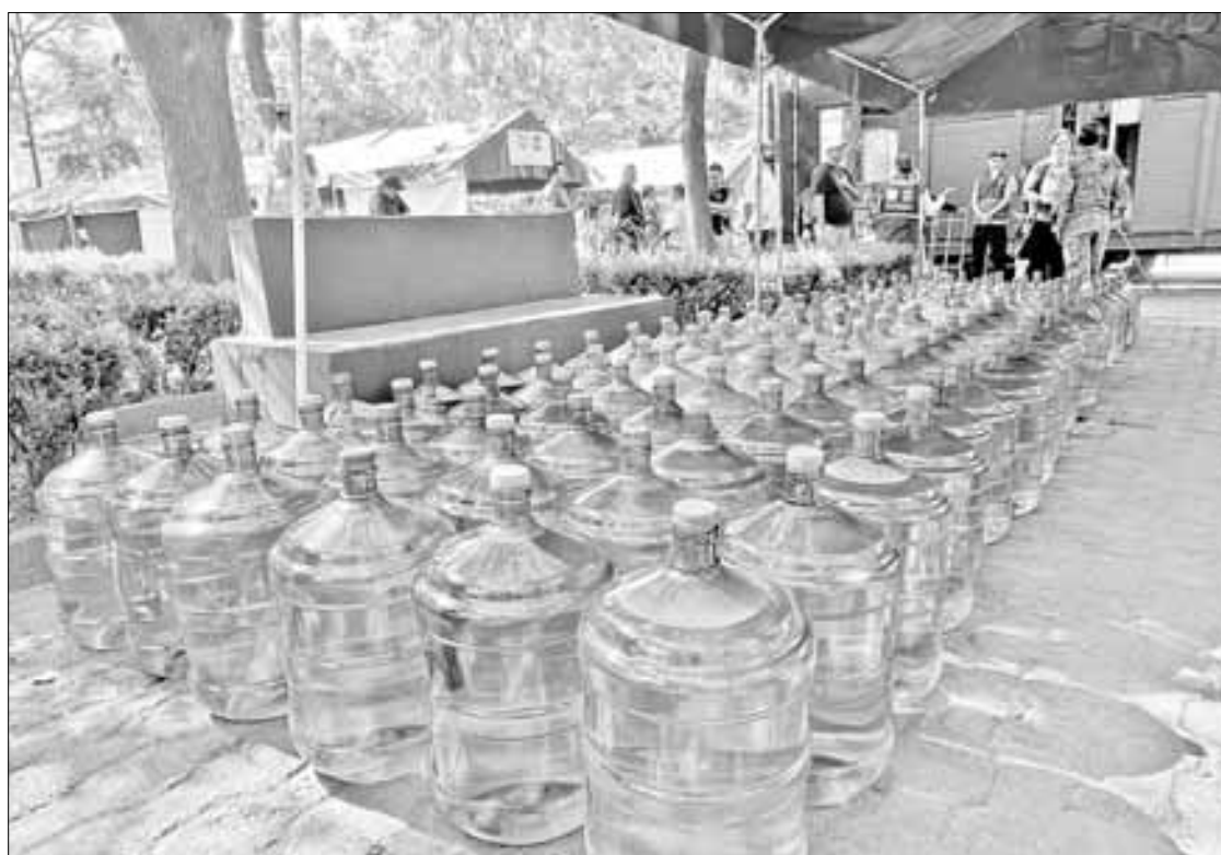
▲ Filas de garrafones que colonos de la alcaldía Benito Juárez llevaron para llenar con agua potable durante la crisis de la contaminación del líquido en