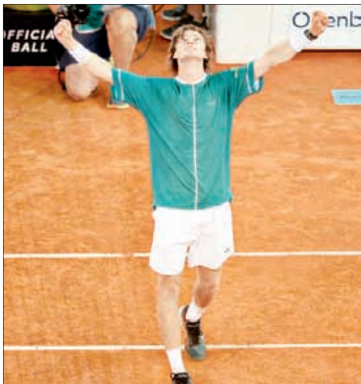
▲ Andrey Rublev reaccionó para vencer al canadiense Felix Auger-Aliassime y ganar el Abierto de Madrid por primera vez al sellar la victoria 4-6, 7-5, 7-5. Es el segundo título en un Masters 1000 para el ruso de 26 años y número ocho del mundo.