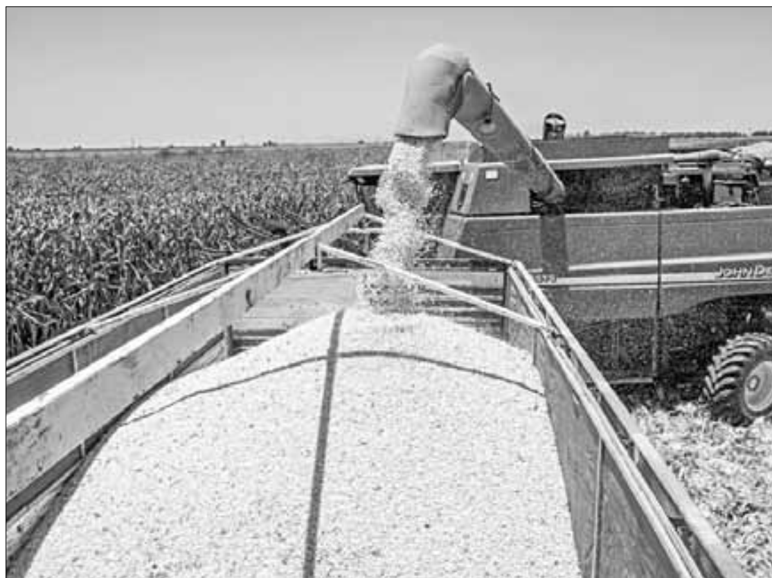
◀ Cosecha de maíz en Culiacán, Sinaloa. El año pasado las importaciones de este grano alcanzaron 19.7 millones de toneladas.

A mediados de febrero de 2023, México publicó modificaciones a un primer decreto de finales de 2020, en el que suavizó su postura en torno al maíz genéticamente modifica-