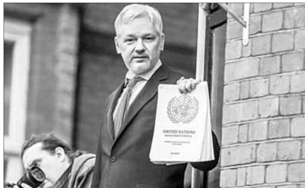
▲ En el Día Mundial de la Libertad de Prensa, el presidente Joe Biden exigió la liberación de los periodistas encarcelados por ejercer

Pete Seeger. Newspapermen . https://open.spotify.com/track/087MHEQ5xMBdFuiu5LaSeJ?si=d2f63caa625e4963