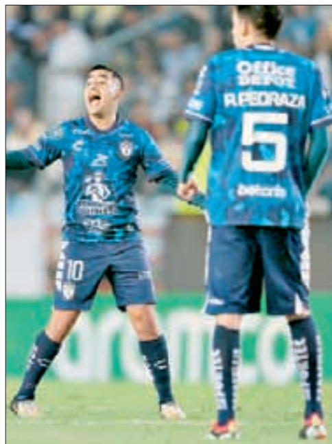
▲ El tuzo Erick Sánchez tiene ofertas en el fútbol mexicano, pero su prioridad es dar el salto a Europa.