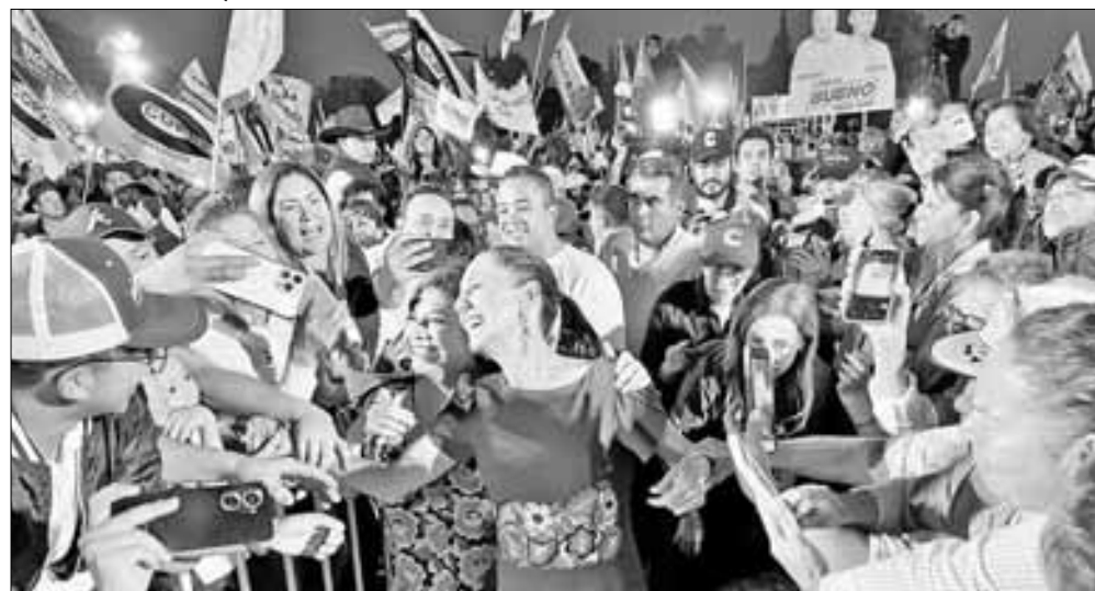
▲ La candidata presidencial Claudia Sheinbaum defendió por primera vez su relación política y de cercanía con Clara