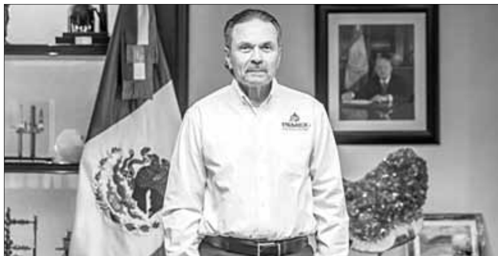
▲ Las revelaciones de Octavio Romero en la conferencia mañanera del viernes levantaron