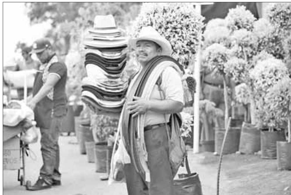
▲ Vendedor de sombreros en el mercado de Nativitas, Xochimilco, cuya demanda ha