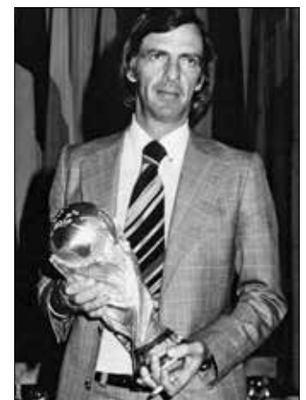
El Flaco falleció a los 85 años en Buenos Aires. Foto publicada por la AFA

A. ACEVES, J. VÁZQUEZ Y E. PALMA / DEPORTES