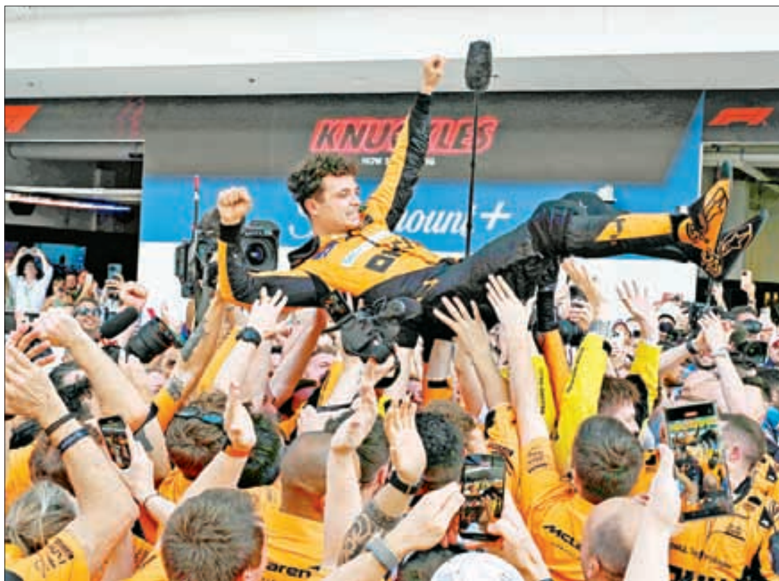
▲ El corredor británico de McLaren celebra con su equipo la hazaña de probar por vez primera el sabor de la victoria en F1, y dejar atrás a Max Verstappen.

Norris es el primer piloto desde Carlos Sainz que vence a Verstappen esta temporada —después de que quedó eliminado en Melbourne