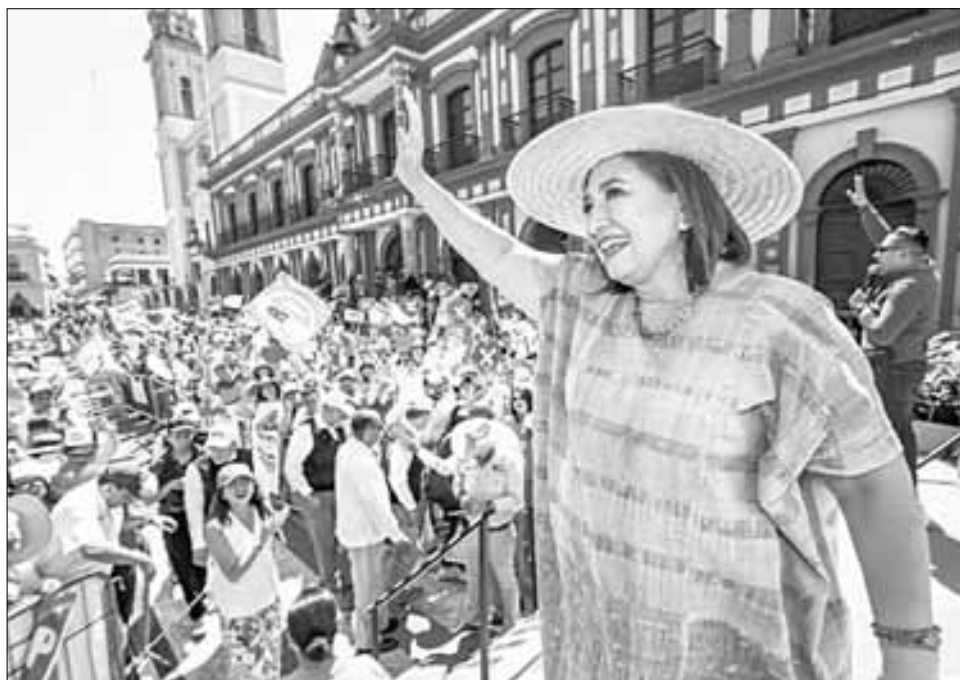
▲ La candidata de PRI, PAN y PRD durante un mitin ayer en Colima.