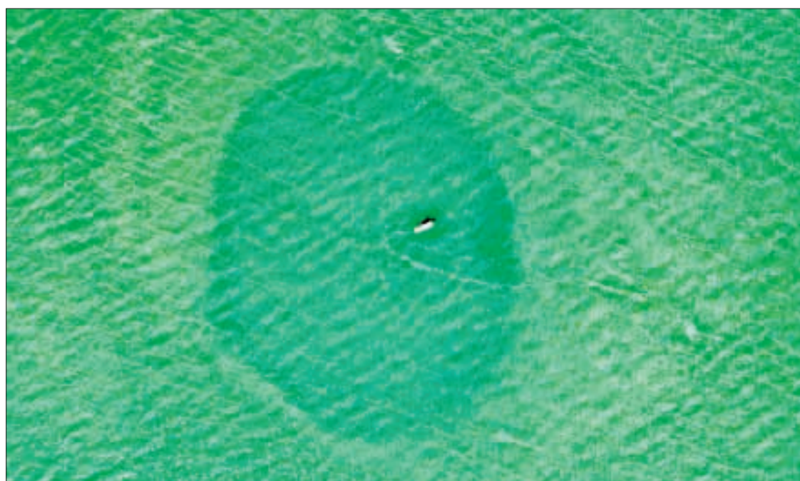
▲ El Taam ja', nombre en maya, es el único en el mundo en un sistema estuarino.

Los cinco libros de la serie Sopa de Ciencias están disponibles en la tienda en línea de El Naranjo y en Amazon.