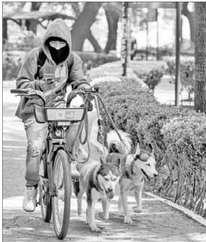
▲ Vida cotidiana en el Parque México, en la alcaldía Cuauhtémoc.