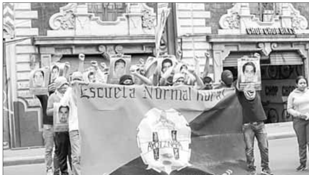
▲ Familiares y solidarios con la causa de exigencia de justicia por la desaparición de los