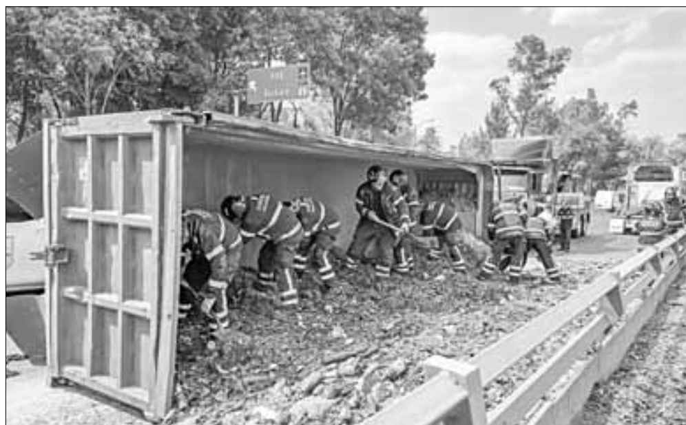
▲ El contenedor de un tráiler que transportaba desechos de vidrio se desprendió y volcó, regando la carga en los carriles centrales del Circuito Interior, a la

altura del Monumento a la Raza. No obstante lo aparatoso del accidente, no se reportaron heridos. Bomberos retiraron el material y liberaron la vialidad.