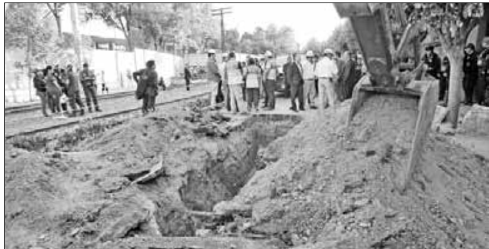
▲ En tres sexenios los que debían proteger los recursos nacionales no lo hicieron, hasta