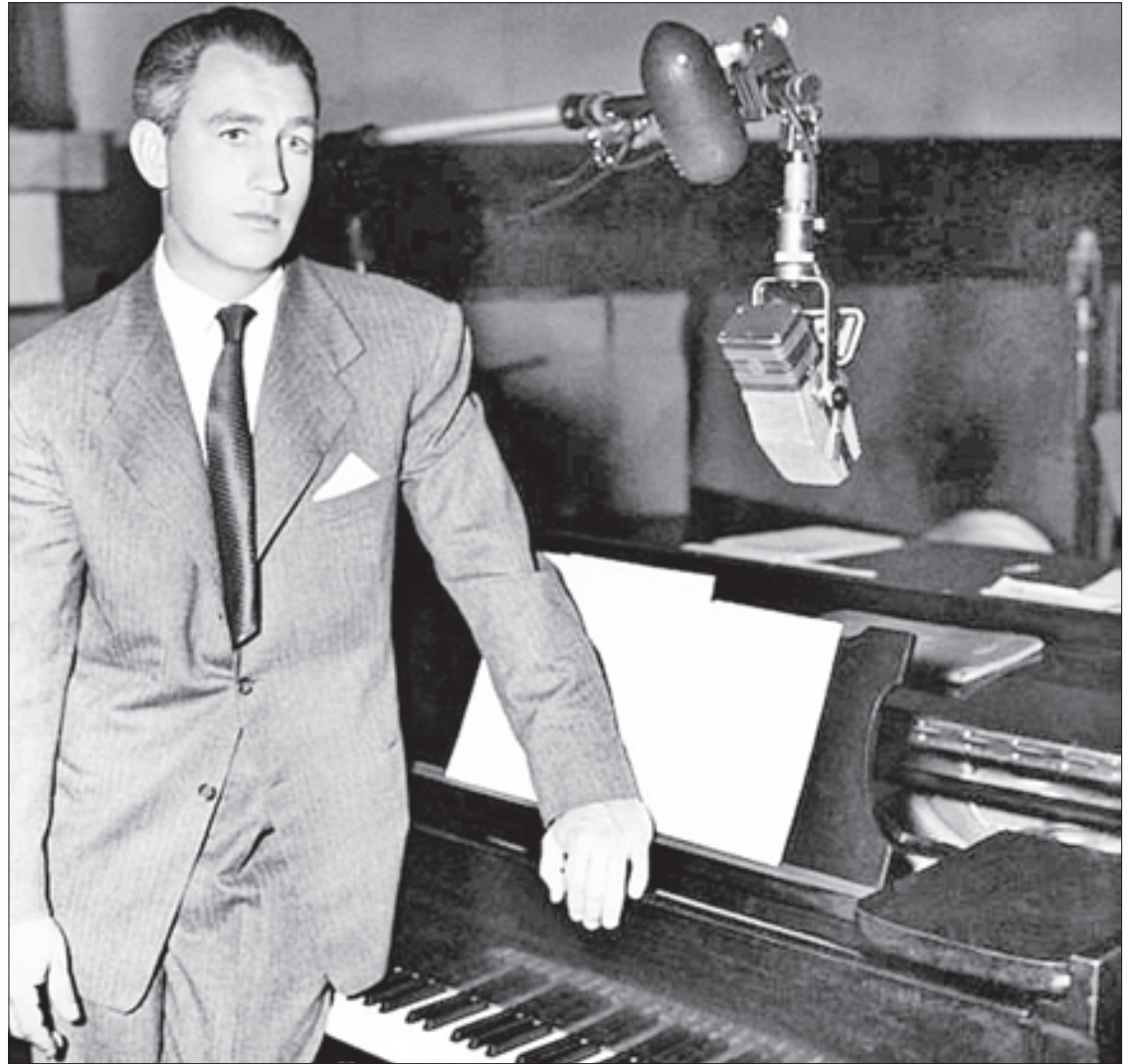
►► Francisco Gabilondo Soler, en la XEW.

Fue en 1934, cuando presentó una serie de temas para niños en la XEW e interpretó sus primeras canciones de fantasía: El chorrillo , Bombón I y El ropero . “Fue un pequeño espacio de 15 minutos sin patrocinador; publicidad, con poca paga y a prueba. Sólo cantaba acompañado del piano y mucha imaginación. Así, continuó, sin aparente éxito, con su programa sin nombre ni personaje. Aunque algunos creían que su