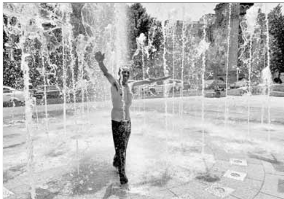
▲ Un hombre apacigua el calor o cumple con la consabida higiene personal en las fuentes