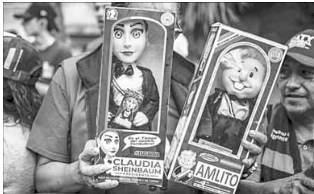
▲ Un simpatizante muestra muñecos de Claudia Sheinbaum y el presidente Andrés