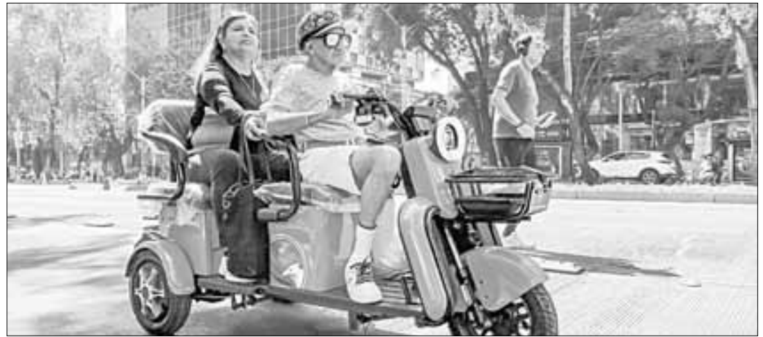
▲ Pareja de la tercera edad disfruta Paseo de la Reforma. Roberto García Ortiz