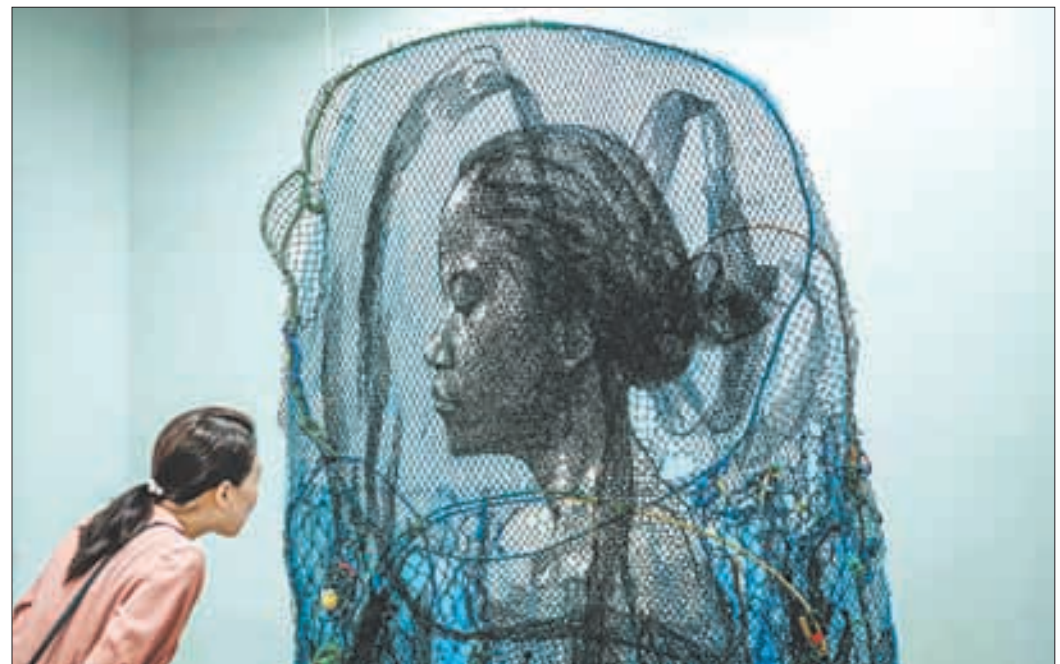
▲ El artista indonesio Iwan Yusuf inauguró ayer en una feria de arte realizada en los jardines de