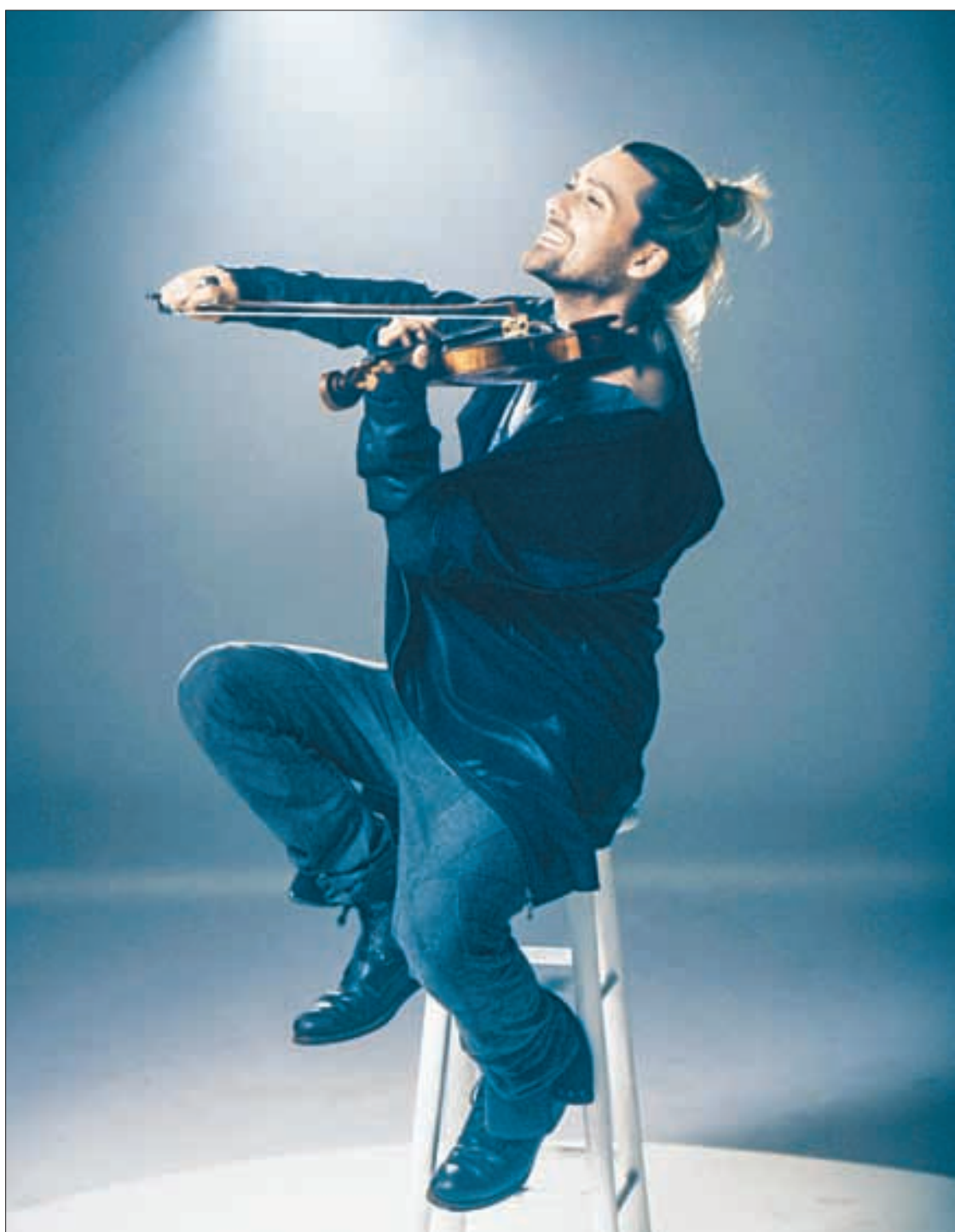
▲ Al también actor y modelo le interesa llegar al corazón del público.

Garrett contó que al hacer una nueva placa “siempre imagino cómo presentarla en vivo, cómo sonará. Soy muy meticuloso para elegir el repertorio de las presentaciones en vivo, el orden, qué piezas funcionan, su dinámica, los tiempos y las armonías; considero que sea una pieza que llegue al corazón del público. Otra exigencia es mi estado físico y emocional en cada una de las presentaciones, ambos son de suma importancia para el violinista porque debes demostrar lo que puedes hacer con el instrumento y así conectar los diferentes puntos: tocarlo más calmado o más trepidante”.