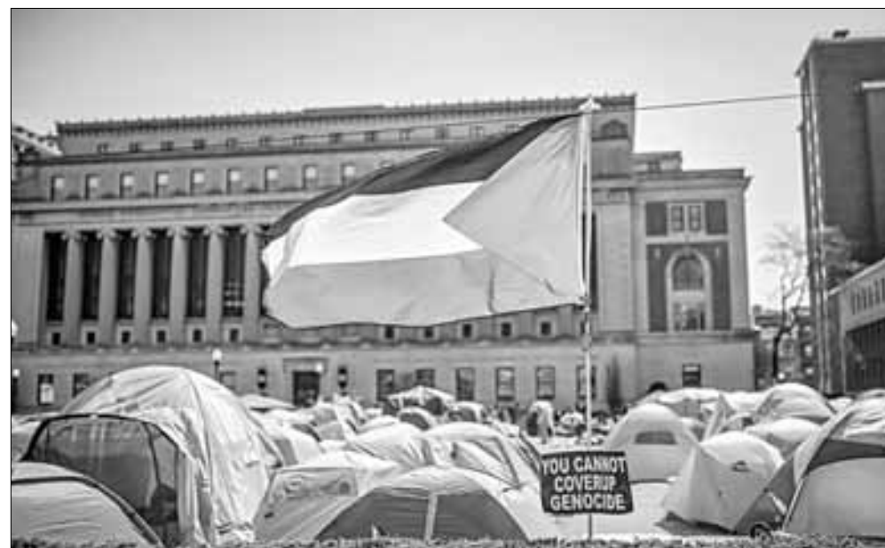
▲ Una bandera palestina ondea en un campamento pro palestino que aboga por el alto el fuego en Gaza y la cancelación de

Buffalo Springfield. For what it's worth. https://open.spotify.com/track/1qRA5BS78u3gME0lM19AA?si=51a6a84b850243e3