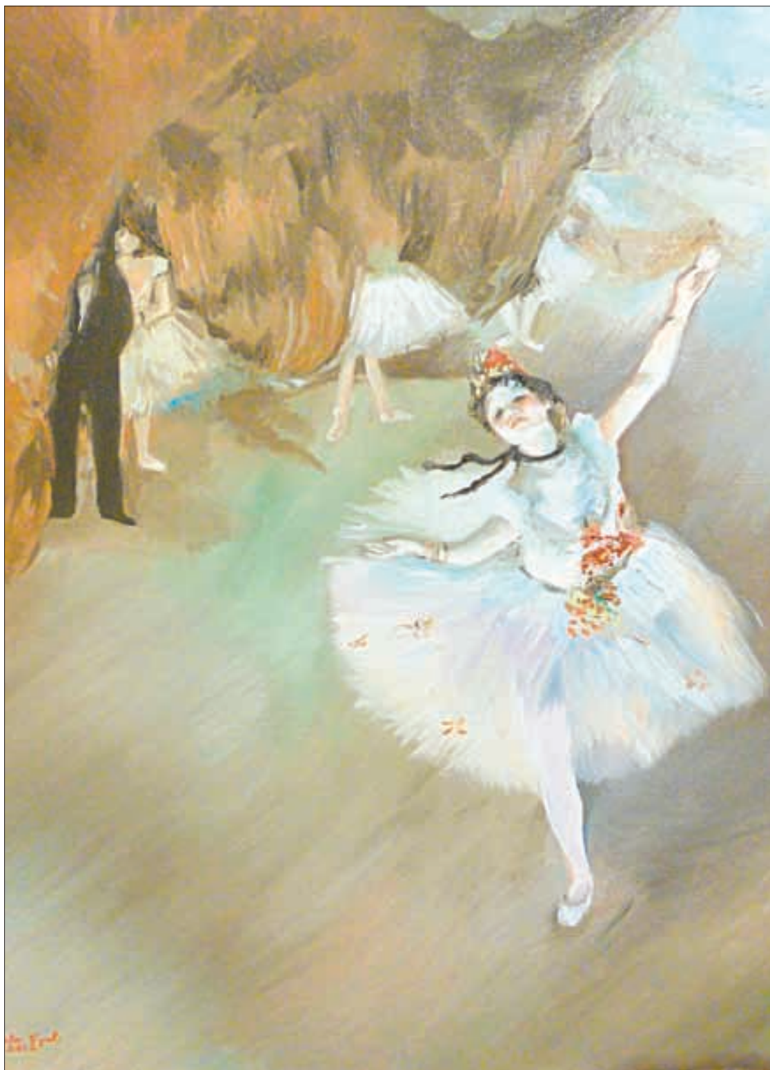
La especialista destacó los nombres de algunos pasos de ballet, como “ demi plié , media flexión, o demi pointe , media punta”, así como el rond de jambe , cuando el bailarín dibuja una