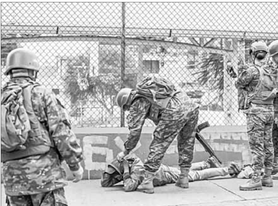
▲ Una patrulla militar somete a un sospechoso en un barrio de Quito, en imagen de hace unos días.

Peligroso, legalizar el mercado negro de armas, advierte académico