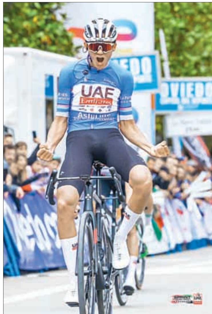
▲ El deportista mexicano de 20 años se adjudicó ayer el primer sitio de la competencia con un tiempo de 12:59.04 horas.