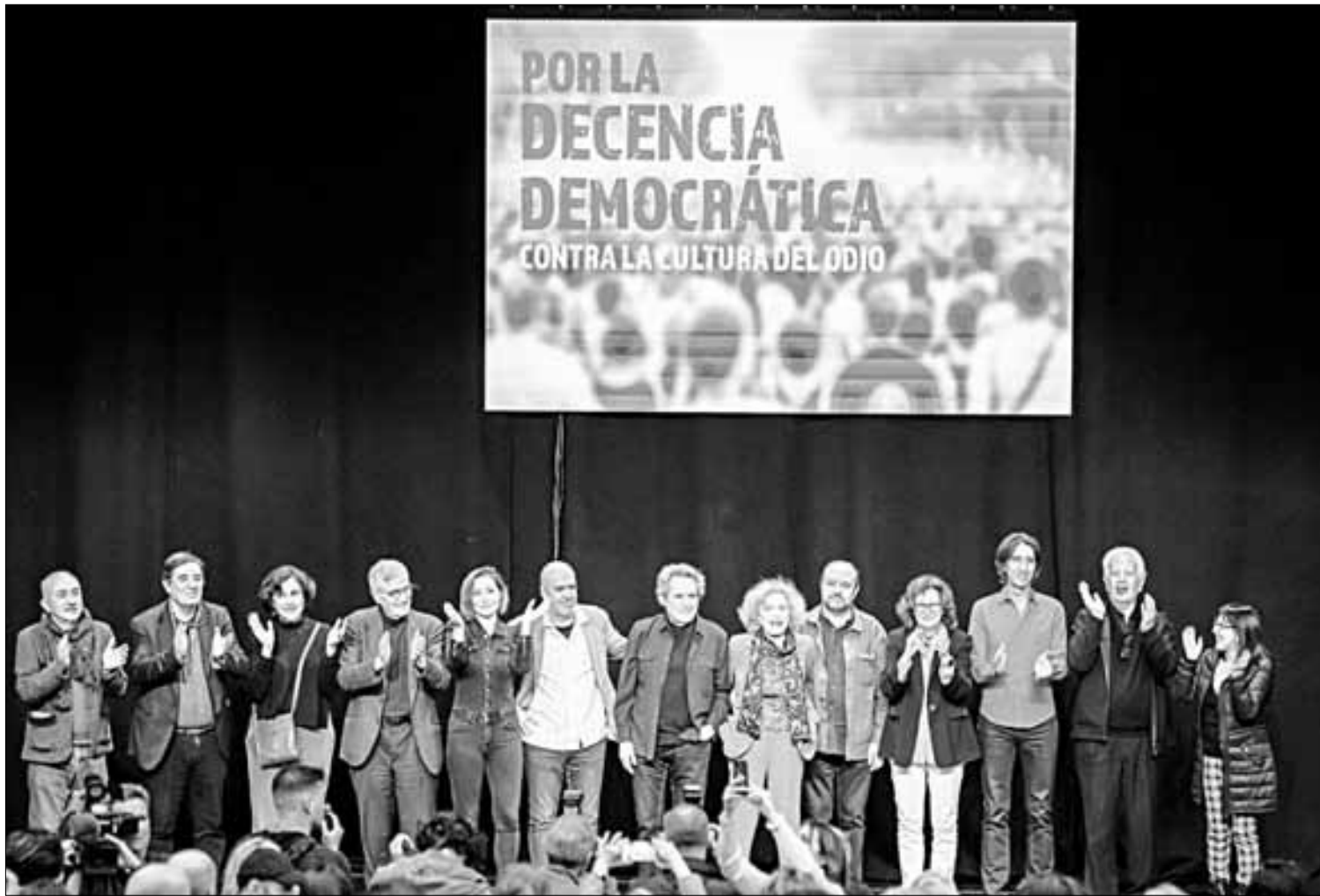
◀ Líderes de los dos principales sindicatos de España, la Unión General de Trabajadores y Comisiones Obreras, acompañados de intelectuales, poetas, escritores, actores y cantantes, ayer en el Auditorio Marcelino Camacho, en el acto Por la Decencia Democrática.

SE UNEN A SINDICATOS EN DEFENSA DE LA DEMOCRACIA