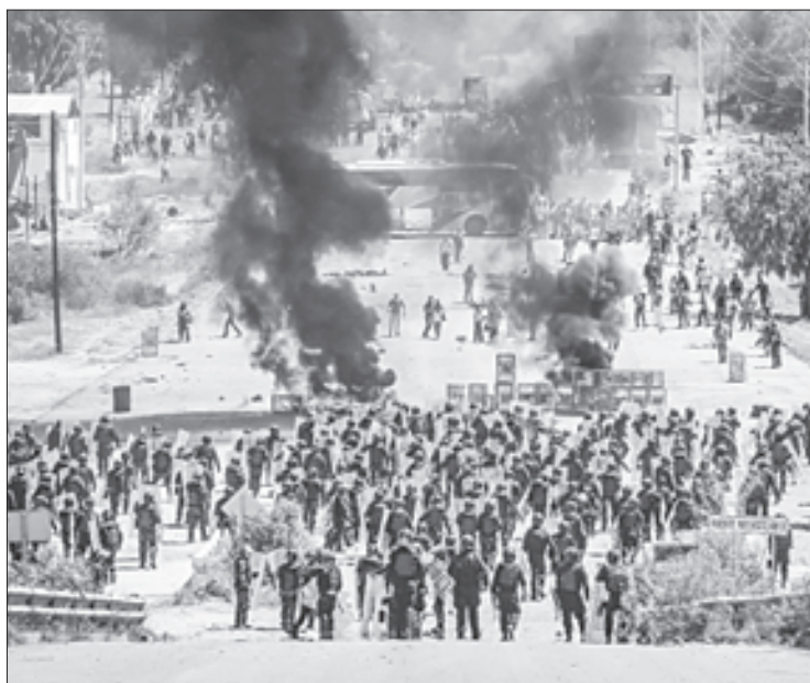
▲ El desalojo del bloqueo magisterial en Nochixtlán, Oaxaca, en 2016 dejó un saldo de ocho muertos y 100 heridos.

El 19 de junio de 2016 se efectuó un operativo en la súper carretera Oaxaca-México en su entronque con la carretera federal 190, donde profesores de la sección 22 mantenían un bloqueo permanente para repudiar la reforma educativa de Enrique Peña Nieto. Durante la acción policial fueron asesinados ocho civiles en Nochixtlán; además, la Comisión Nacional de los Derechos Humanos afirmó que hubo más de 100 heridos.