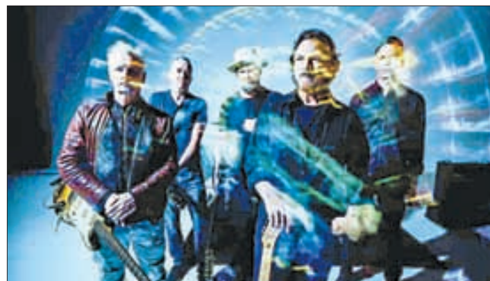
▲ Integrantes de la banda de Seattle, en una imagen tomada de su red social X

Pearl Jam se embarcará en una gira este año. Hasta la fecha ha confirmado a nueve países y 25 ciudades, de Norteamérica, Europa, Nueva Zelanda y Australia. Latinoamérica aún no.