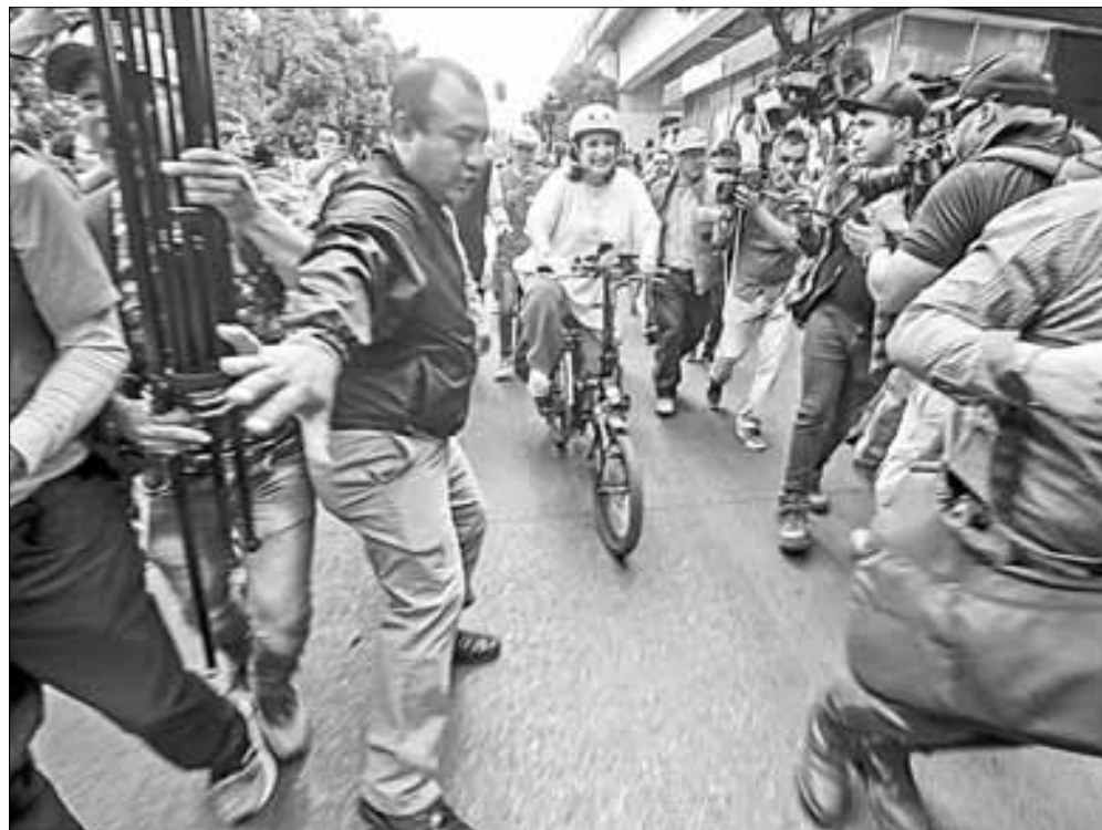
▲ La candidata de PAN, PRI y PRD estuvo repartiendo propaganda electoral a