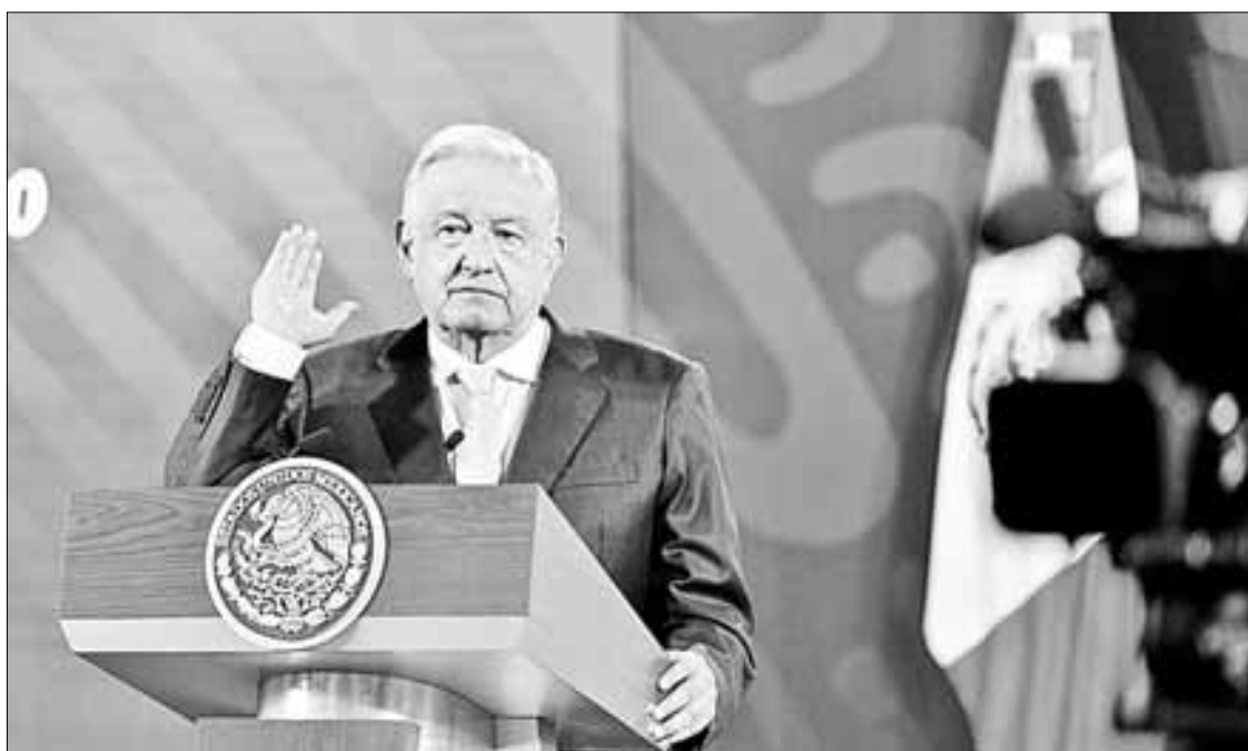
▲ El presidente Andrés Manuel López Obrador aseguró ayer en su conferencia matutina que la reforma a la Ley de Amnistía es “un asunto de

“Nosotros somos respetuosos con ellos y ellos deberían ser recíprocos. No les decimos: ¿Y por qué tienes a un candidato hostigándolo en los juzgados? ¿Y por qué destinan miles de millones de dólares para la guerra? ¿Y por qué no liberas a Assange? ¿Y por qué no atiendes a los jóvenes de Estados Unidos que fallecen por consumir drogas”, acusó el mandatario.