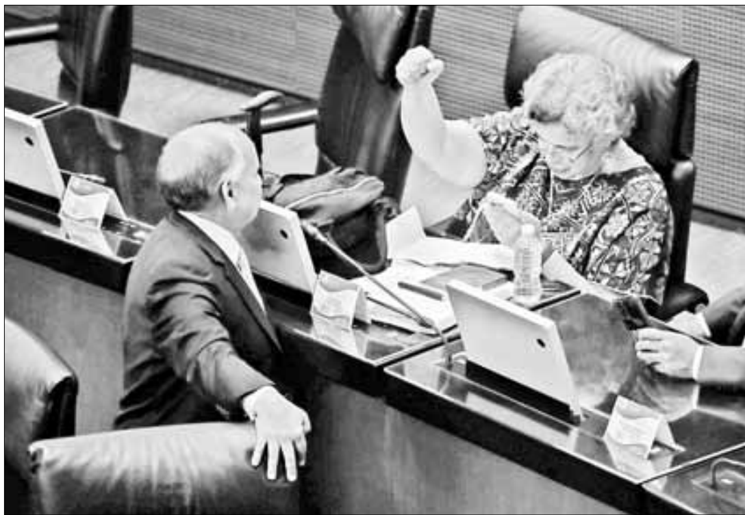
▲ “Falacia de PRI y PAN”, que el gobierno busque quedarse con los fondos de retiro de las cuentas inactivas en las Afore, aseguran senadores de

Comisiones del Senado discuten hoy el dictamen