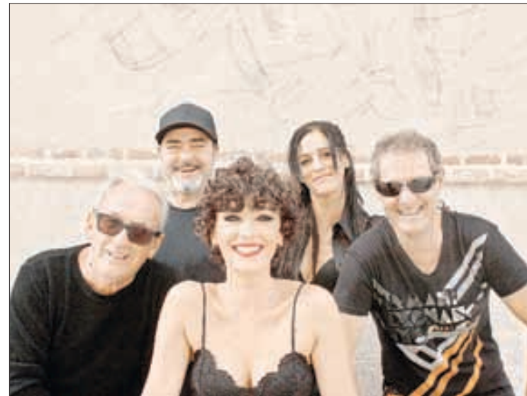
▲ El grupo ofrecerá un concierto original para amantes del repertorio de Joaquín Sabina con interacción directa con el público.

Al final de concierto de Benditos Malditos eligen a un nuevo protagonista para cerrar la presentación: cuatro temas icónicos que ponen al público de pie, todos estos elementos junto con un puñado de anécdotas de los músicos, hacen una experiencia única para cualquier fanático de Joaquín Sabina.