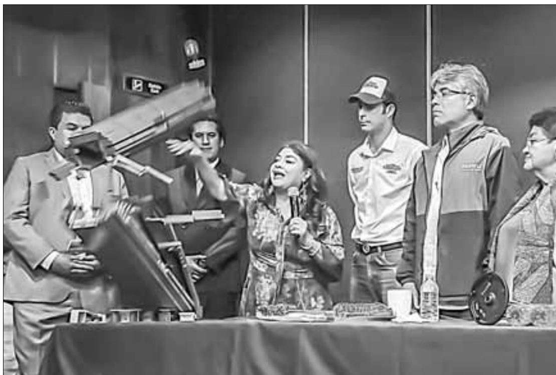
◀ La candidata Clara Brugada aseguró que va a derrotar al cártel inmobiliario, al tiempo que derrumbó una torre hecha con legos, con la que representó los pisos irregulares permitidos en la alcaldía Benito Juárez.

Los morenistas ofrecieron una conferencia encabezada por la