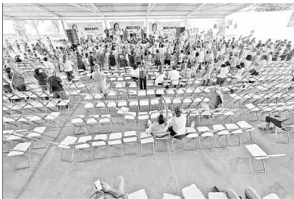
▲ La candidata opositora anunció un cambio de estrategia para el debate del próximo domingo.

EVIDENTEMENTE, LE DUELE a Taboada y su grupo la difusión de tal mafiosidad inmobiliaria, por lo cual Morena y aliados desplegarán una intensa campaña de difusión de dichas formas de delincuencia política blanquiazul . ¡Hasta mañana!