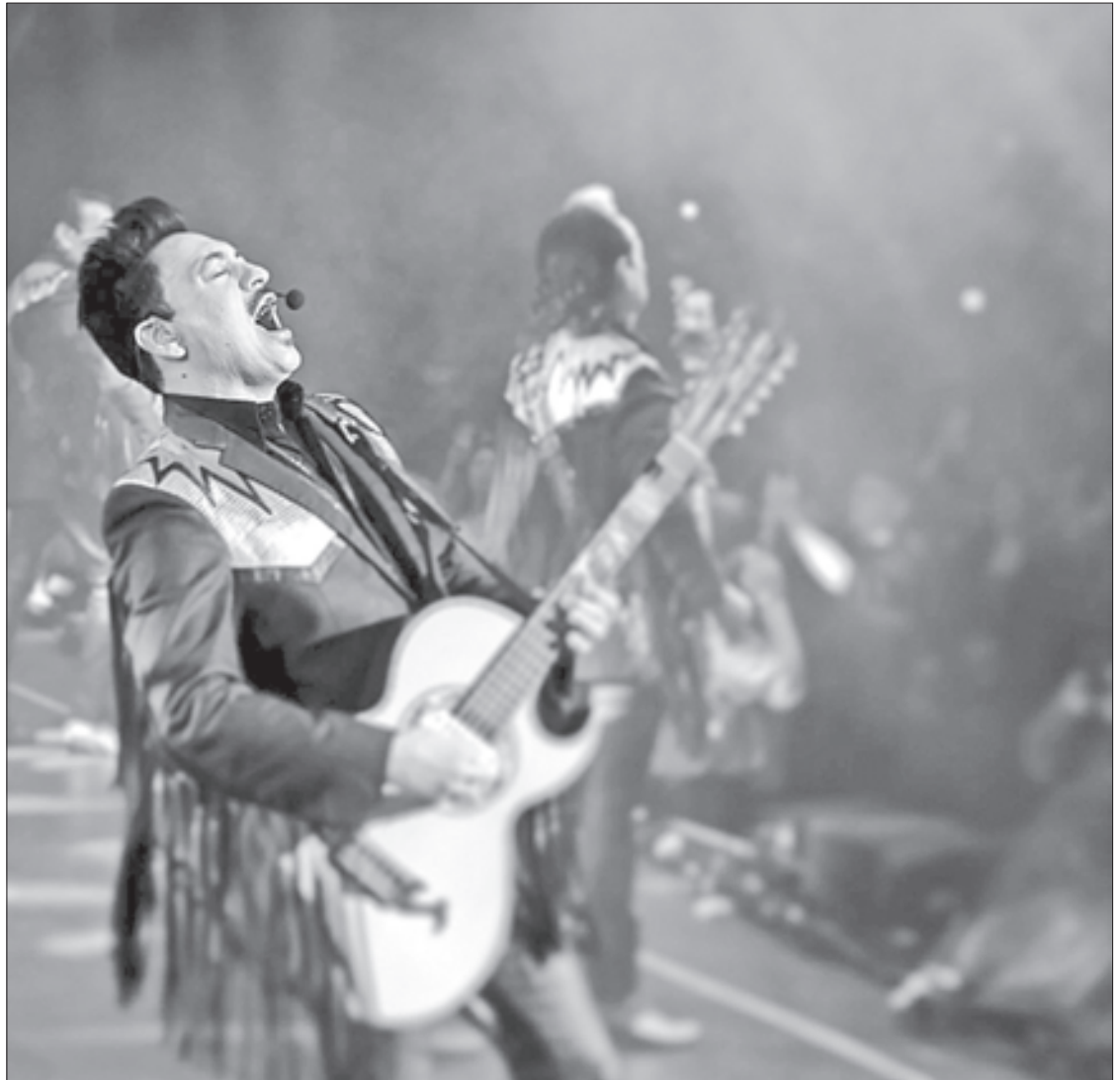
▲► Imágenes de los conciertos en vivo de Los Tigres en Denver, Colorado, y en Austin, Texas.

“Hello, I am Johnny Cash”. La introducción corresponde a uno de los discos en vivo más reconocidos, Live at Folsom Prison (1968). Esas palabras iniciales del músico no tienen una inflexión emotiva ni un discurso específico, pero son legendarias, tal vez por la manera parca en que el hombre de negro se presentó a sí mismo, contrastada por el rugido de la población carcelaria convertida en audiencia. Esa forma de contar es la misma que la de Los Tigres, por lo que no sorprende