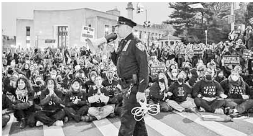
▲ Manifestantes judíos propalestinos bloquean los alrededores de la casa del demócrata Chuck Schumer, líder de la mayoría en el Senado estadounidense, ayer, en Brooklyn, Nueva York, para exigir que cese el envío de armas a Israel.

http://alfredojalife.com https://www.facebook.com/AlfredoJalife https://vk.com/alfredojalifeoficial https://t.me/AJalife https://www.youtube.com/channel/UC1fxFOThZD-PL_c0Ld7psDsw?view_as=subscriber https://vm.tiktok.com/ZM8KnkKQn/ https://twitter.com/AlfredoJalife Instagram: @alfredojalifer