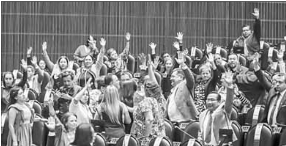
▲ Diputados de Morena, durante la votación del dictamen sobre el Fondo de Pensiones

para el Bienestar, ayer en el recinto de San Lázaro.