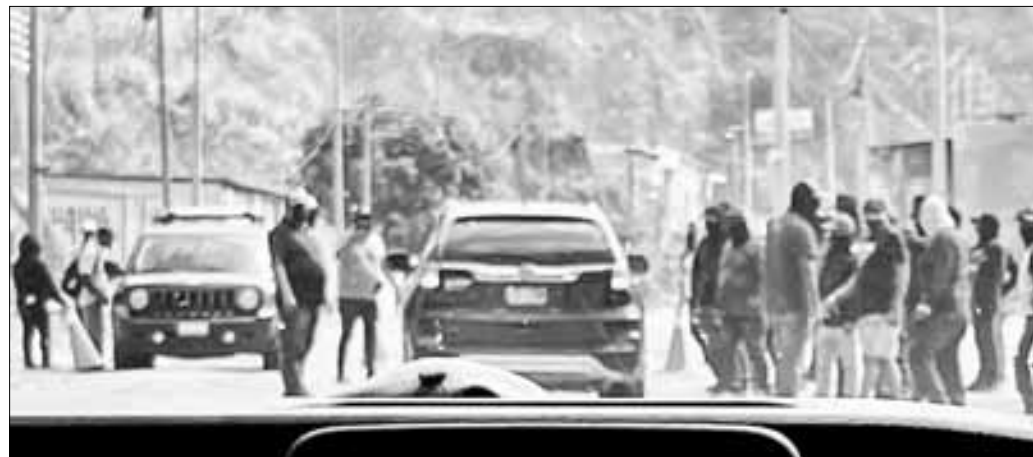
▲ Un grupo de encapuchados rodeó el domingo el vehículo de la candidata de la coalición Sigamos Haciendo Historia a la

X: @cafevega Correo: cfvmexico_sa@hotmail.com