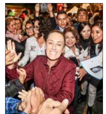
▲ La candidata morenista hizo ayer campaña en Tlalpan, alcaldía de “sus querencias”.

REDACCIÓN, NÉSTOR JIMÉNEZ Y ARTURO CANO / P 5