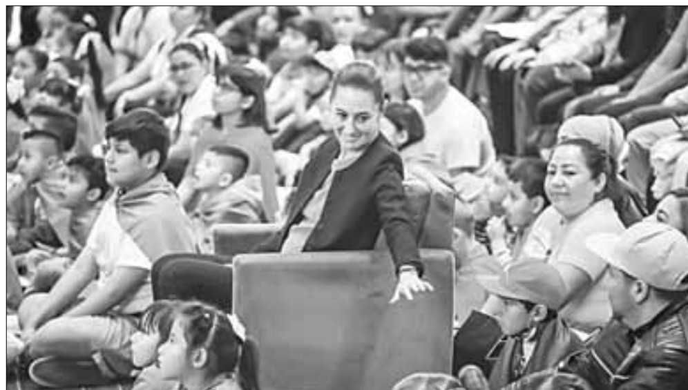
▲ Claudia Sheinbaum firmó ayer el pacto por la primera infancia, que consta de 12 metas y

es impulsado por 500 organizaciones sociales.