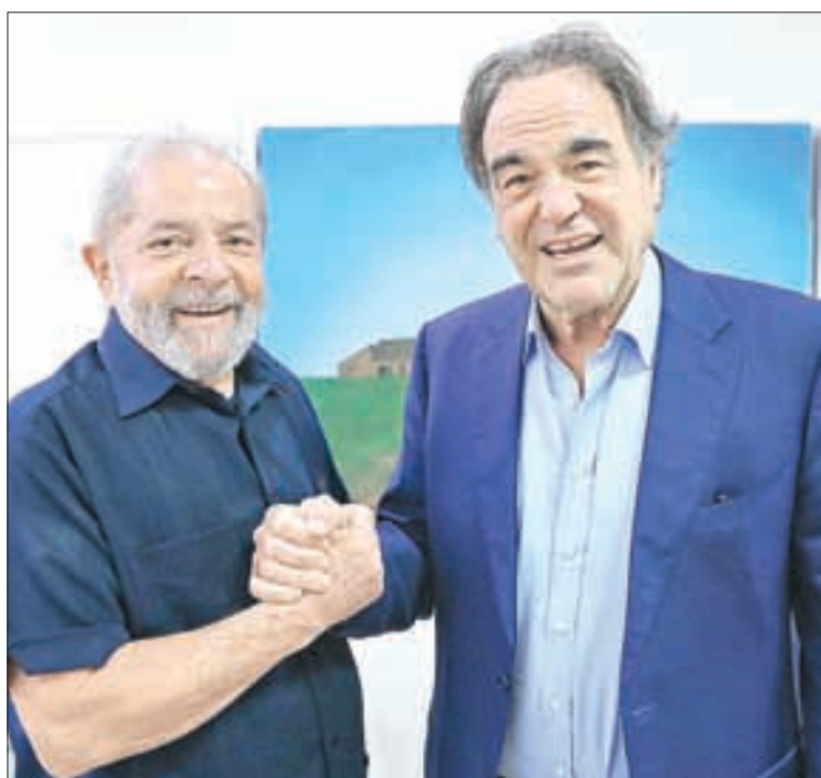
▲ El presidente de Brasil y el realizador estadounidense.

La biblioteca nacional inauguró el Registro en 2000 con el propósito de preservar grabaciones con significado cultural e histórico para Estados Unidos, y cada año selecciona 25 grabaciones para incluir en este archivo.