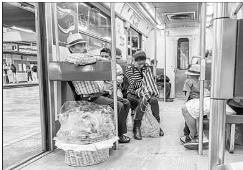
▲ El Sistema de Transporte Colectivo es por momentos el sitio de encuentro de miles de