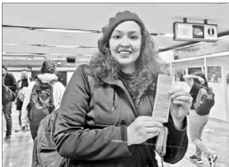
▲ Ahora hay quien busca hacer negocio y ofrecen en redes los de colores que se usaron por 55 años.