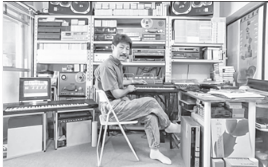
▲ Hiroshi Yoshimura en su estudio a finales de 1980.

Y HETE AHÍ que para muchos Hiroshi Yoshimura es “un compositor de música ambient”, llevando al extremo el término japonés “ambiente”. Y mejor resolvamos: “no problema”, porque lo