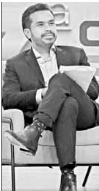
▲ El abanderado de MC, durante su participación en la Convención Bancaria.

El abanderado de MC señaló que la seguridad y la impartición de justicia son las principales preocupaciones del país. “Hay estados completos con territorios gobernados por el crimen organizado”, afirmó, lo que atribuyó a la política de seguridad fallida iniciada por el