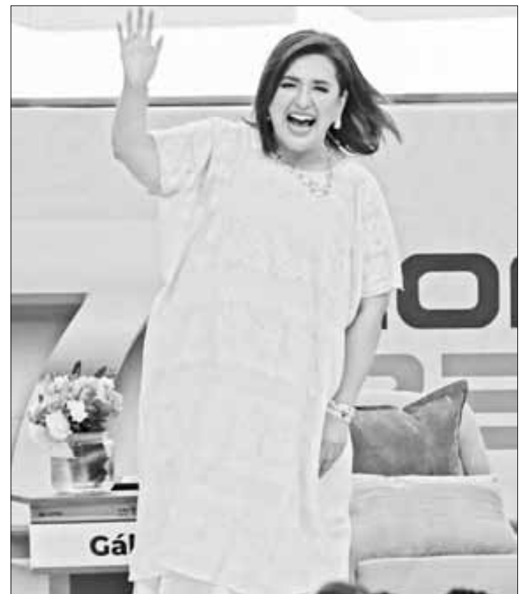
▲ La candidata de PAN, PRI y PRD abrió ayer la pasarela de presidenciables en la 87 Convención Bancaria de Acapulco, donde recibió varios aplausos.

Momentos después, los llamó a “reflexionar”. Argumentó que “hace seis años les aseguraron que no cancelarían el Aeropuerto de Texcoco, y muchos se la creyeron. Hoy les di-