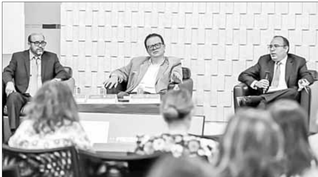
▲ El magistrado Felipe de la Mata (centro) en la presentación del libro Justicia constitucional electoral .

La próxima reforma electoral, abundó, deberá tener una visión democrática, donde no se trate sólo