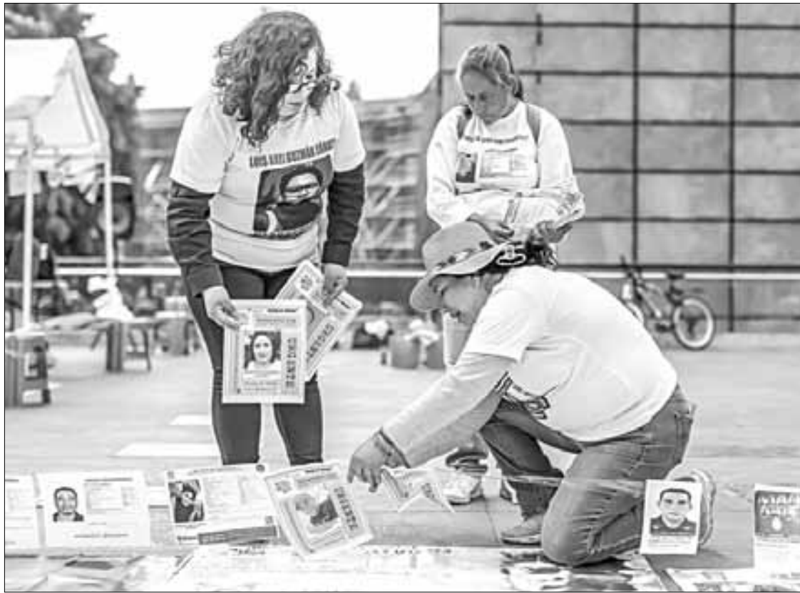
HALLAN RESTOS EN HERMOSILLO Y HUATABAMPO