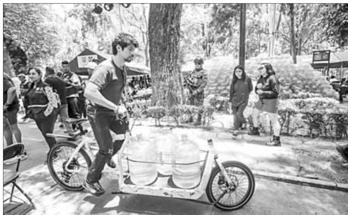
▲ Residentes de la alcaldía Benito Juárez afectados por el desabasto del líquido se las