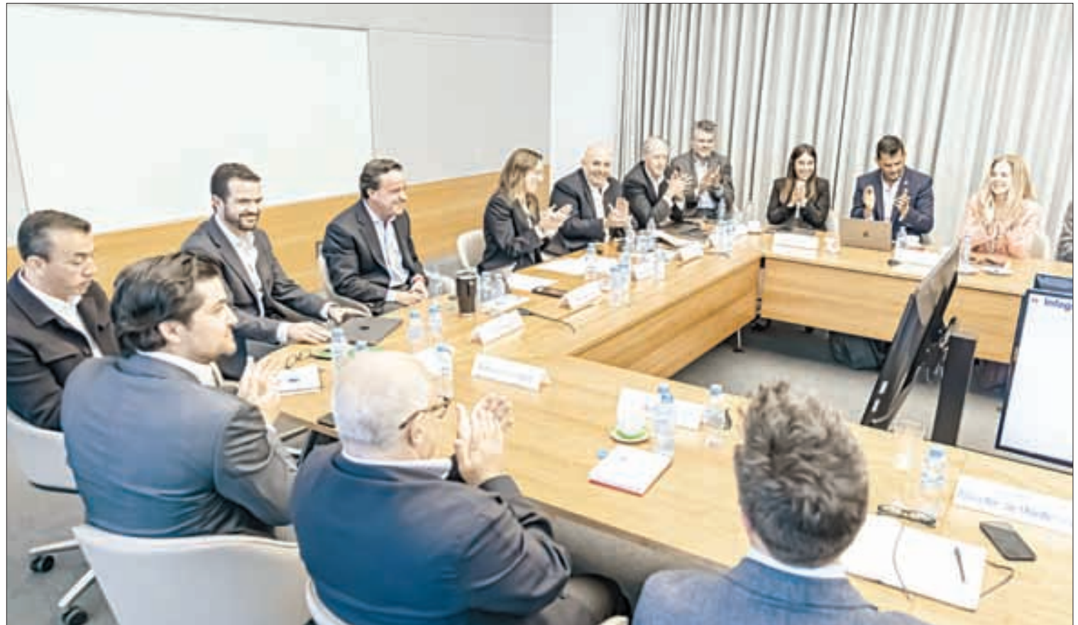
▲ Aspecto de la histórica reunión de dueños y directivos.

ciales, con total independencia del varonil”, señaló.