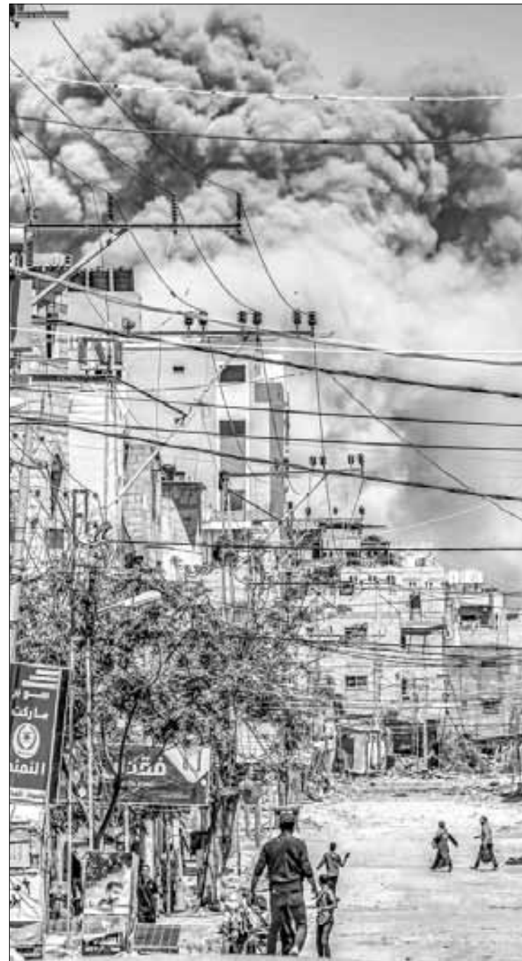
▲ Por séptimo día consecutivo, el campamento de refugiados de Nuseirat, ubicado en el centro de la ciudad de Gaza, estuvo bajo fuego israelí, en medio de reportes sobre una inminente ofensiva en el sitio. Los bombardeos contra el enclave palestino no se detienen, en medio de la creciente tensión entre Tel Aviv y Teherán. Las explosiones de la ofensiva en Nuseirat se alcanzan a ver en la imagen.

En este contexto, los líderes de los 27 países de la Unión Europea pidieron “contención” a las partes, al tiempo que anunciaron sanciones a la industria de drones y misiles iraníes, anunció el jefe del Consejo Europeo, Charles Michel. “Tenemos que aislar a Irán”, comentó en breve contacto con la prensa al final de la jornada inaugural de la Cumbre Europea de Defensa y Seguridad, en Bruselas.