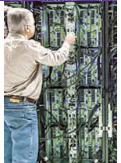
Guardianes de la memoria digital

22:00 TIEMPO DE FILMOTECA UNAM: 135 AÑOS DEL NATALICIO DE CHAPLIN Monsieur Verdoux (Estados Unidos, 1947)