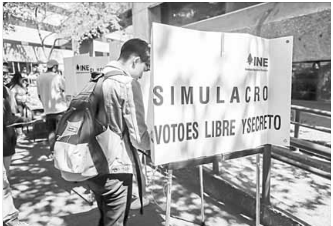
▲ Académicos, estudiantes y administrativos de la Universidad Pedagógica Nacional (UPN) plantel