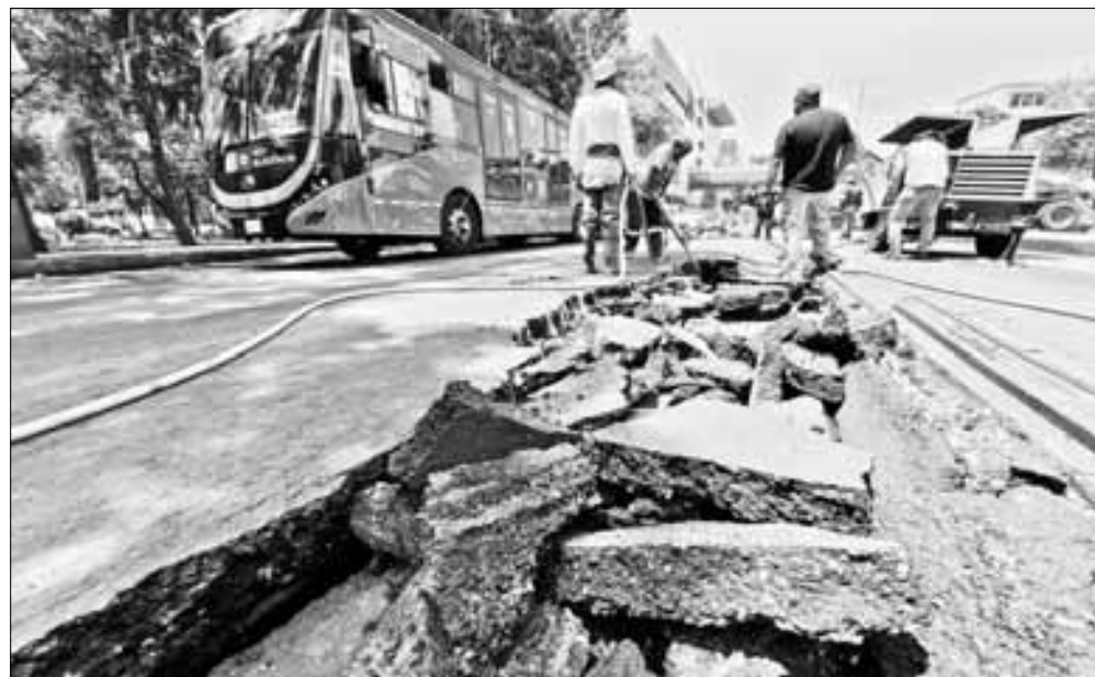
▲ Una fuga de agua potable dañó el carril confinado del Metrobús en avenida