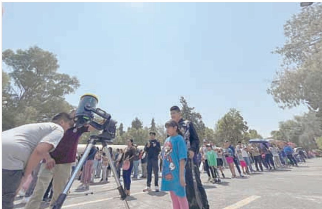
▲ Capitalinos se dieron cita en el planetario del IPN, en Zacatenco.

Algunos padres de familia llevaron sus hijos para acudir al planetario Joaquín Gallo, ubicado en Parque de los Venados, para disfrutar del hecho histórico, a quienes incluso disfrazaron de superhéroes. Con compañeros de trabajo, amigos o conocidos, hubo quienes decidieron apreciar el eclipse desde la azotea de sus casas u oficinas, que con lentes adquiridos en redes sociales, en tiendas, ferreterías o con los ambulantes disfrutaron del momento. Con información de Laura Gómez, Sandra Hernández y Nayelli Ramírez