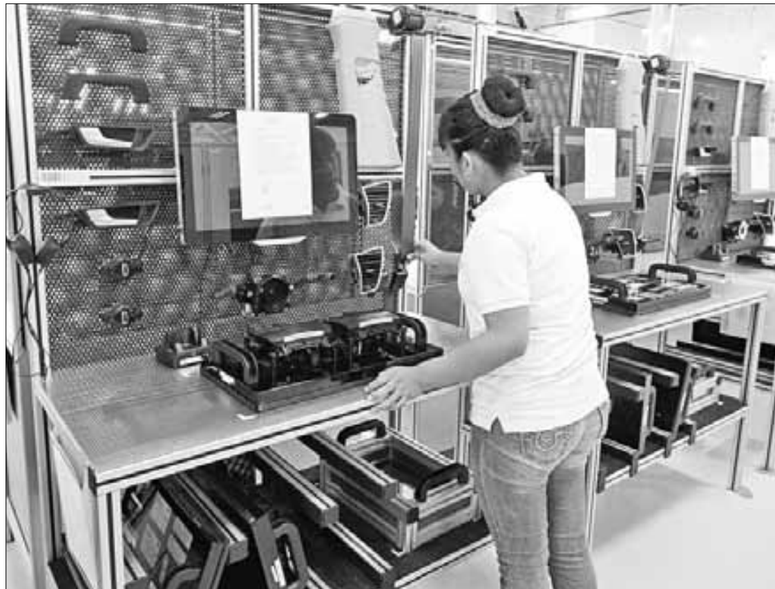
▲ Aspecto de la planta de uno de los proveedores de Volkswagen en Puebla. A lo largo de más de cinco décadas, la armadora alemana ha desarrollado una red de suministro que se ha convertido en un clúster industrial.

“Una de las cosas importantes que tiene la relocalización de cadenas productivas ( nearshoring ) es que hay oportunidades para todos los estados; evidentemente, se empieza por entidades que tradicionalmente ya tienen operaciones de manufactura, pero ya se comienza