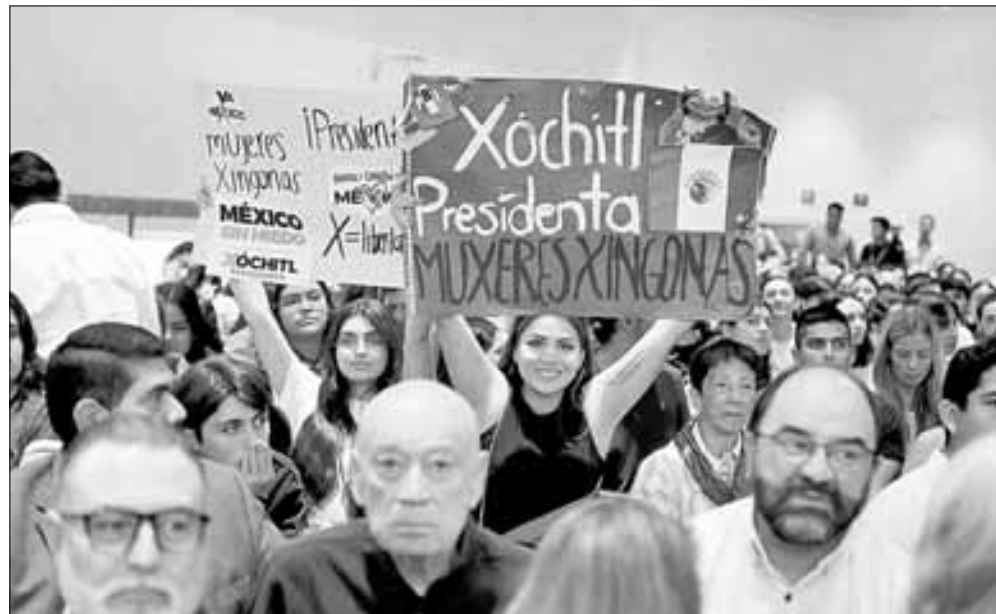
▲ La aspirante presidencial acudió a esa casa de estudios, donde recibió críticas porque su

y, en todo caso, su objetivo sería acercarse a quien va en segundo lugar y sustraerle algo de votos. Pero la proporción de sus críticas, que fue mayor hacia Xóchitl, hizo sentir lo que en las filas del pripanismo se asegura: que Máynez, como él mismo dice que usualmente es llamado, y el Movimiento Ciudadano, gerenciado por Dante Delgado, están jugando un papel de esquirolaje al servicio de Morena y Sheinbaum.