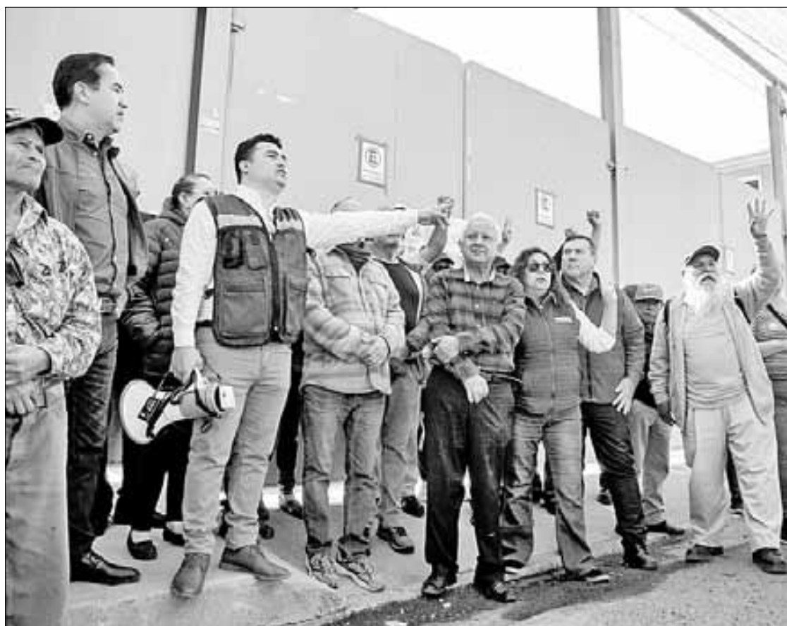
▲ Militantes de Morena durante la manifestación que realizaron ayer fuera de las oficinas de ese partido en Tijuana, Baja California, en protesta por