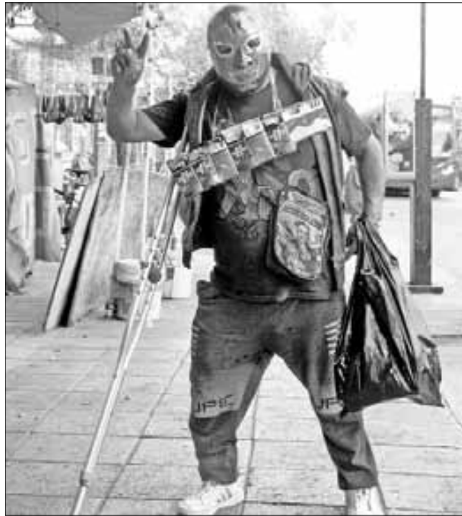
▲ Tras lesionarse en el cuadrilátero, un luchador vende cigarrillos en las calles de la CDMX.