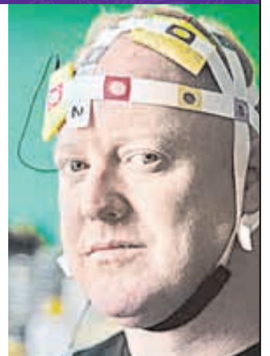
Drogas inteligentes: el viaje de un futurista al biohacking

22:00 TIEMPO DE FILMOTECA UNAM: ESTRÉS POSTRAUMÁTICO La guerra de Murphy De Peter Yates (Reino Unido, 1971)