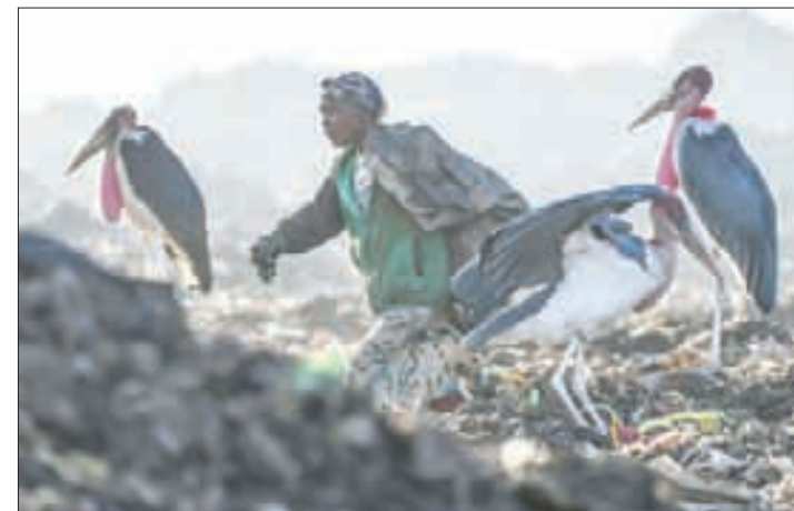
▲ Una mujer busca materiales reciclables para ganarse la vida en Dandora, Nairobi.

Concluyó que un mayor reciclaje y reutilización de esos materiales “son algunas de las cosas que debemos considerar”.