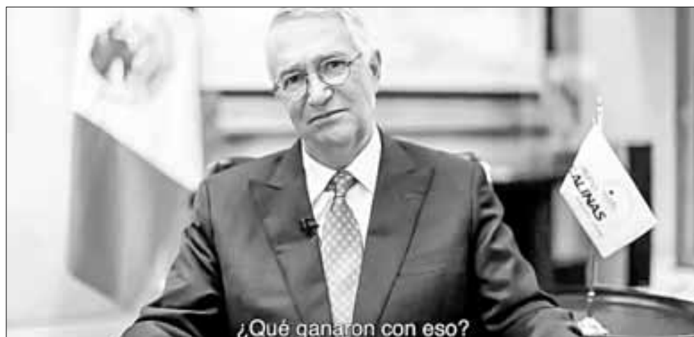
▲ Captura de pantalla del video divulgado la noche del martes pasado por Ricardo Salinas Pliego

Twitter: @cafevega cfvmexico_sa@hotmail.com