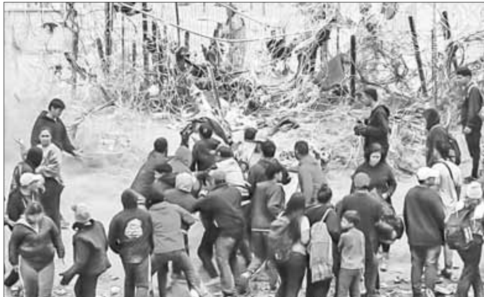
▲ Unos 80 migrantes derribaron la alambrada de púas y la malla ciclónica a la altura de la