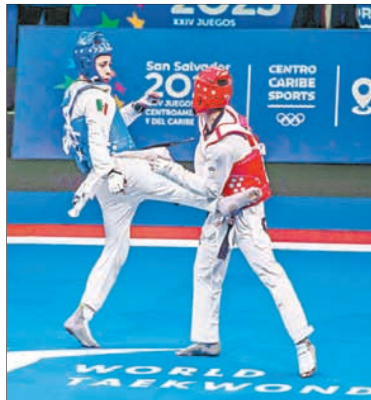
▲ El taekwondoíne tricolor (izquierda) desea estar en los Olímpicos de 2024, luego de que no clasificó a Tokio 2020.