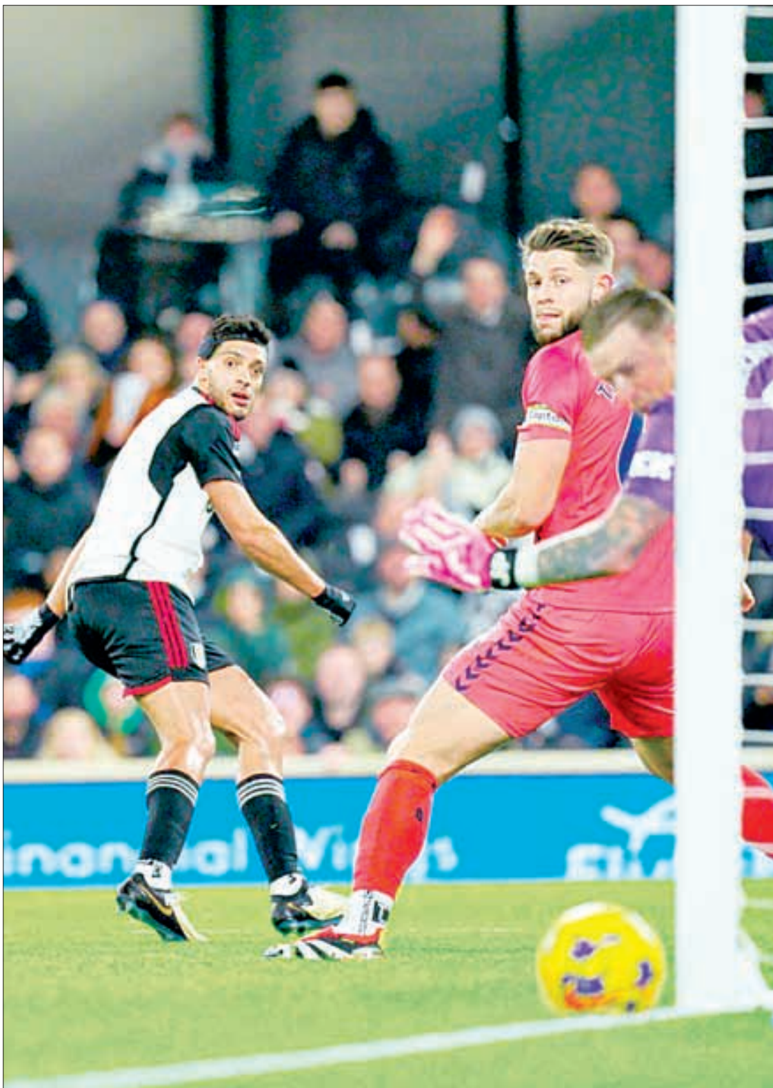
▲ El delantero mexicano (izquierda) encontró su segundo aire en el torneo inglés con el Fulham y poco a poco recobra el nivel que lo llevó a convertirse en el máximo anotador del Wolverhampton.