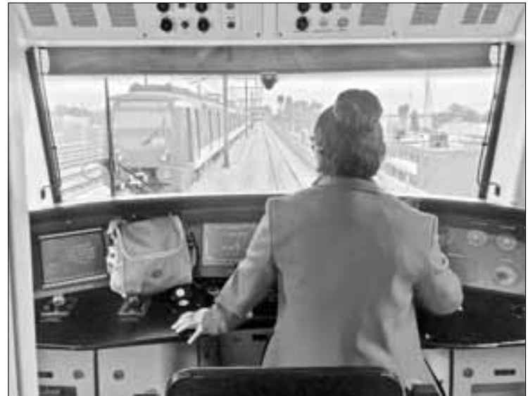
▲▼ Ayer fue reabierto el tramo pendiente de la línea 12 del Metro, de Tezonco a Tláhuac, luego de casi tres años de trabajos de reforzamiento, principalmente en el viaducto elevado.

Se prevé que el tiempo del trayecto sea de 40 minutos, en promedio, de terminal a terminal, con un estimado de tiempo de espera de tres minutos con 15 segundos, para lo cual estarán en operación 27 convoyes, con dos de reserva, señaló por