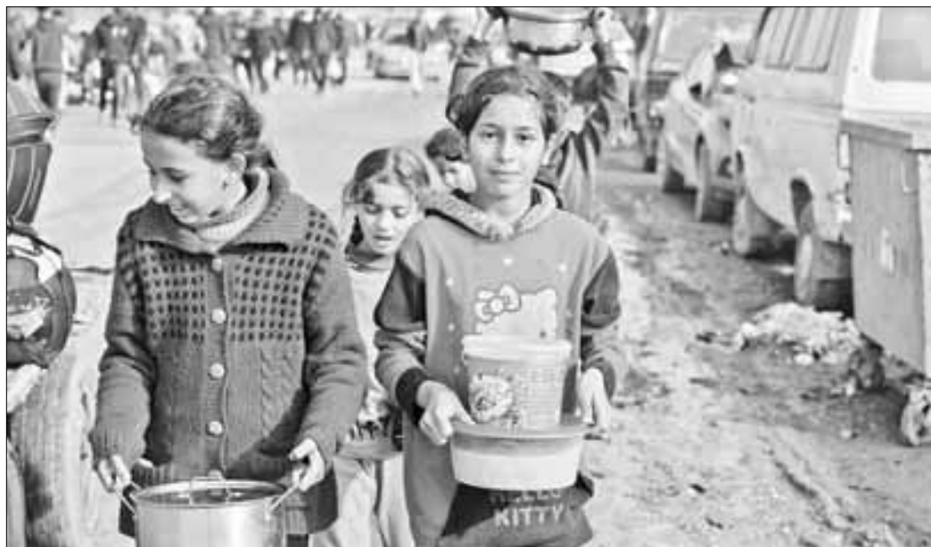
▲ Palestinas desplazadas cargan alimentos en Rafah, cerca de Egipto, la semana pasada.

http://alfredojalife.com https://www.facebook.com/AlfredoJalife https://vk.com/alfredojalifeoficial https://t.me/AJalife https://www.youtube.com/channel/UC1fxfoThZD-PL_c0Ld7psDsw?view_as=subscriber https://vm.tiktok.com/ZM8KnkKQn/ https://twitter.com/AlfredoJalife Instagram: @alfredojalifer