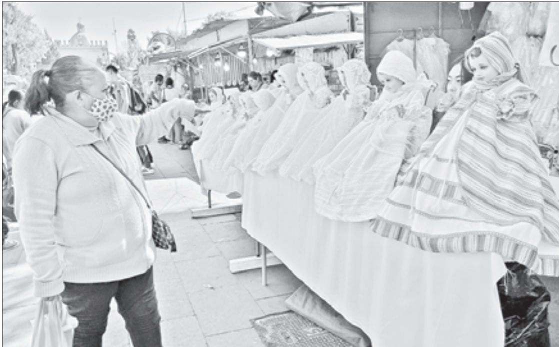
▲ La romería por el Día de la Candelaria que se instala cada año en la alcaldía Xochimilco.