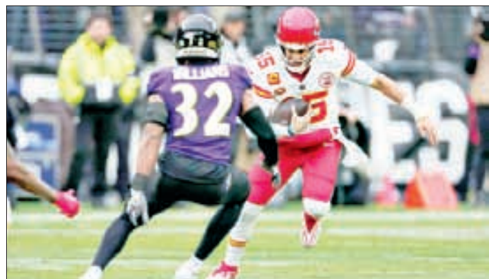
▲ El partido entre los Cuervos de Baltimore y Jefes de Kansas City, en la final de la Conferencia Americana de la NFL, promedió 55 millones 473 mil de espectadores, de acuerdo con datos de la cadena CBS, lo cual lo convierte en el más visto en la historia de dicha instancia. La presencia en el estadio de la cantante Taylor Swift, pareja del ala cerrada de los vigentes campeones, Travis Kelce, generó un aumento de 17 por ciento respecto del año pasado. Foto Ap, con información de la Redacción