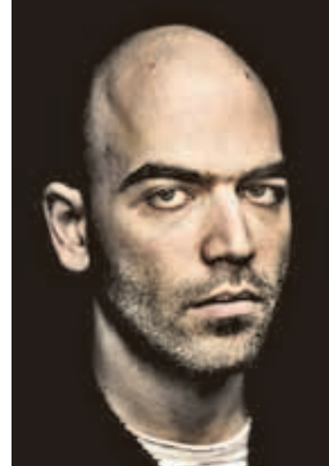
Roberto Saviano. Un escritor amenazado por la Camorra

IZZI - TOTAL PLAY - CANAL 20 | TELEVISIÓN ABIERTA - CANAL 20.1 | DISH - SKY - MEGACABLE - CANAL 120