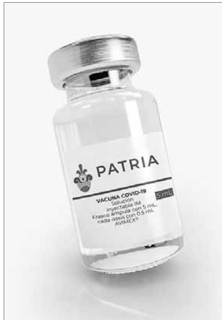
▲ Entre 1.7 y 2.5 millones de dosis fabricará Avimex en los tres primeros meses de producción.

El sistema de salud nacional, expuso, cuenta con "una enorme capacidad" para la atención de covid-19, con 3 mil 899 camas generales, de las cuales sólo están ocupadas 215; en tanto que se tienen 2 mil 85 para enfermos con infección respiratoria grave y están en uso 24.