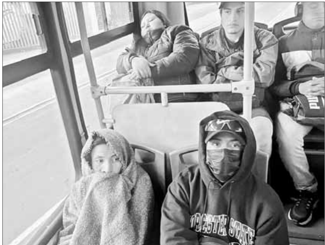
▲ En medio del frío, algunos con sueño y otros con cubrebocas, capitalinos se dirigen muy de mañana a la escuela o sus centros de trabajo para