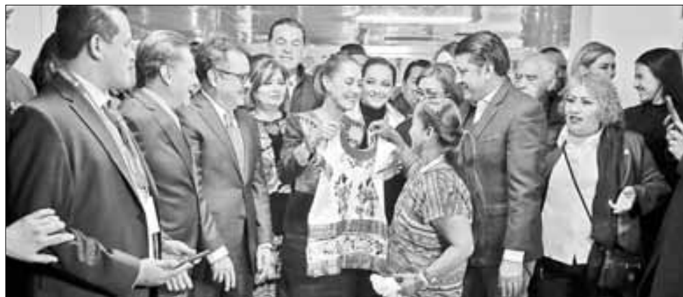
▲ La candidata presidencial participó ayer en la reunión plenaria de la bancada de Morena. A