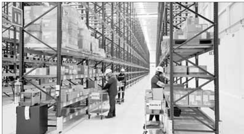
▲ Imagen de archivo de trabajadores surtiendo anaqueles en la Megafarmacia del

Twitter: @cafevega cfvmexico_sa@hotmail.com