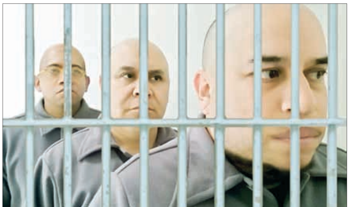
▲ En la primera imagen, Marcos Ana (1920-2016); en la segunda, Miguel Hernández (1910-1942), y en