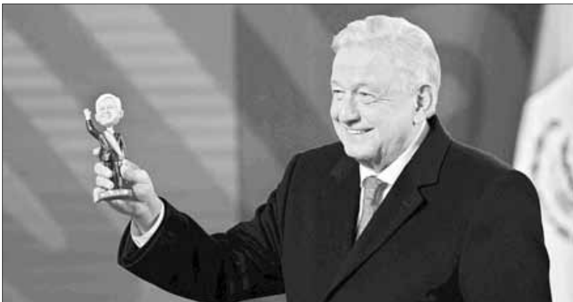
▲ El presidente Andrés Manuel López Obrador presentó en la conferencia matutina un muñeco con su imagen y bromeó al respecto con los reporteros presentes.

Consideró que sus opositores están irritados y molestos por la transformación. “Esto lo digo haciendo un llamado respetuoso a que nuestros adversarios piensen hasta 10 y que, aunque se tenga el corazón caliente, (hay que mantener) la cabeza fría. No somos enemigos, mucho menos enemigos a destruir, si acaso adversarios a vencer, en buena lid, con argumentos, con verdad, con honestidad, sin mentir, sin calumniar”.