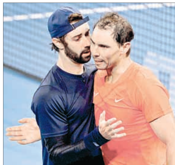
▲ El australiano Jordan Thompson (izquierda) se impuso 5-7, 7-6 y 6-3 a Rafa Nadal, quien requirió asistencia médica en el tercer set.

En semifinales, Alemania se enfrentará a la anfitriona Australia, mientras que por la otra parte del cuadro, Francia y Polonia pelearán por la otra plaza en la final.