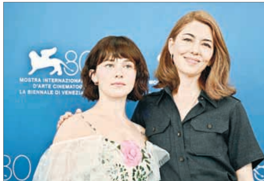
▲ La actriz Cailee Spaeny y la directora Sofia Coppola en la presentación de la cinta Priscilla en el 80 Festival de Venecia.

Desde luego, como no trata la versión mitológica de Presley, sólo lo veremos entonar en privado una canción de Jerry Lee Lewis (quien también se casó con una adolescente que, en este caso, era su sobrina). Y su repertorio está ob-