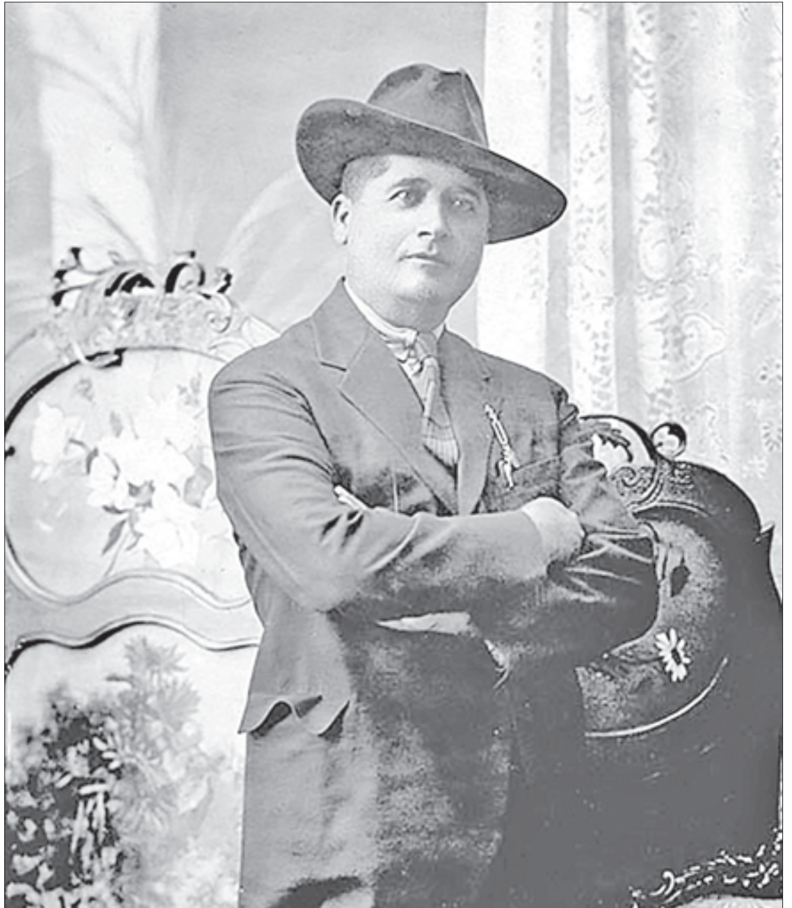
▲ Carrillo Puerto siempre guió sus acciones por “un profundo sentimiento de justicia social”, tanto como periodista y revolucionario como político y gobernador, refirió en entrevista el investigador del Instituto Nacional de Estudios Históricos de las Revoluciones de México.

“Siempre fue consciente de la riqueza del pasado maya y de que valía la pena rescatarlo, pero también consideraba esencial ocuparse del presente de esa cultura, de su desarrollo y su educación.”