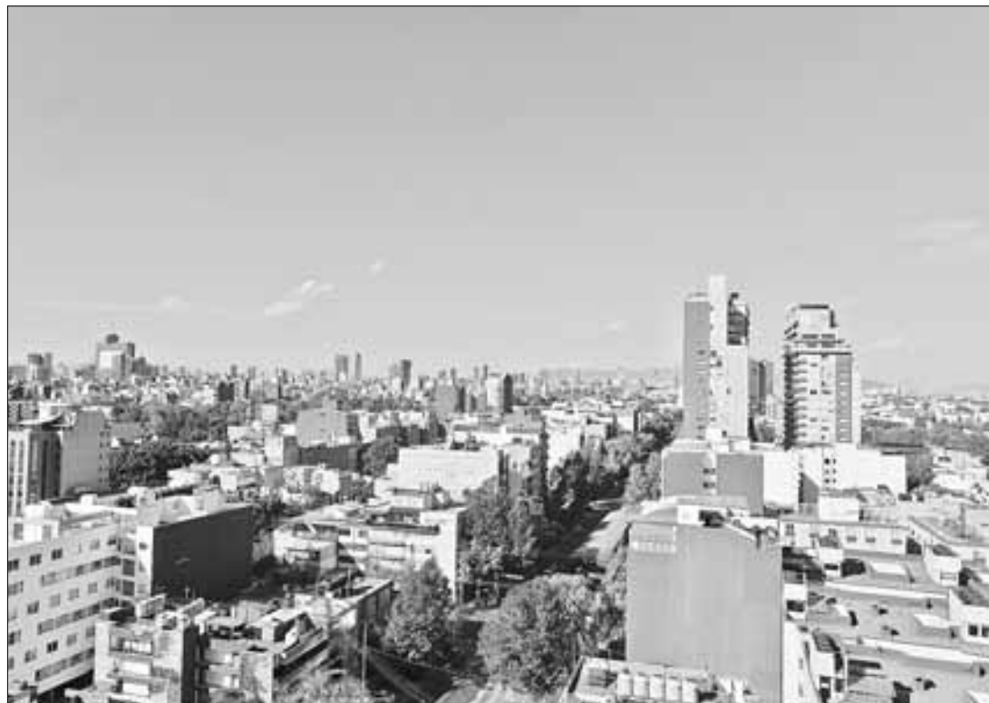
▲ Los vientos de ayer limpiaron un poco la ciudad tras un Año Nuevo contaminado.