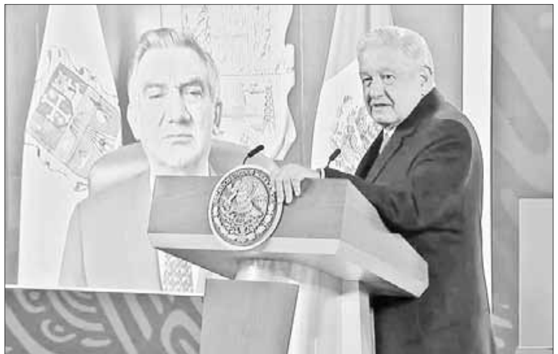
▲ El presidente Andrés Manuel López Obrador dijo ayer, en su conferencia en Palacio Nacional, que an-

Asimismo, aseguró que con base en una investigación sólida y científica no existen evidencias sobre el posible involucramiento de policías estatales, como señaló un medio. "En su momento nos ofende, en el sentido del trabajo que se quiere desprestigiar las circunstancias de este trabajo de estas instituciones que en esta transformación se están volcando al servicio de la seguridad de nues-