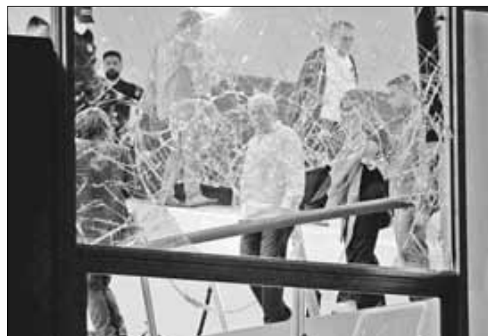
▲ El presidente de Brasil, Luiz Inácio Lula da Silva, examinó el 8 de enero de 2023 los daños al palacio presidencial de Planalto después de que fuera asaltado por partidarios del ex mandatario Jair Bolsonaro.

Por otra parte, al menos 2 mil 250 elementos antimotines serán desplegados el lunes en Brasilia para custodiar los actos oficiales en los cuales se repudiará el intento de golpe de Estado del 8 de enero de 2023, informó el ministro interino de Justicia y Seguridad Pública, Ricardo Cappelletti.