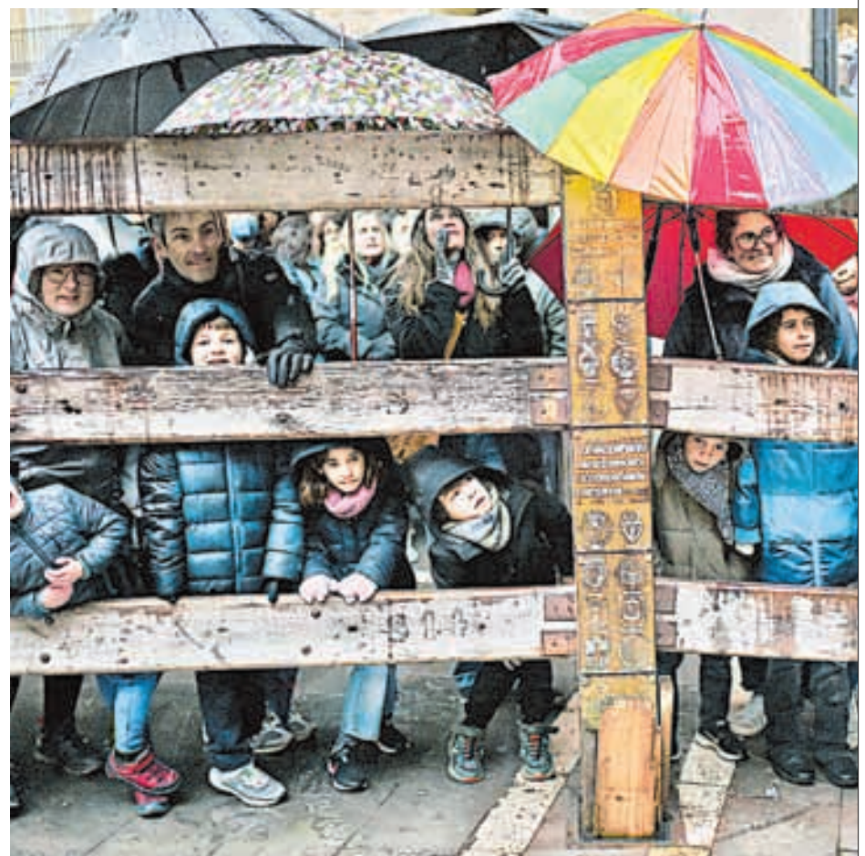
SIN IMPORTARLES EL FRÍO ni la lluvia, cientos de niños de Pamplona, España, recibieron a Melchor, Gaspar y Baltazar durante la llamada "cabalgata de los Reyes Magos", quienes detuvieron su recorrido para saludar a los pequeños. Los sabios