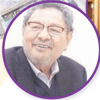
▲ El poeta Jaime Labastida.