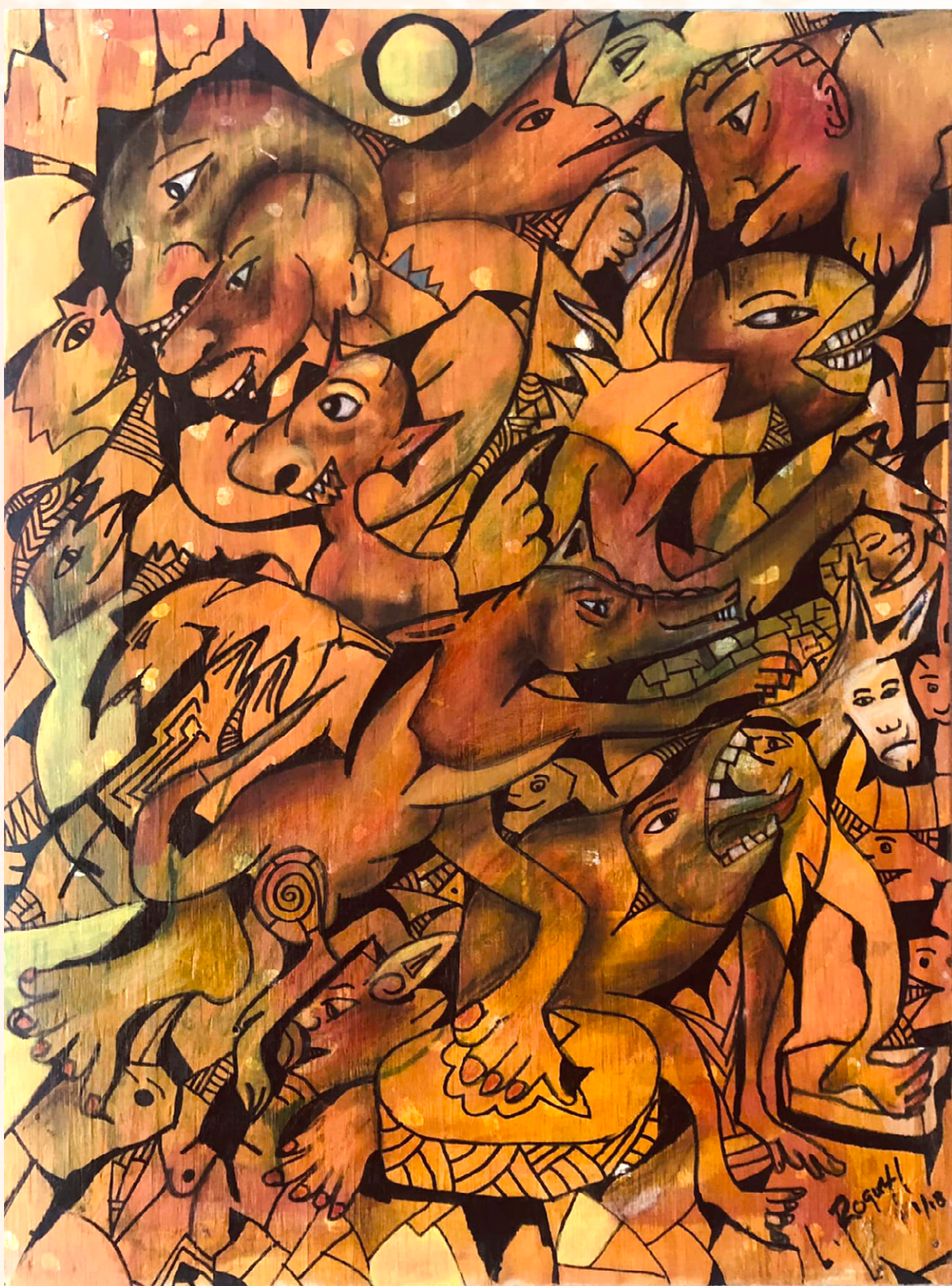
Sin título, 2024. Pintura de Lamberto Roque Hernández