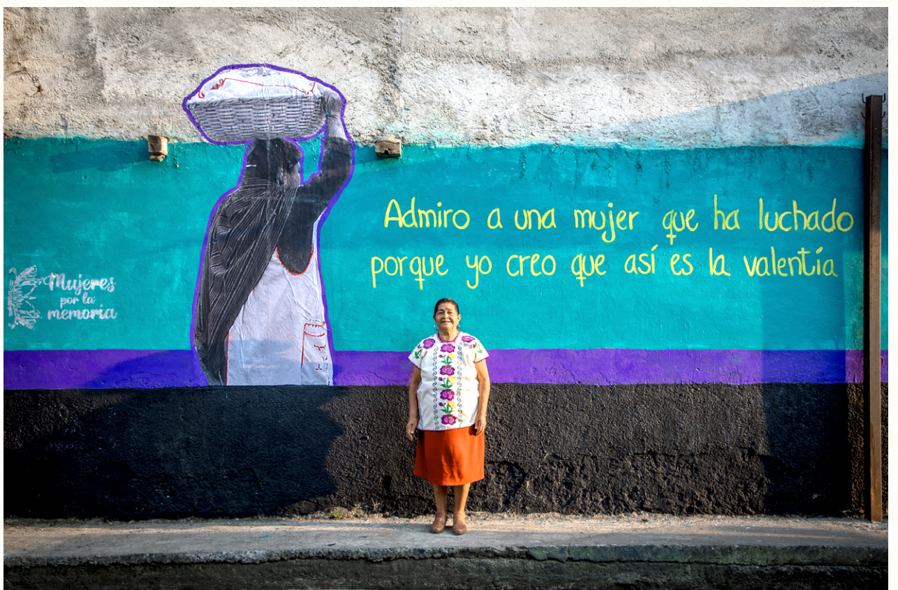
Commemoración del 13° aniversario del municipio p'urhépecha Cherán K'eri, Michoacán, 13 de abril de 2024.