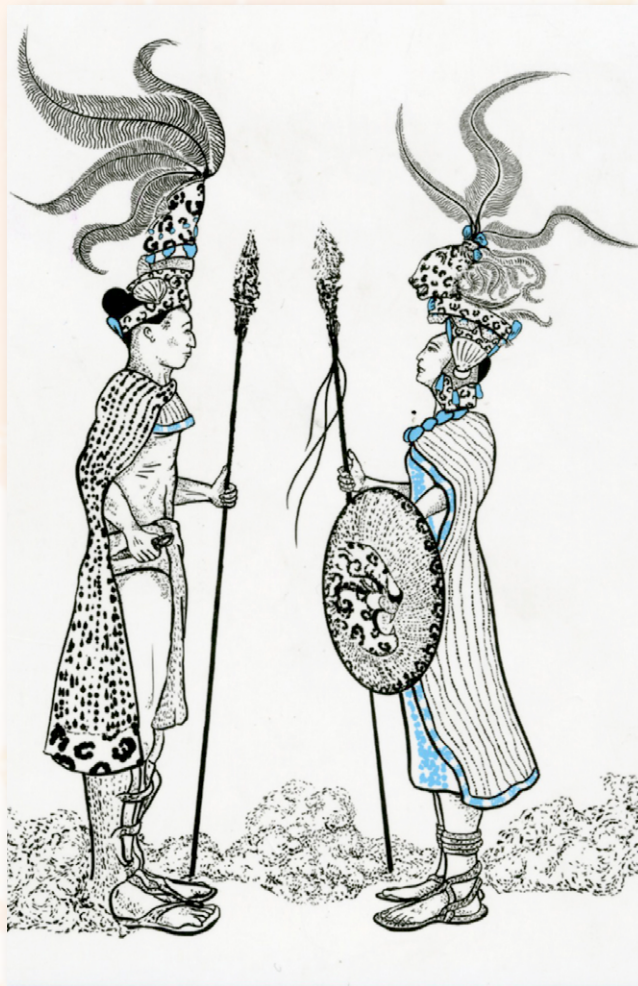
Ilustración de Roberto Alonso Gordillo ("Cohete con Dientes") para la portada de Ixbalam ek' / Estrella Jaguar (2023)

Ixbalam-ek' en su agonía se percibe como la mujer recién llegada al trono. La reina que con sólo mover la cabeza y hacer un guiño es obedecida por las mujeres jóvenes, adultas