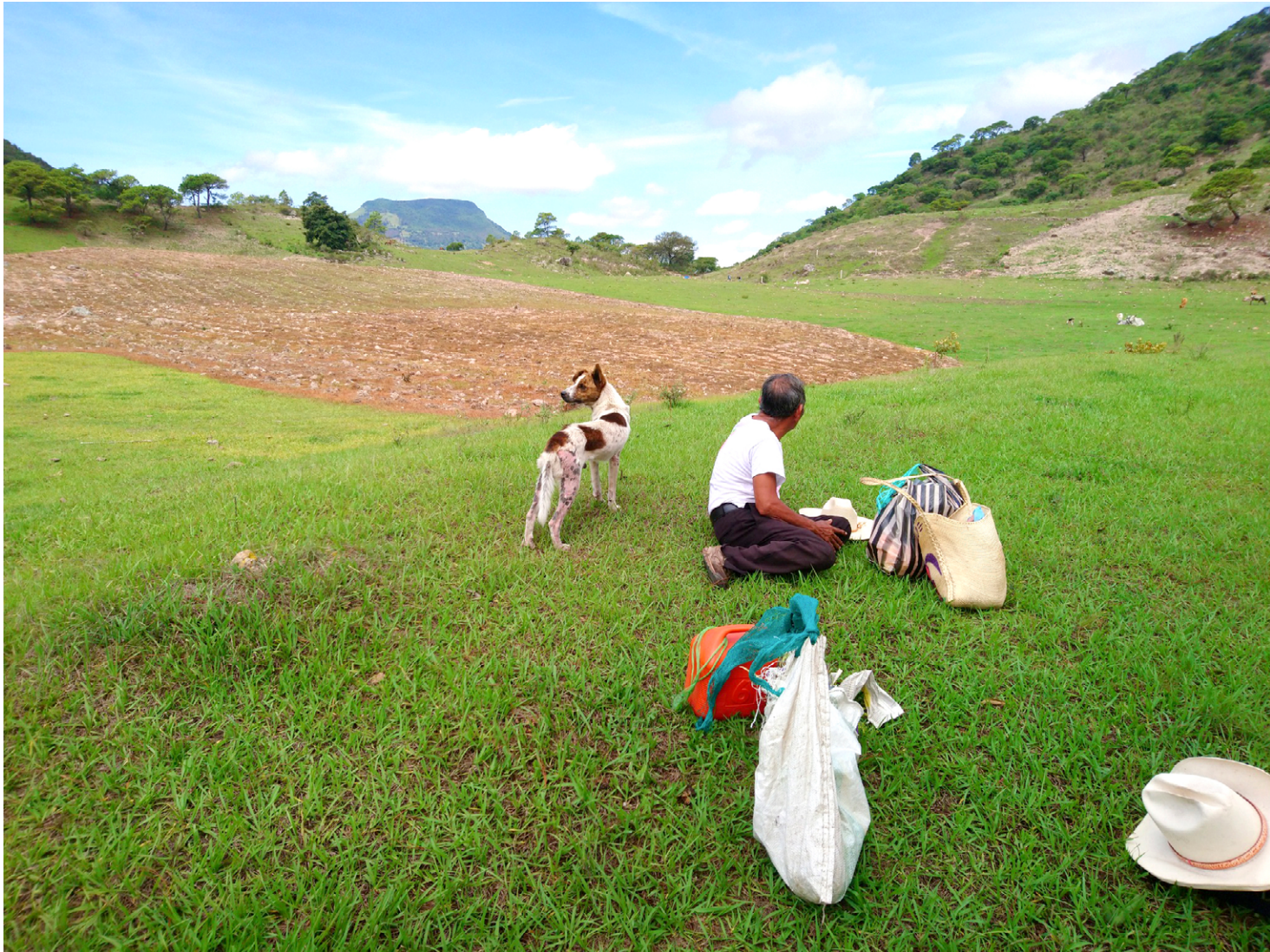
Tlatlajko ojtle / A medio camino.

LA COMUNIDAD CERRO DE TZOCOHUITE, MUNICIPIO DE ZACUALPAN, BALUARTE CONTRA EL EXTRACTIVISMO EN LA SIERRA NORTE DE VERACRUZ