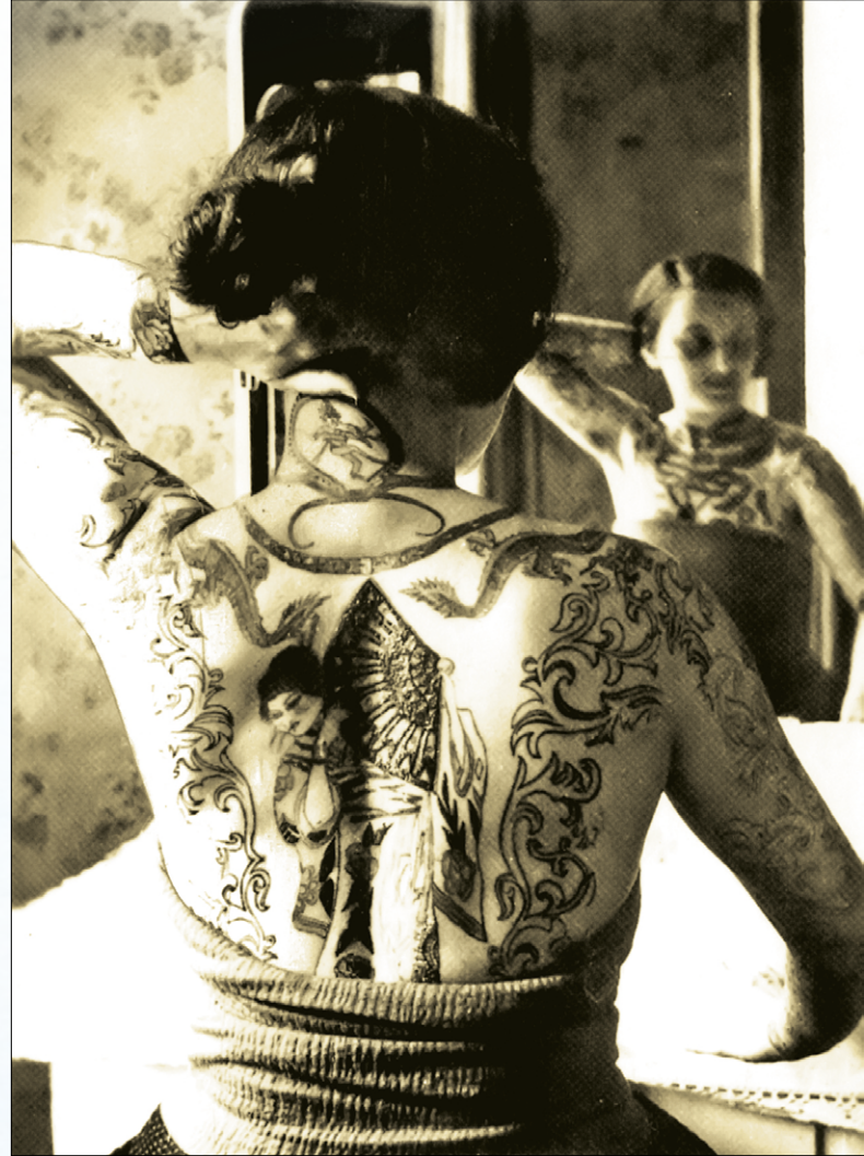
Fotos anónimas (Robert Flynn Johnson, anonymous: enigmatic images from unknown photographers , Thames & Hudson Inc., Nueva York, 2004)