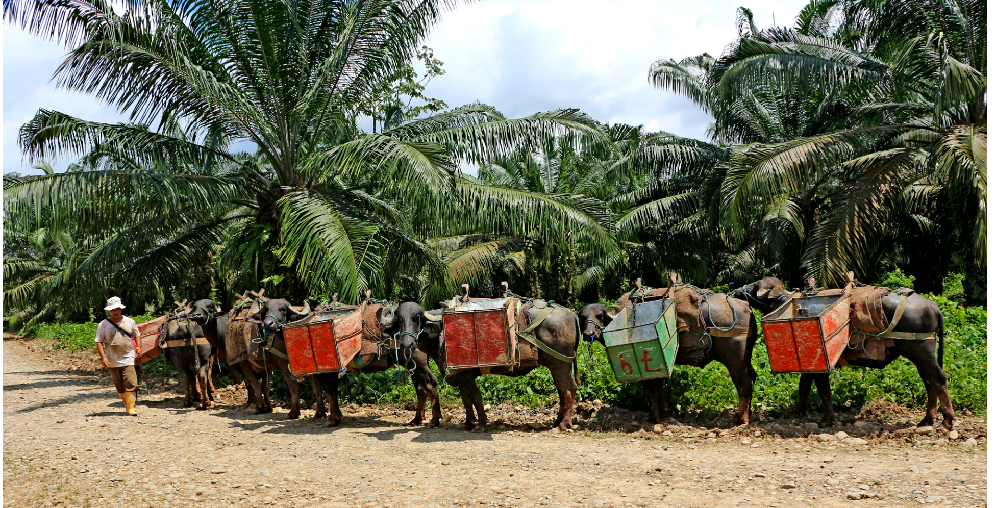
Extracción de palma africana en Ecuador.