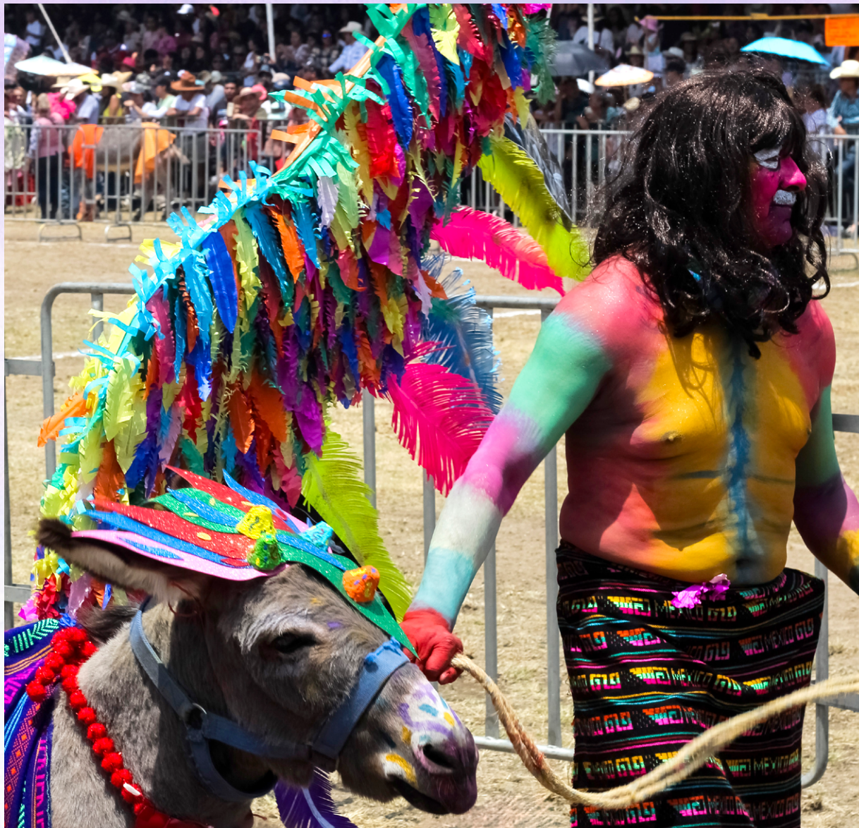
El "burro alebrije" obtuvo el segundo lugar en la 59ª Feria Nacional del Burro. Otumba, Estado de México, 1 de mayo, 2024.