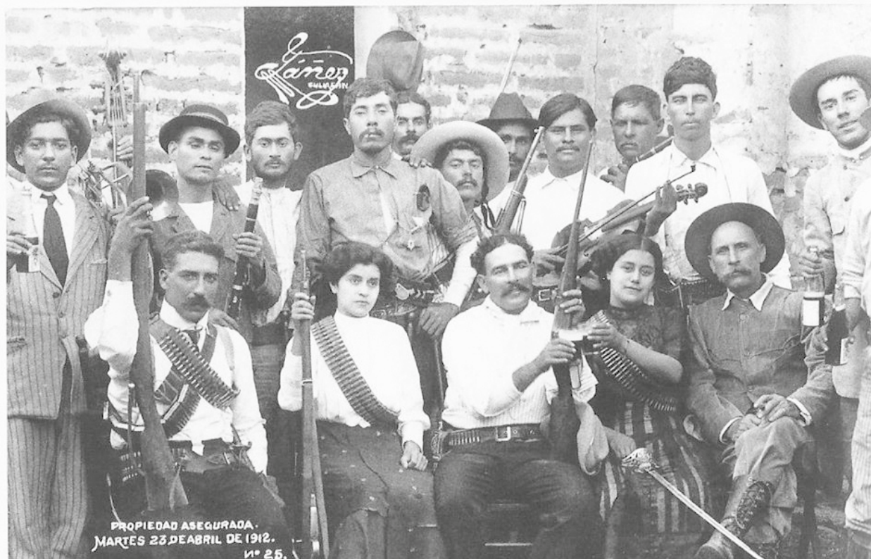
Banda musical durante la Revolución en Sinaloa, abril de 1912.