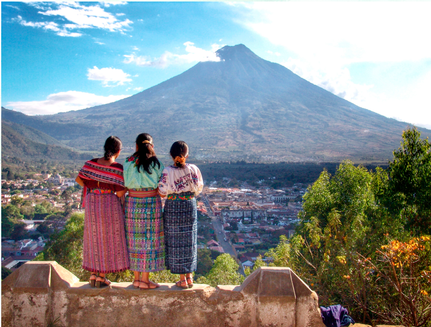
Tres hermanas contemplan el Volcán de Agua desde Ciudad Antigua, Guatemala.