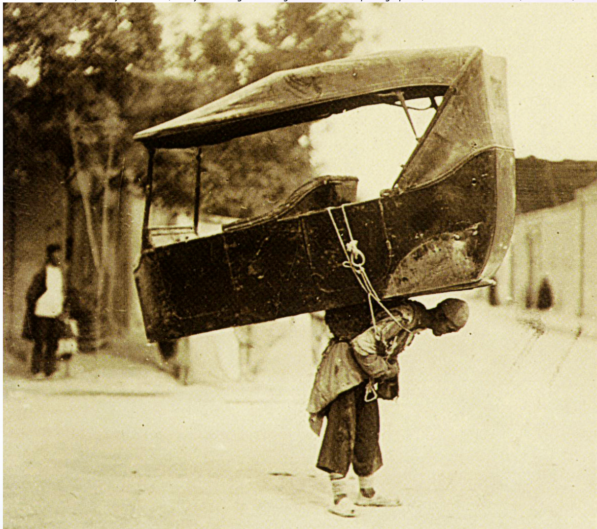
Foto anónima (Robert Flynn Johnson, anonymous: enigmatic images from unknown photographers , Thames & Hudson Inc., Nueva York, 2004)

Samar Bosu Mullick: Sylvan Tales: Stories from the Munda country (adivaani-One of Us, Kolkata, India, 2015)