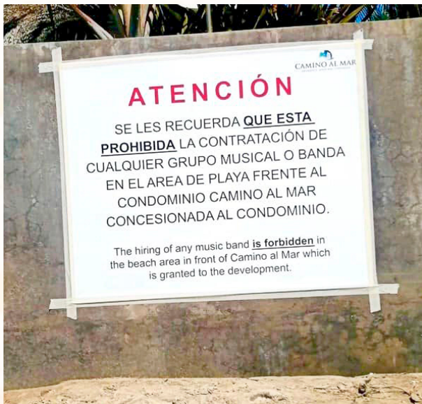
Aviso en la playa frente al hotel Camino del Mar, Mazatlán, Sinaloa, marzo de 2024. Foto tomada de redes sociales

José Ángel Espinoza Aragón Ferrusquilla en el popular programa radiofónico “La banda de Huipanguillo”, donde hacía el papel del presidente municipal don Celso Boquerones. Fuente: Sinaloa, Historia y Destino , de Herberto Sinagawa