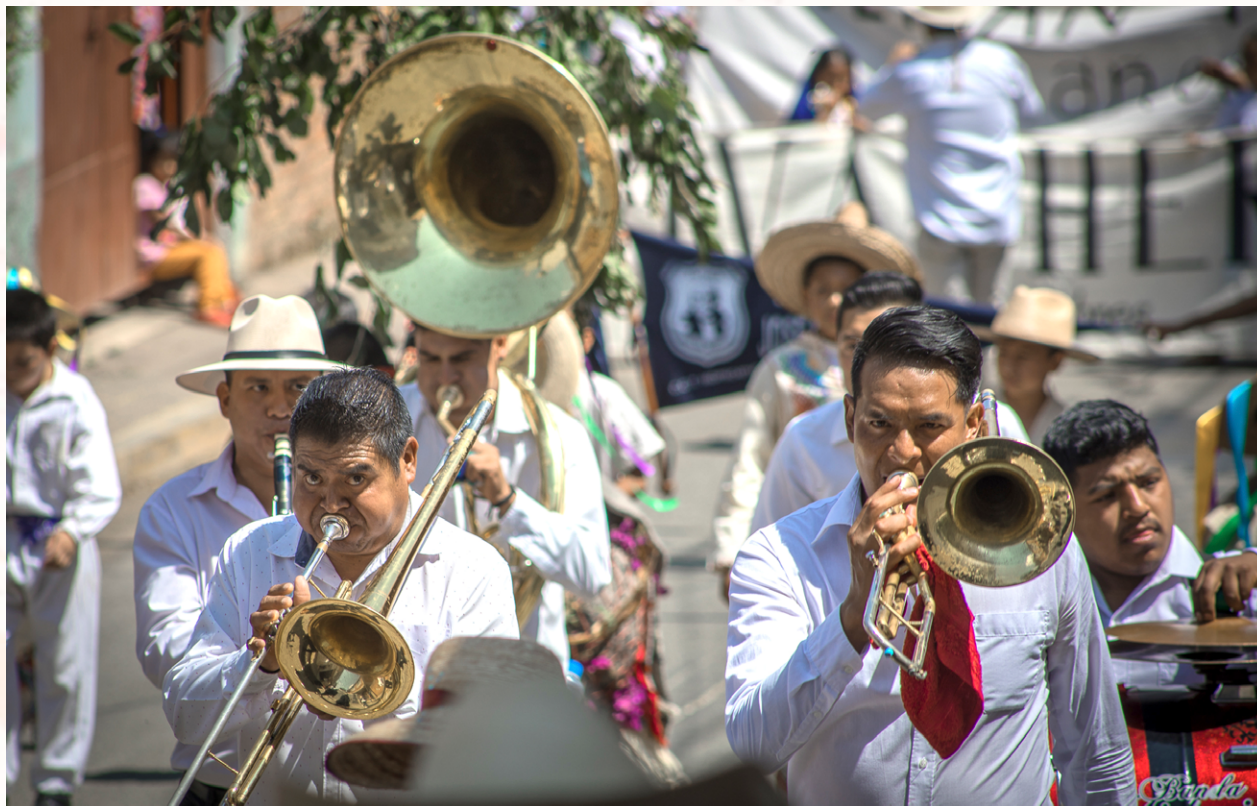
Banda de alientos en Cherán K'eri, Michoacán.

NO REBAJEMOS A RUIDO EL ESTRUENDO Y LA FURIA, QUE NO SOMOS FILARMÓNICOS DE VIENTO Y TOLOLOCHE NI HOTELEROS INDIGNADOS Y EXIGENTES NI TAMPOCO FUNCIONARIOS PÚBLICOS HECHOS A CONTEMPORIZAR NI, POR ÚLTIMO, TURISTAS AGRAVIADOS