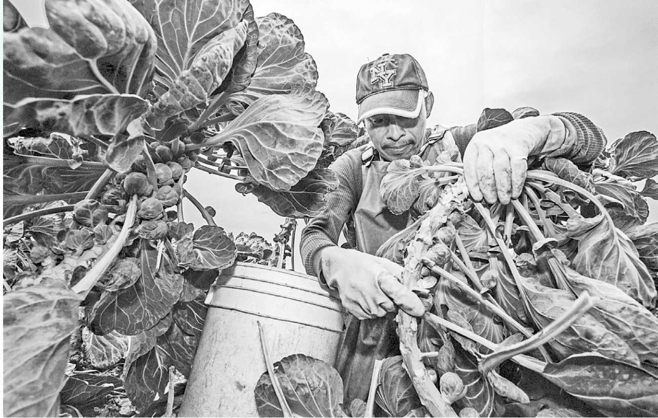
Trabajador agrícola cultivando coles de Bruselas, a estos trabajadores se les paga de acuerdo a la cantidad de coles que cosechan, Watsonville, CA, USA, 2016.