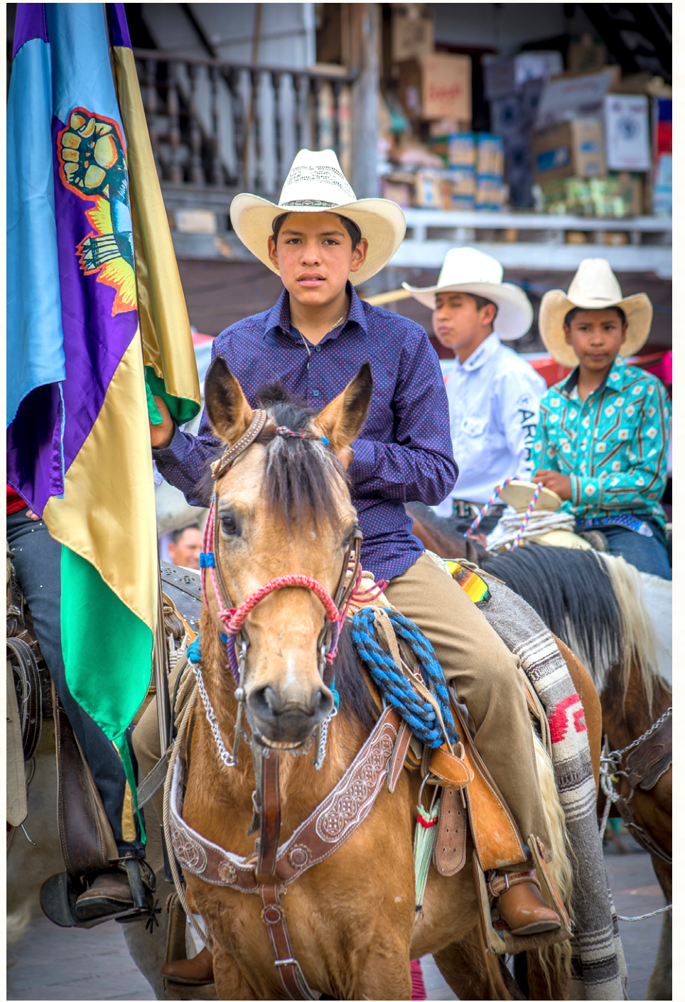
Commemoración del 13° aniversario del municipio p'urhépecha Cherán K'eri, Michoacán, 13 de abril de 2024. Serie fotográfica de Francisco Lión