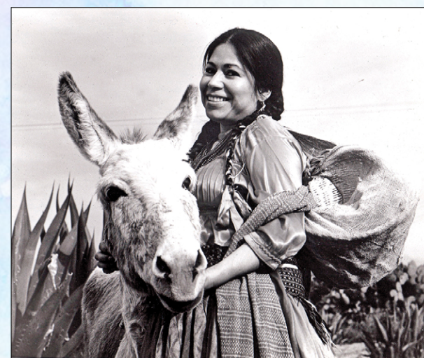
María Elena Velasco, "La India María" y su burro Filemón. Promocional de los años setentas.

La pista asnal, "el burrodromo más grande de Latinoamérica", parece un coliseo romano a reventar. Un hombre carga un botellón y regala a los asistentes vasos con el blanco néctar de los dioses. Antes del climático desfile se jugó un partido de polo sobre burro entre los equipos Pachuca y América, ganado 7-4 por el primero. También se realizaron carreras de