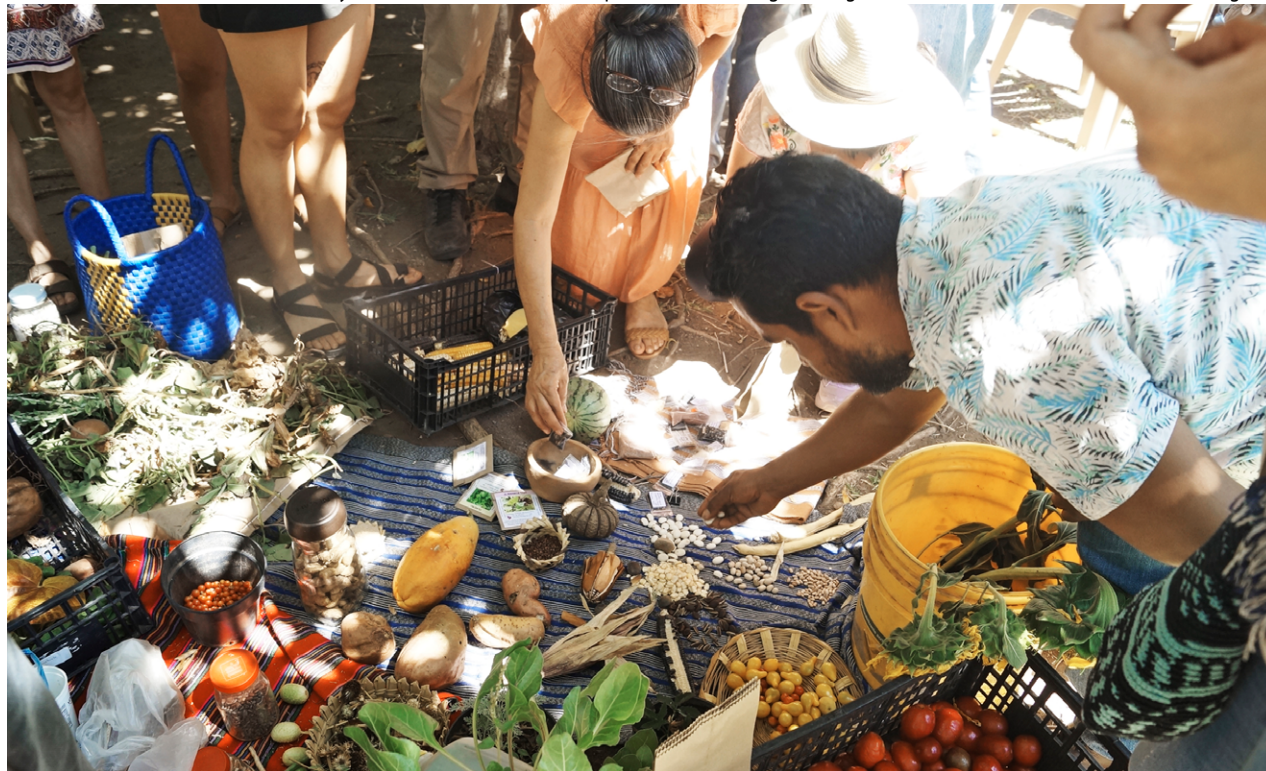
Tercer Festival de las Frutas y Semillas Nativas, en el municipio “en transición agroecológica” de El Limón, Jalisco.