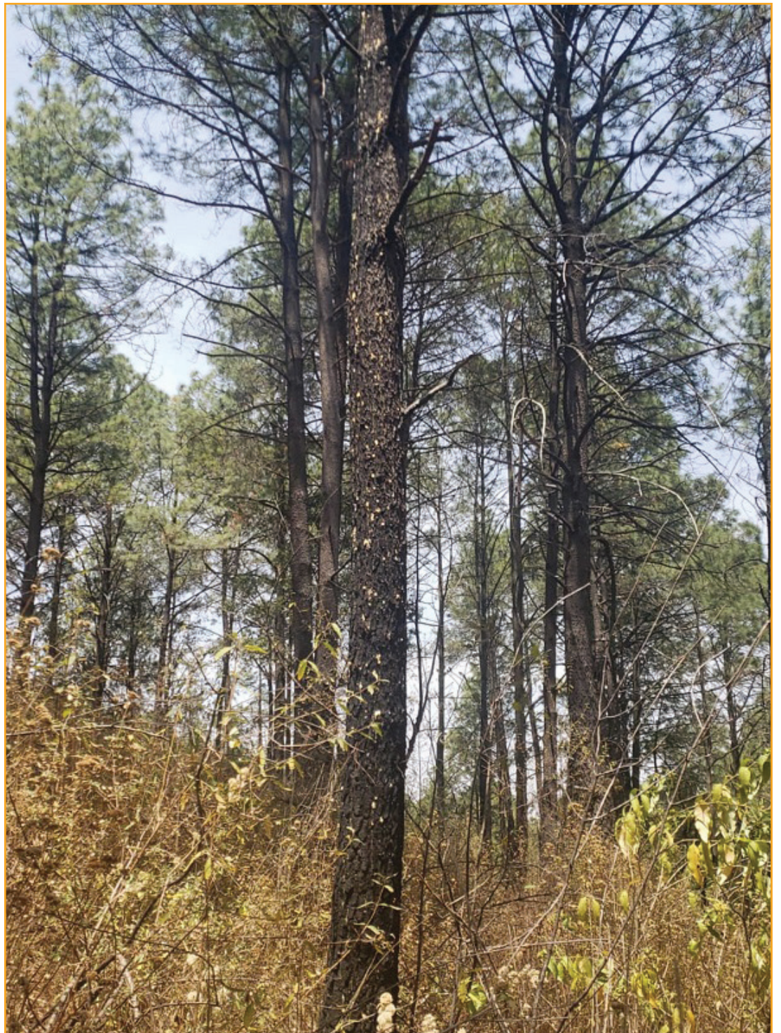
Bosques de pino son atacados por insectos descortezadores que acaban por matar miles de árboles