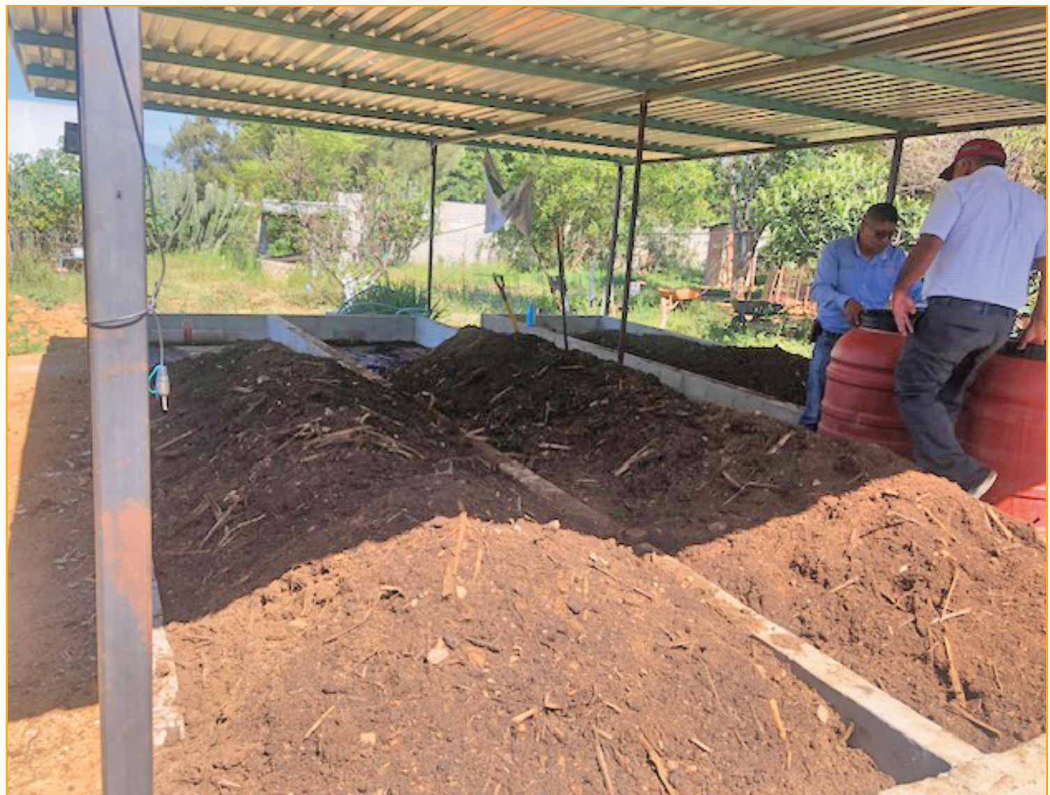
Preparación de composta

nutrición y al uso de plaguicidas tóxicos (ver artículo de Fernando Bejarano, en este número) que han contaminado a los suelos, la pérdida de fertilidad es común en todo el país. Según el INEGI (2014) cerca del 53 por ciento de la superficie territorial del país se encuentra afectada por erosión hídrica, impactando principalmente a suelos agrícolas de temporal que se usan para la producción de autoconsumo (Cotler et al. , 2020).