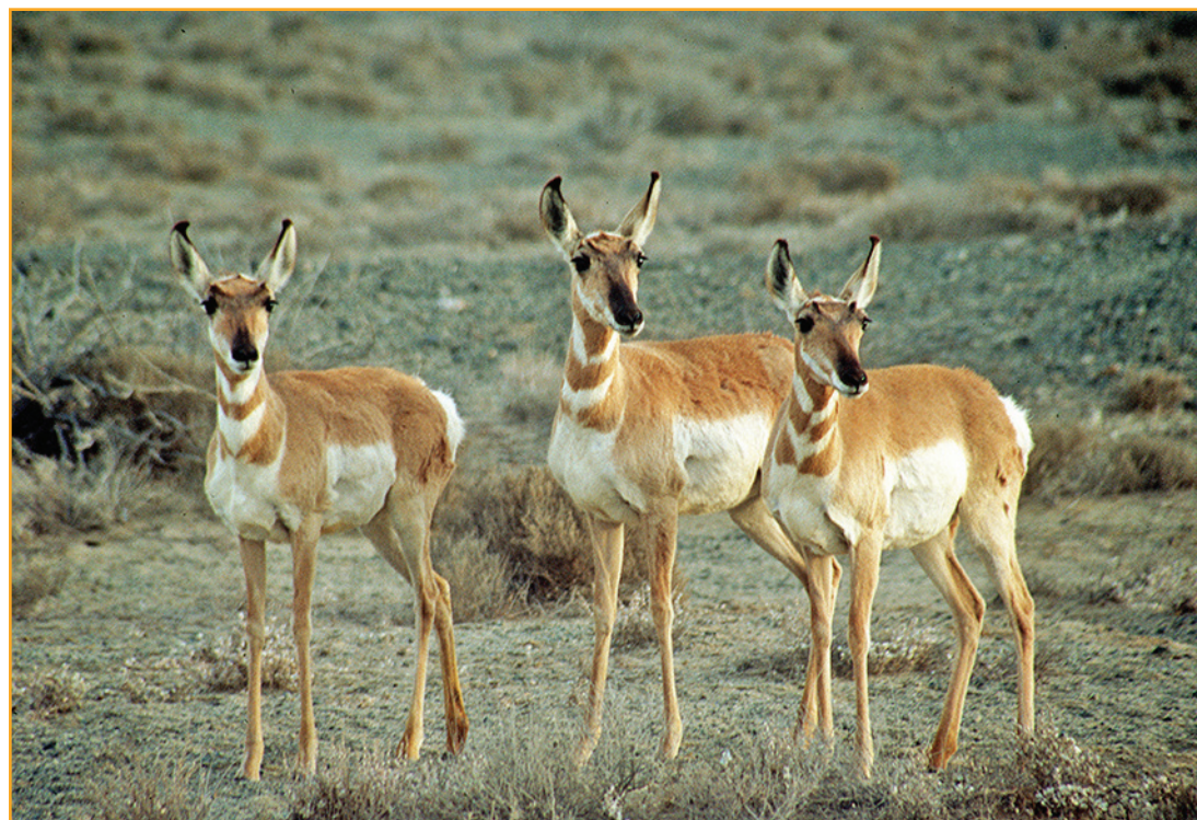
Berrendos y ballenas grises de la reserva de la biosfera El Vizcaíno

La extinción de poblaciones y especies, la defaunación, la desaparición de organismos del suelo, polinizadores y variedades de cultivos tradicionales, invasiones de especies exóticas, cambios en la composición de las comunidades