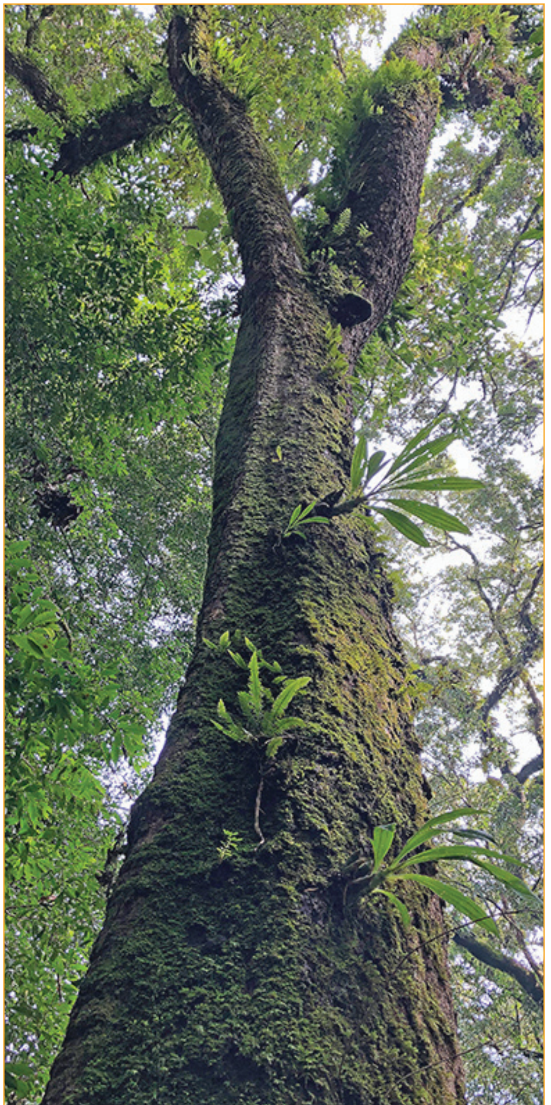
Encino de la reserva de la biosfera Sierra de Manantlán

Ante las próximas elecciones, las candidatas y candidatos a puestos de elección popular deben estar conscientes de que, para garantizar la viabilidad de la sociedad y los derechos de las presentes y futuras generaciones a un ambiente sano, necesitamos conservar la biodiversidad.