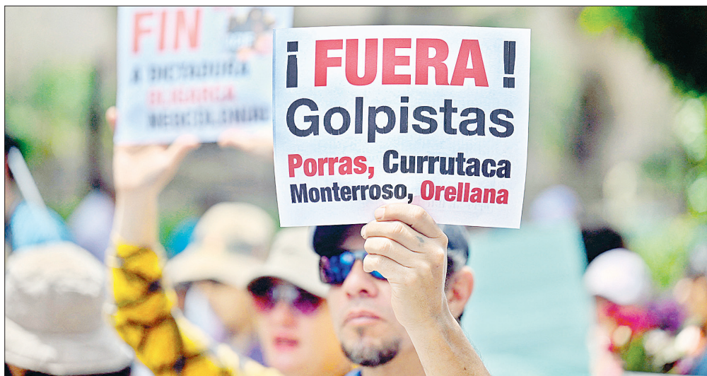
▲ Cientos de guatemaltecos marcharon ayer con flores en el centro de la capital para exigir la renuncia de los responsables de la crisis electoral que padece esa nación.