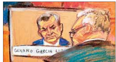
▲ Juicio de Genaro García Luna en NY. Ilustración Jane Rosenberg