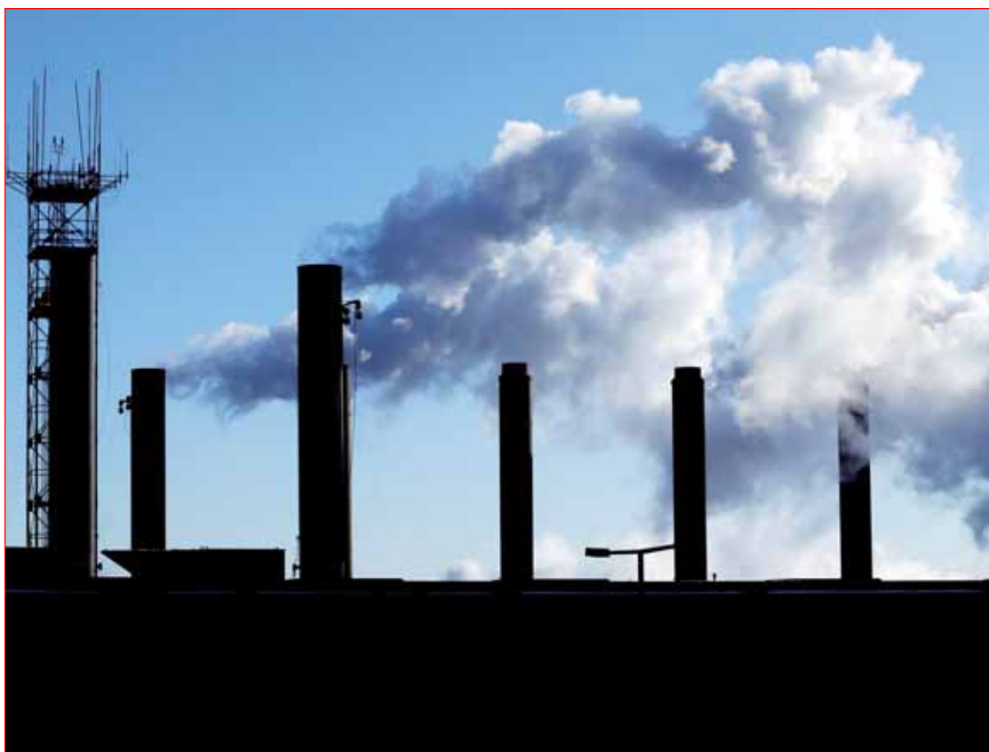
Chimeneas de una fábrica cerca del aeropuerto de Chicago. El pasado noviembre la producción manufacturera de Estados Unidos mostró su mayor incremento en nueve meses debido a la expansión de varios sectores, lo que muestra que esa economía se va fortaleciendo ■ Foto Ap

En 2015 no está previsto que algún exportador de petróleo de Medio Oriente caiga en recesión (aunque medir el crecimiento en países en guerra es casi imposi-