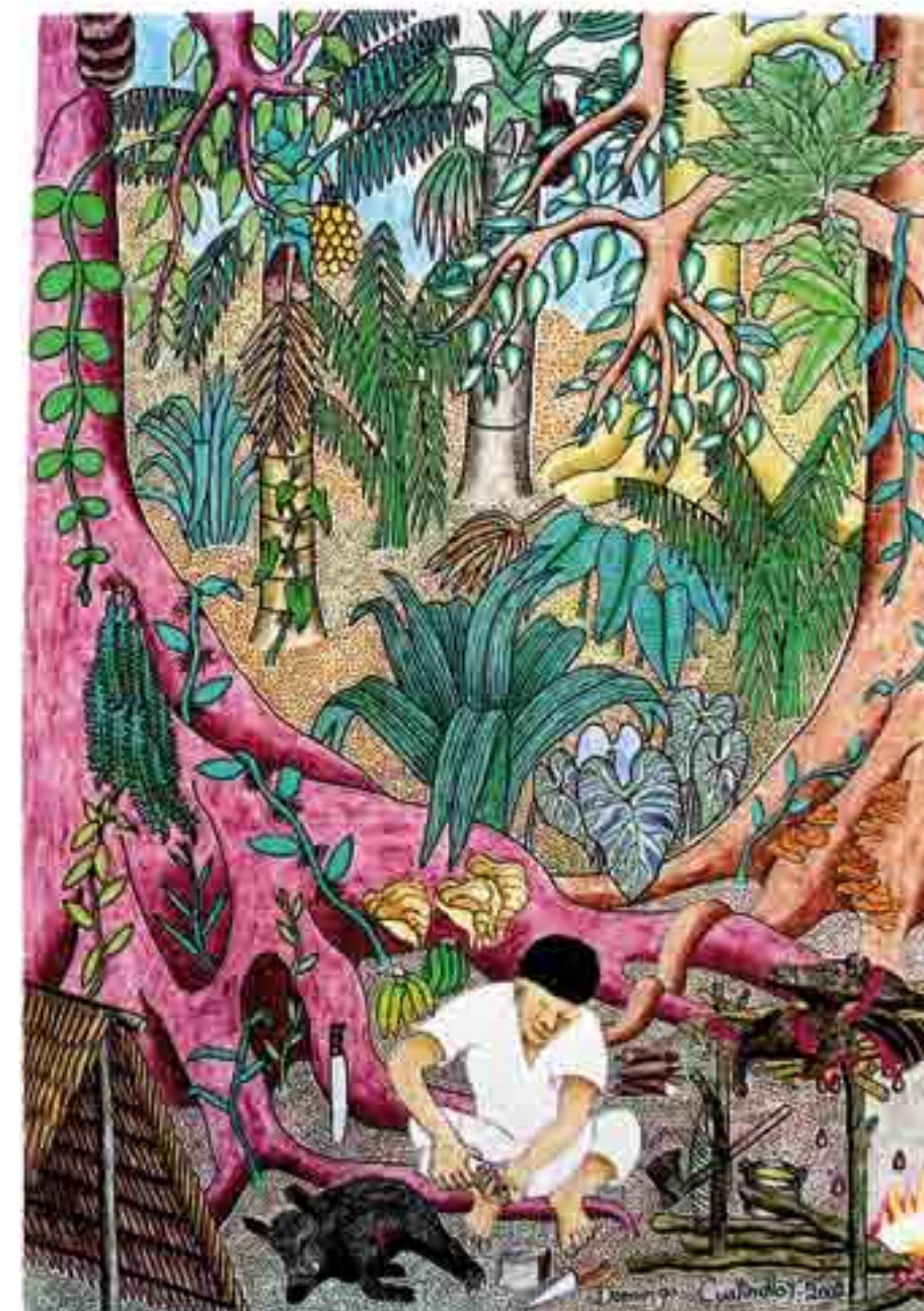
Asando carne. Pintura: Domingo Cuatindioy, Ecuador, 2002