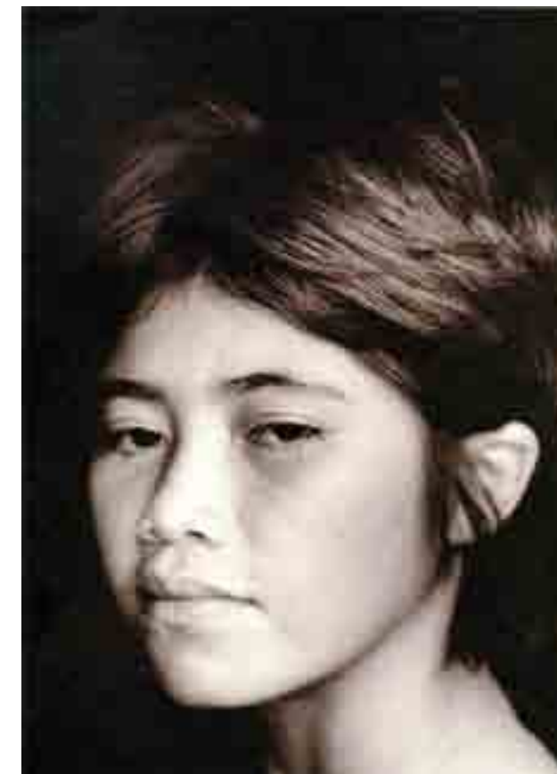
Fotos: JOSÉ ALBANO. Niños tapeba. Ceará, Brasil. Novas Travessias, Contemporary Brazilian Photography, Verso, 1996