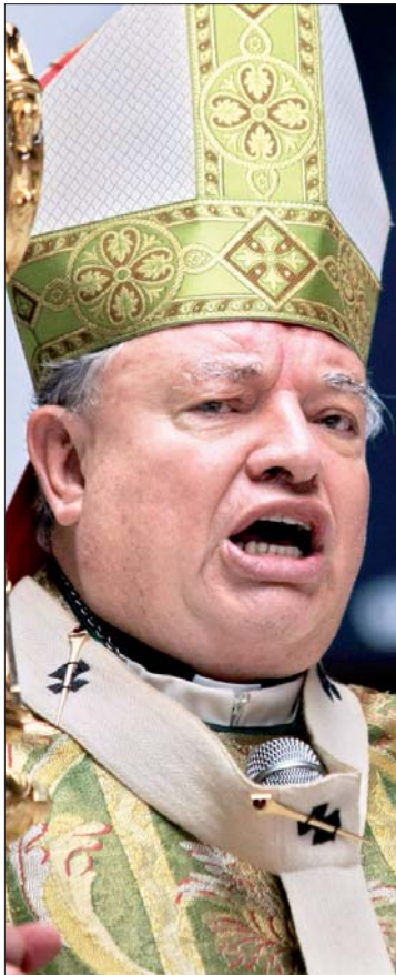
El cardenal mexicano criticó lo que llamó "aumento de poder" de mandatarios como Fidel Castro (Cuba), Hugo Chávez (Venezuela), Evo Morales (Bolivia) y Michelle Bachelet (Chile), y preguntó si el presidente de Estados Unidos, George W. Bush, podría detener esta "tendencia peligrosa"