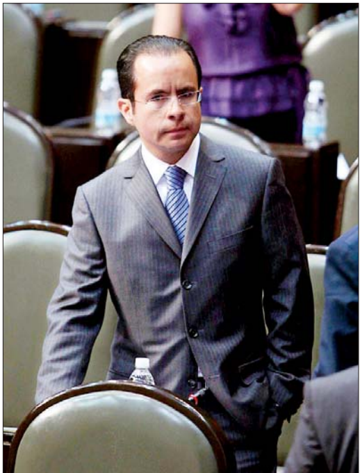
César Nava, presidente de Acción Nacional, se presentó en la sesión ordinaria para acusar a Beatriz Paredes de aceptar el incremento a IVA e ISR como truco para abortar una alianza entre la derecha y la izquierda en el estado de México. También invitó a la tlaxcalteca, junto con el gobernador Enrique Peña Nieto, a debatir para ver quién miente. La dirigente del Partido Revolucionario Institucional dijo: “no puedo hablar con el panista”