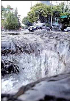
Una copiosa fuga de agua potable se produjo este viernes en la calle de Concepción Béistegui en la colonia Del Valle, cuando empleados de Cablevisión rompieron una tubería principal