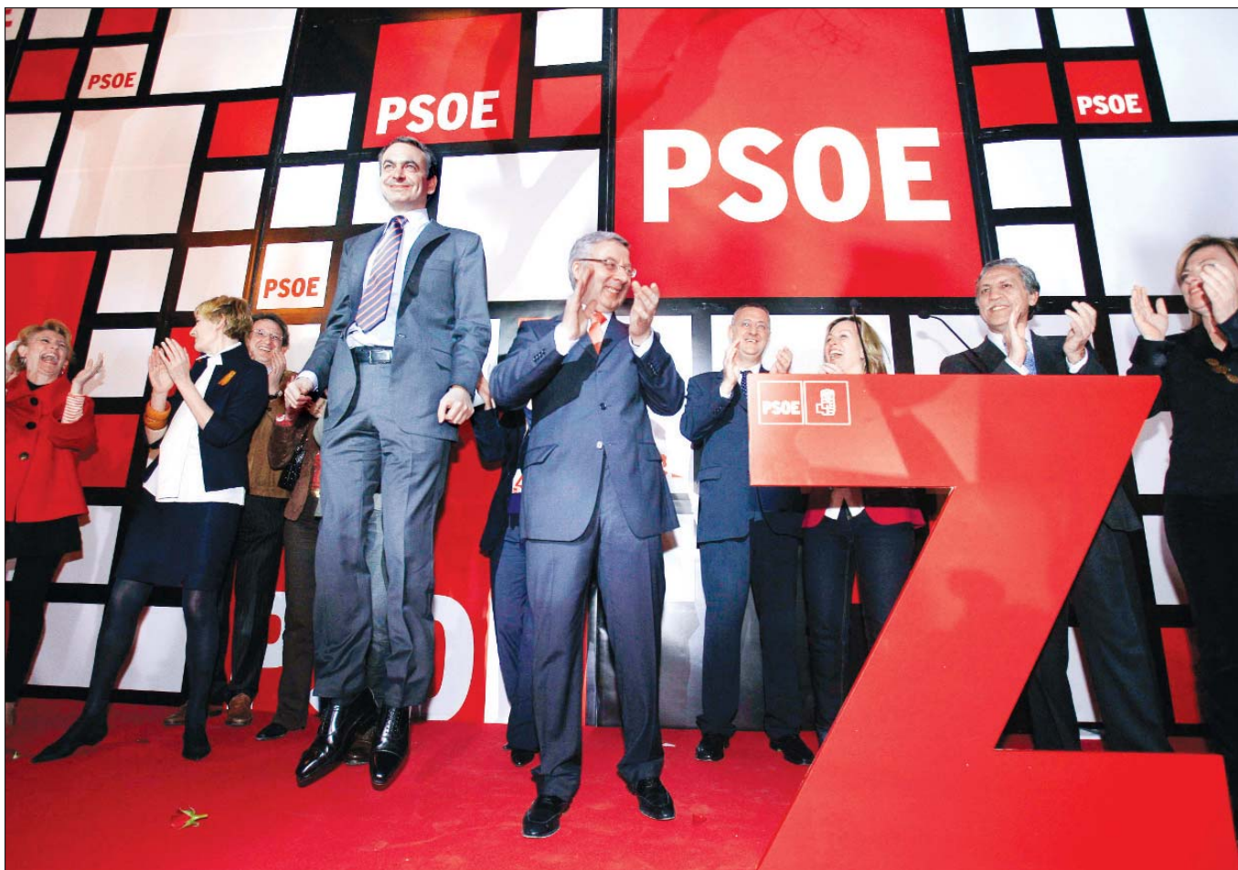
José Luis Rodríguez Zapatero, presidente del gobierno español, salta de gusto al anunciarse el triunfo del Partido Socialista Obrero Español en las elecciones generales de ayer domingo. El relecto mandatario invitó a fuerzas políticas rivales a superar "la crispación"