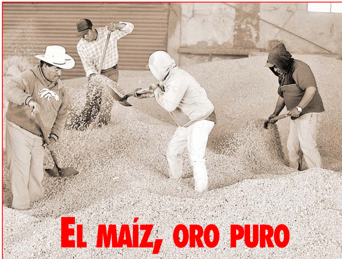
Consumo de maíz* (millones de toneladas)

En años recientes, el uso de maíz para forraje no ha crecido en absoluto. Esto se debe al sacrificio extensivo de aves de corral en los