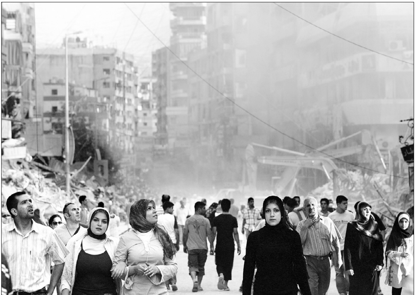
Habitantes de Beirut recorren los suburbios de la capital devastados por los bombardeos israelíes. Tel Aviv ordenó lanzar desde sus aviones panfletos en los que advierte a refugiados que no vuelvan a sus casas en el sur de Líbano, pues la situación “todavía es peligrosa mientras no se despliegue en la región la fuerza pacificadora”. Unos 700 mil civiles quedaron desplazados a raíz de los combates entre el ejército de Israel y la milicia de Hezbollah. El cese de hostilidades entró en su segundo día sin conflictos mayores