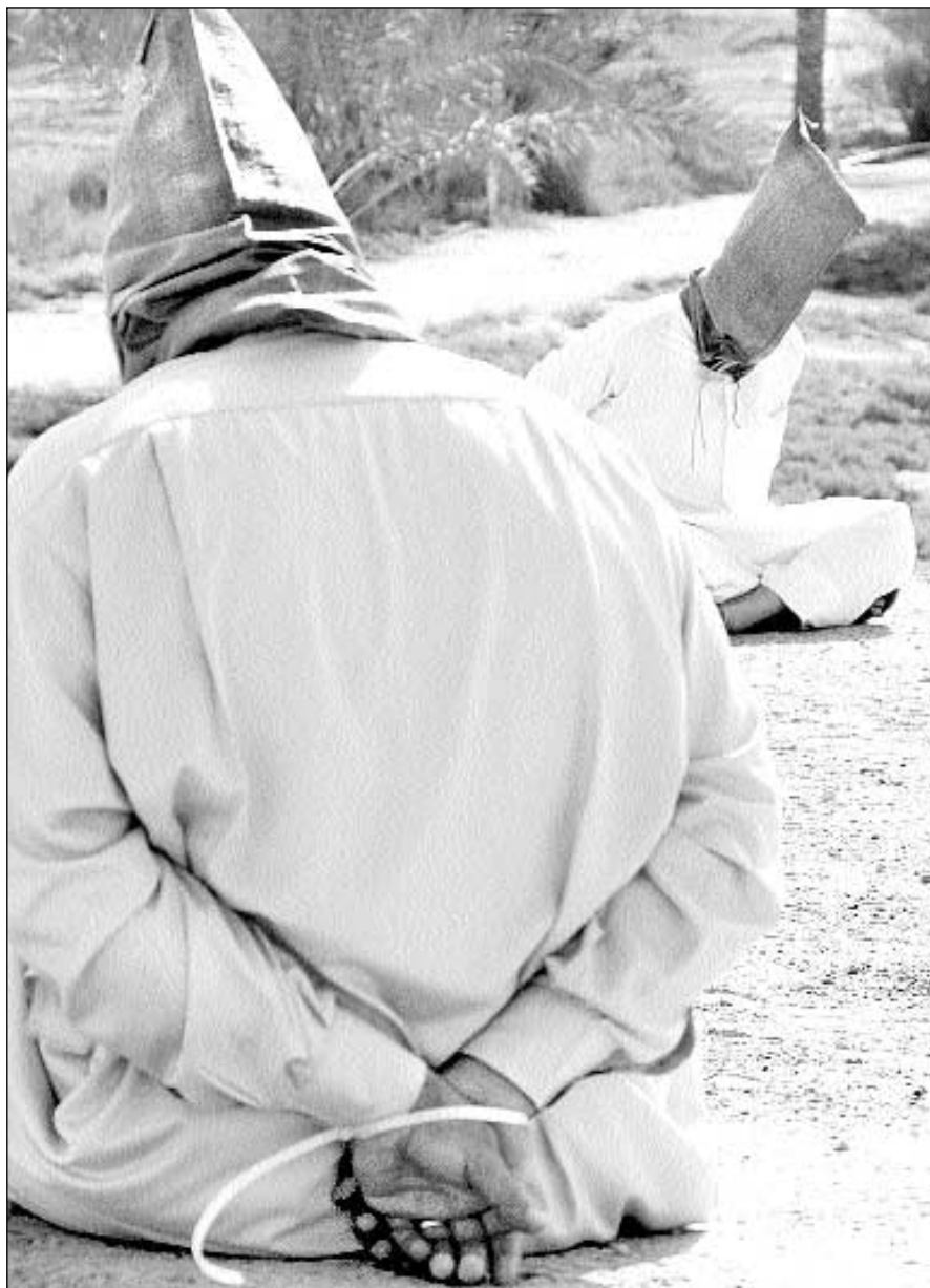
Iraquíes detenidos por soldados estadounidenses en Fallujah. Durante una redada en una localidad cercana a esta ciudad, las fuerzas de ocupación dieron muerte ayer a tres civiles

Muchos iraquíes dirán, con justa razón, que los aterrados soldados estadounidenses que han matado a tantos inocentes antes, durante y después de los ataques contra sus patrullas son tan