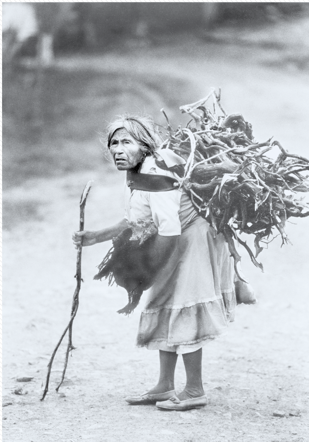
Jolia, San Luis Potosi, 1990.

Los años se viven y del maíz se hace tortillas Se tejen las historias y se recuerdan los tiempos Recordamos a los 43 estudiantes, desde el corazón Y que de las palabras broten xnichimal ko'ontontik ☞