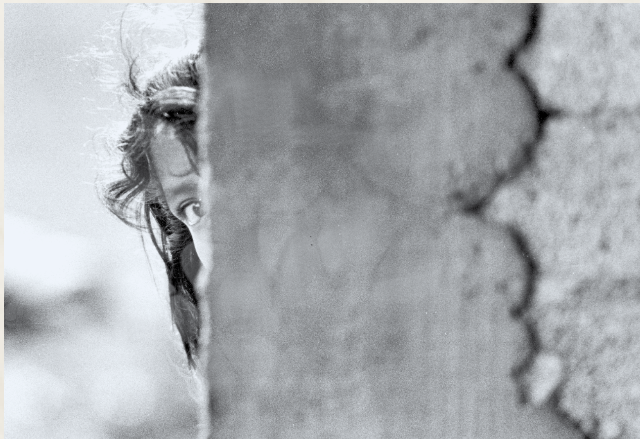
Tlatongo, Oaxaca.

En el tiempo antes de la llegada de los hombres de armadura reluciente, los abuelos mayas habían desarrollado un sistema de comunicación muy organizado que consistía en la asignación de un cargo político a un joven que pudiera tener habilidades para la lengua y el lenguaje, así como hermenéutica y prudencia para llevar de pueblo en pueblo mensajes que alertaban sobre huracanes o sequías, guerras o invasiones. Además de todo esto el joven tenía que tener, a su vez, gran velocidad y habilidades de orientación para andar en caminos difíciles. De este modo, el joven aj Tóojol lleva el mensaje a otro pueblo, el cual le entrega al Aj Tóojol de ese pueblo para que la cadena continúe.