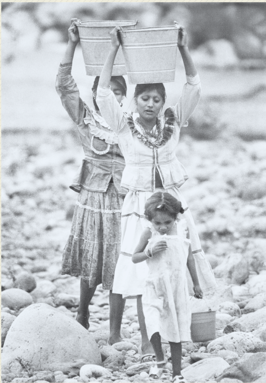
Frontera sur, Chiapas, 1990.

Hay aquí, entonces, un hecho y un derecho. El hecho es que, a pesar de la violencia de la colonización europea y anglosajona en este continente, algunos grupos indígenas sobreviven, aunque sea empobrecidos económica y culturalmente y con su población muy