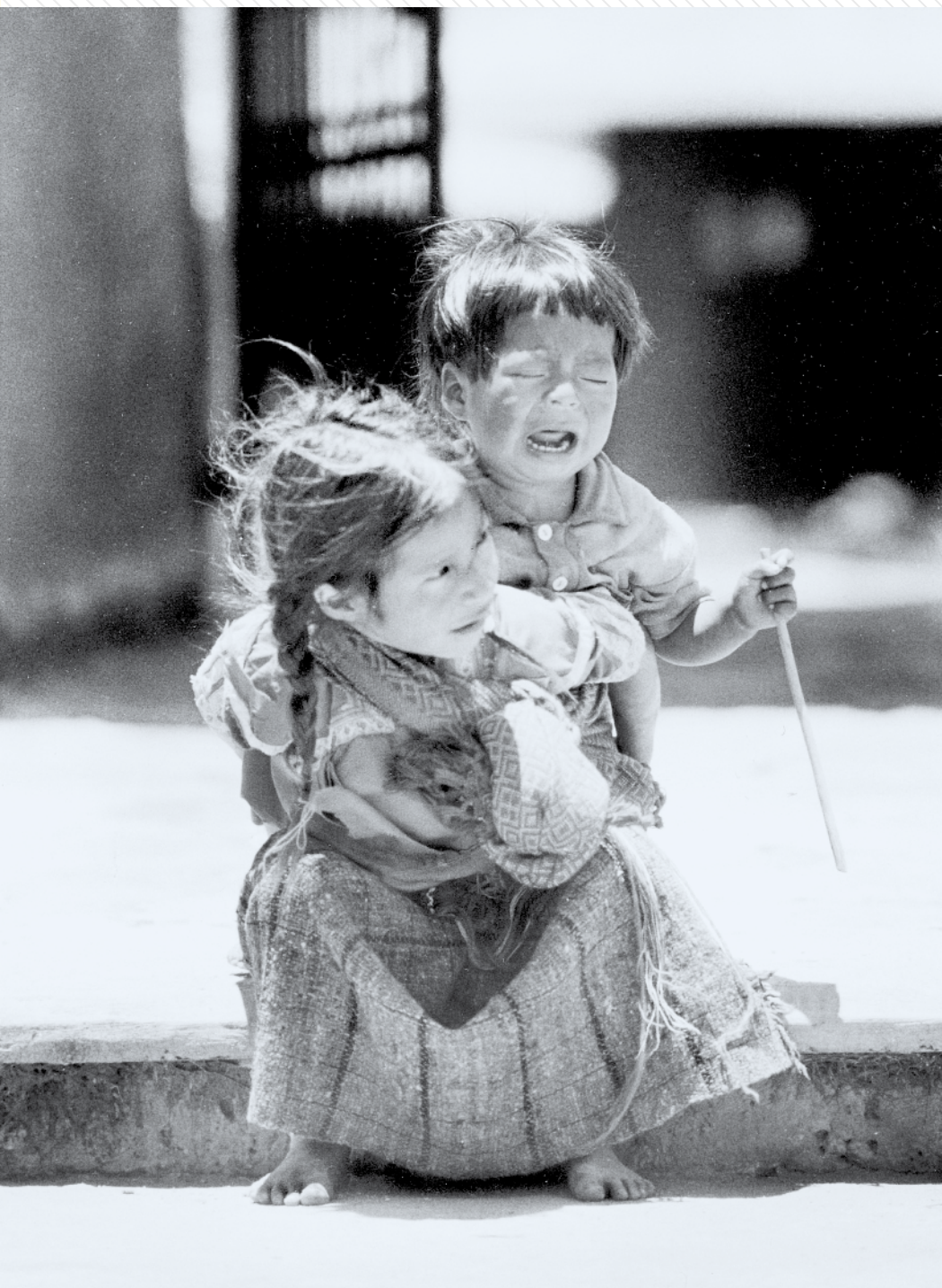
San Juan Chamula, Chiapas, 1993.

10. Configurar un nuevo orden económico y financiero internacional, basado en los principios de equidad, soberanía nacional, intereses comunes y armonía con la naturaleza. Un nuevo orden que promueva la cooperación y solidaridad entre los estados y pueblos; un nuevo orden que esté orientado a cambiar patrones de producción y consumo no sustentable; que disminuya la brecha entre ricos y pobres, entre países desarrollados y los en vías de desarrollo. El desarrollo económico no debe estar orientado al mercado, al capital y a la ganancia inescrupulosa; debe ser integral y estar orientado a la felicidad de la gente, a la armonía y equilibrio con la madre tierra. Por ello, los países en desarrollo debemos crear nuestros propios instrumentos financieros; no podemos seguir dependiendo de los donativos y préstamos condicionados del sistema financiero colonial capitalista. Debemos fortalecer los mercados regionales con visión solidaria y complementaria para sustituir las políticas de competitividad egoísta. Sólo así construiremos un horizonte civilizatorio para que todos juntos finalmente podamos Vivir Bien ☪