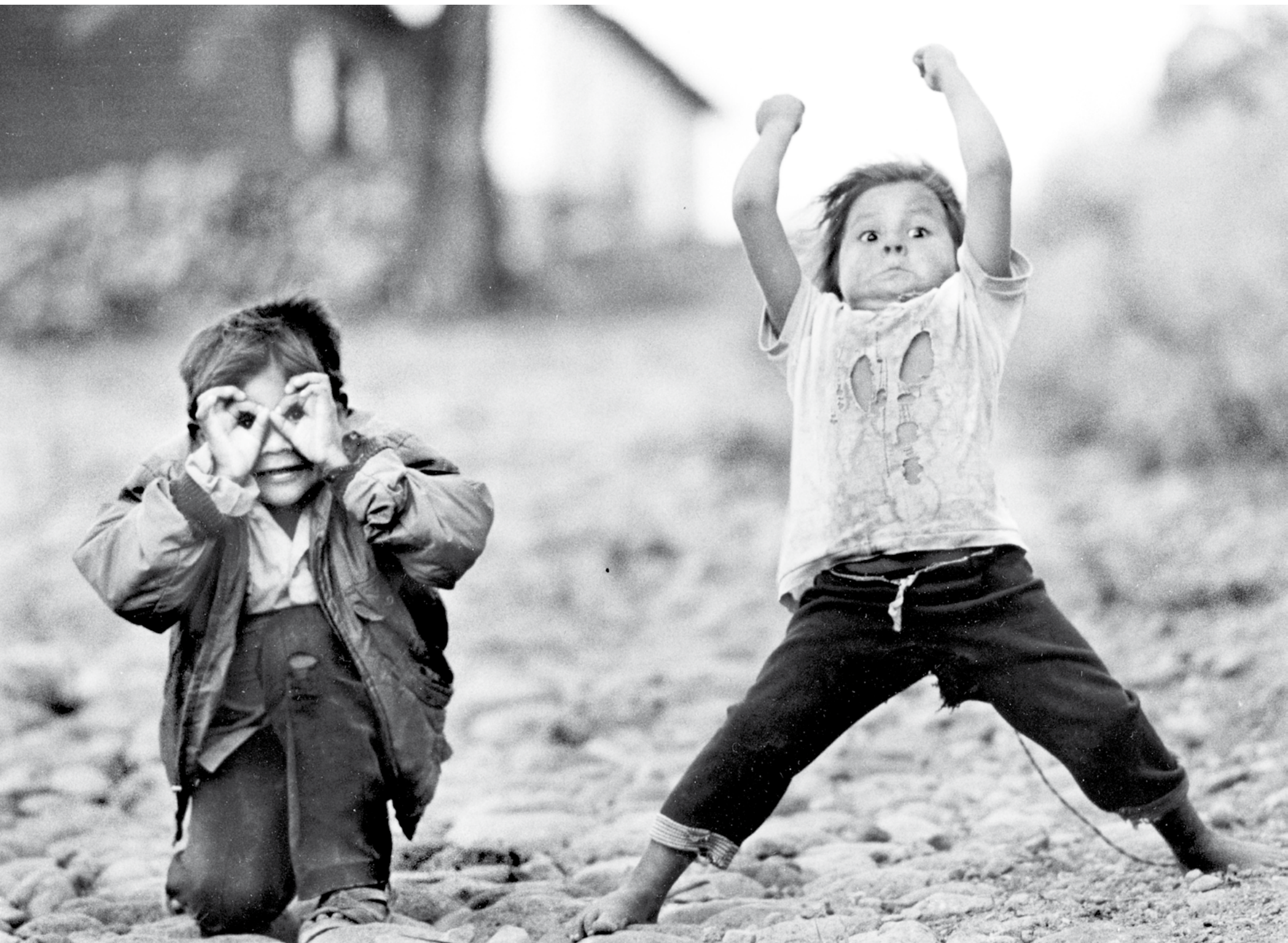
Sierra Madre Occidental, Nayarit, 1990.