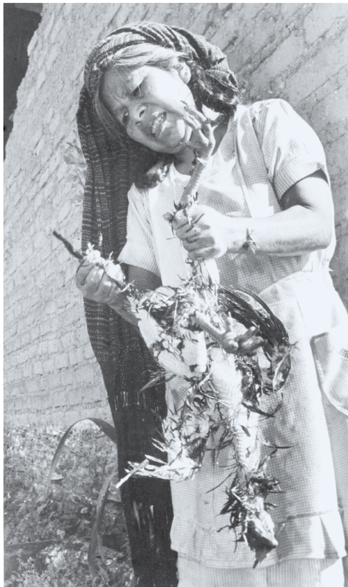
Oaxaca, 1993.

Es muy pronto para saber el desenlace. Al cierre de esta edición decenas de buses con compañeras y compañeros del Movimiento Indígena y Campesino de Cotopaxi (MICC) fueron impedidos de llegar a Quito a la Cumbre de los Pueblos por la policía. Incluso grupos enteros que comenzaron a caminar fueron cercados pese a saber que no pueden detener su paso libre, pero buscaron entorpecer su marcha y el encuentro. En cualquier caso, la autoridad moral de la Conaie ya quedó establecida por años de legitimidad y consecuencia. El movimiento indígena y campesino continental sigue reivindicando las propuestas y las banderas de la Conaie. Aunque exista el vaciamiento por la cooptación, el golpeteo, las amenazas y la deshabilitación promovida por las políticas públicas, su entereza sigue siendo diáfana. Conaie es una corazón madre de la constelación de comunidades que siguen defendiendo los territorios y sus recursos, la autonomía para resolver por medios y creatividad propios lo que más les importa: alimentación, salud, justicia, educación cultura, dignidad, horizonte propio. Sabedoras y sabedores de que tienen todo para cuidar la vida, a los pueblos, a la naturaleza que somos ☞