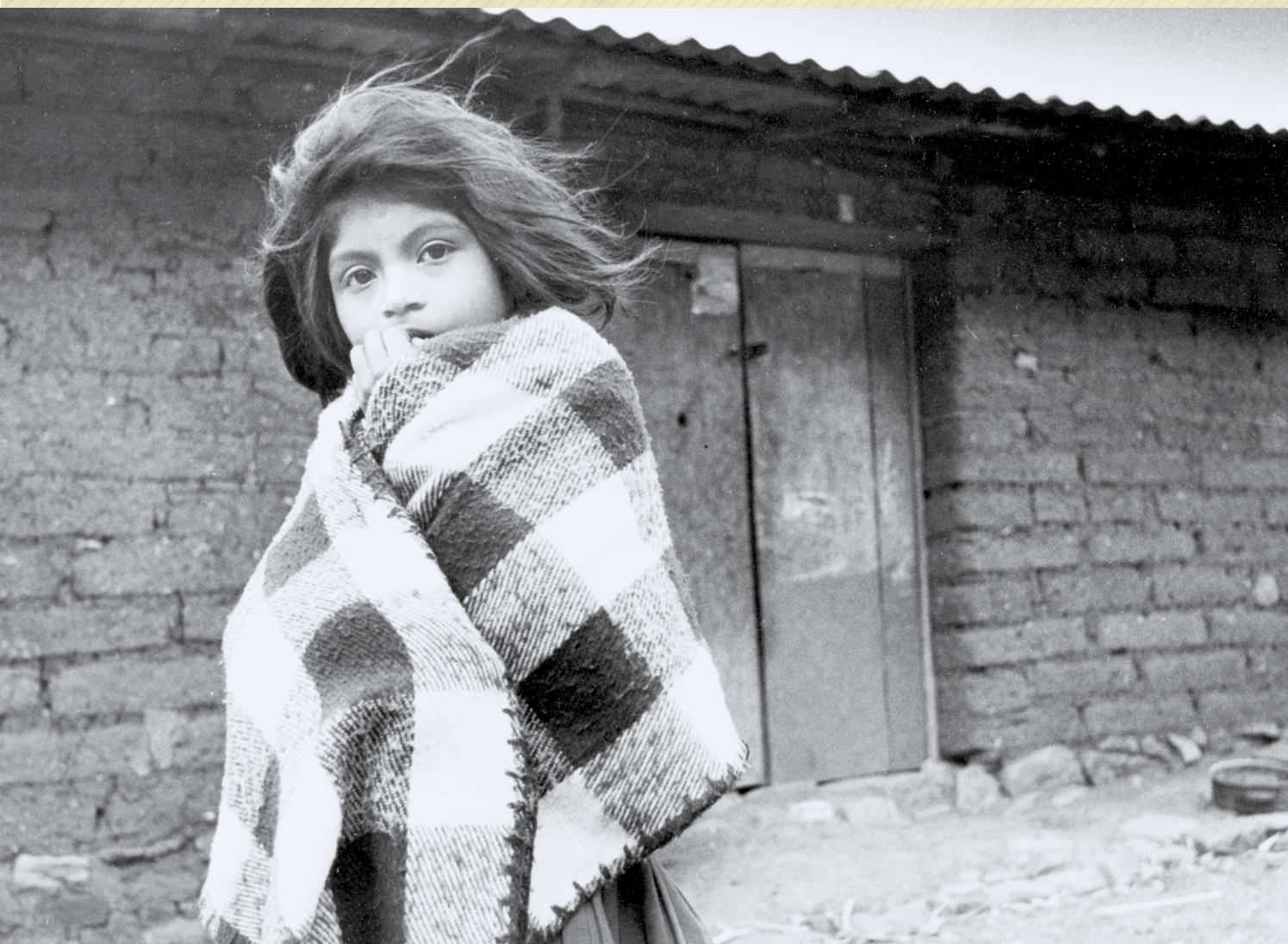
Sierra Madre Occidental, Nayarit, 1990.

Por otra parte, la violencia y confrontaciones se encuentran exacerbadas en los límites de Chimalapas-Cintalapa, donde en dos momentos hubo dotación de ejidos en tierras comunales chimalapas. Primero, entre 1940 y 1967, gestionados por las empresas madereras y aprobados por el Departamento de Asuntos Agrarios y Colonización para consentir el caciquismo y la permanente explotación de los aserraderos de la empresa Sánchez Monroy. El segundo momento se da en los años setenta y más enfáticamente en los ochentas. Se trató de ejidos emitidos por la Secretaría de Reforma Agraria a lo largo del límite Este de los Chimalapas y conformados principalmente por tsotsiles desplazados de sus tierras por motivos socio-religiosos. Este fenómeno se detona en un contexto de militarización y paramilitarismo en Chiapas durante el gobierno de Absalón Castella-