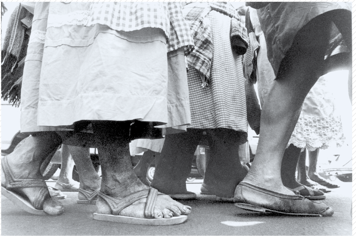
Distrito Federal, 1991.