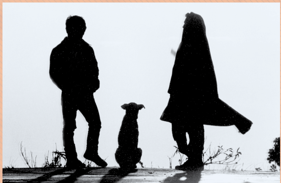
Santa Ana del Valle, Oaxaca, 1993.

José María Arguedas, poeta, escritor y educador quechua de Perú (1911-1969). Autor de las importantes novelas El sexto , Los ríos profundos y Todas las sangres .