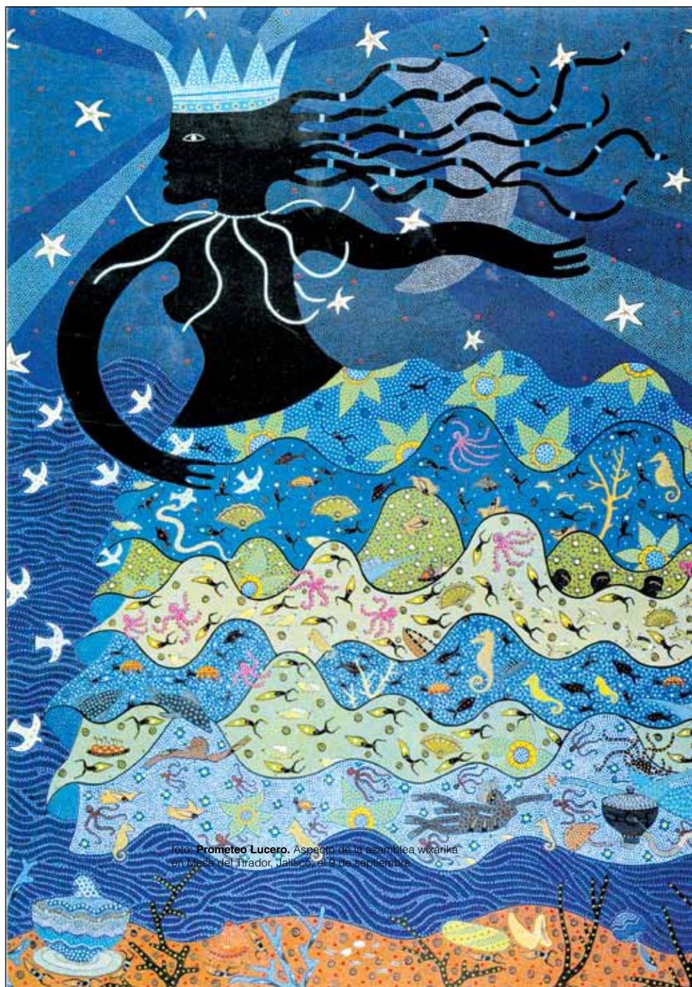
Aspecto de la asamblea wixarika en Mesa del Tirador, Jalisco, el 9 de septiembre.