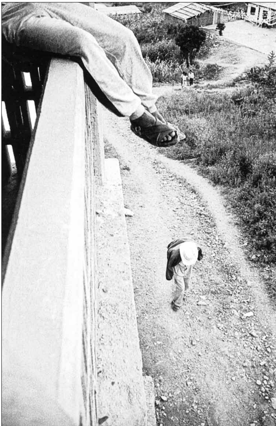
Sierra Zapoteca

Es una guerra, pacífica pero decidida, por la subsistencia de la población mexicana, en defensa del cuerpo, del suelo, el ambiente, los saberes y las semillas; por nuestras estrategias de supervivencia y alimentación; contra el genocidio, el desprecio, la imposición y la devastación del maíz, del tlayolli, del yok-ixim o kiximtik, del niza, del i-ku, y otros tantos nombres que, según la lengua original de cada pueblo, permiten comunicarle su fuerza y su cuidado de milenios. Esta resistencia pacífica se dirimirá en los barrios y las comunidades, en los estanquillos, las escuelas, los comedores familiares, las tortillerías y los molinos, en los centros culturales y en las comunidades más apartadas, pero será cierta ✂