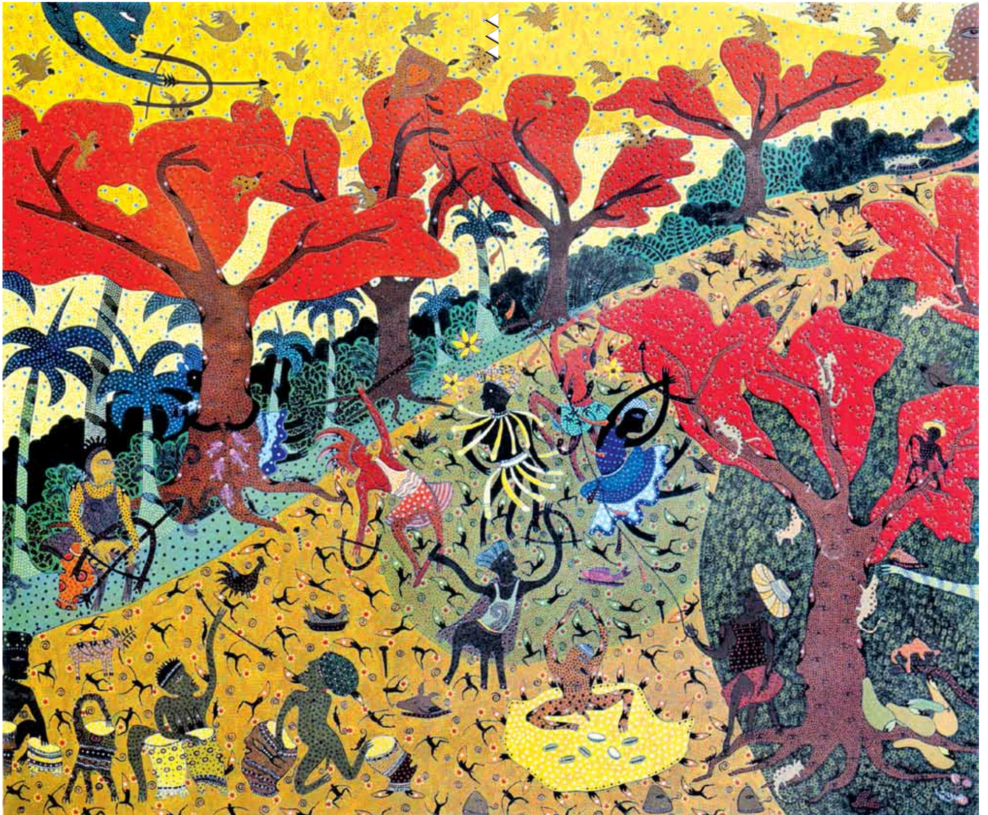
Saskia Verger: Ochosi el monte, acrílico sobre tela, 2008