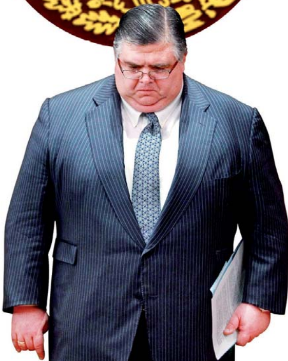
Agustín Carstens escucha al presidente Felipe Calderón cuando lo propone para encabezar el Banco de México, en reemplazo de Guillermo Ortiz