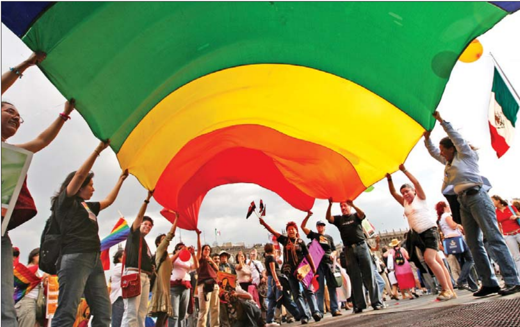
En una marcha del Hemiciclo a Juárez al Zócalo capitalino, decenas de mujeres se unieron en un reclamo: derechos iguales para todas, sean "seropositivas, viudas, lesbianas, divorciadas, indígenas o abandonadas". En el contexto de la Conferencia Internacional sobre VIH/sida que se realiza en esta capital, exigieron a los gobiernos del mundo dejar atrás el control patriarcal que mantiene a ese sector de la población en condiciones "vergonzosas" y de desventaja frente a la epidemia

“¡TODAS LAS MUJERES, TODOS LOS DERECHOS!”