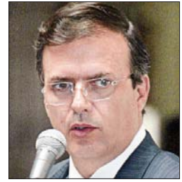
"No voy a caer en una contienda política" sobre seguridad pública, dijo Marcelo Ebrard