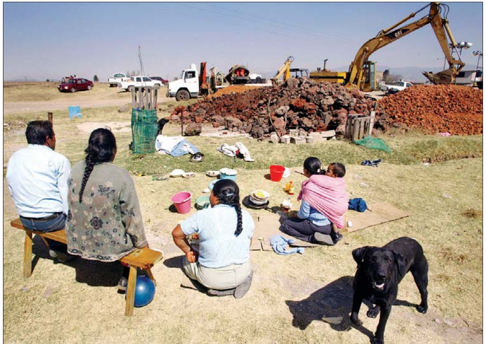
La Comisión Nacional del Agua informó que concluyeron las reparaciones —en la imagen— en la línea 1 del sistema Cutzamala, por lo que reinició el envío de líquido a las dos entidades. Los trabajos provocaron escasez de agua en más de 12 delegaciones del Distrito Federal y en varios municipios mexiquenses. El gobierno capitalino destinó más de 600 pipas para atender las zonas afectadas y se prevé que en el transcurso de hoy o el martes quede regularizado el suministro