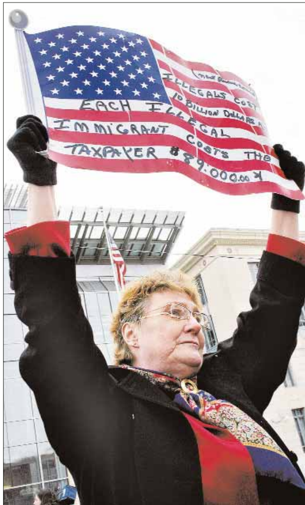
Participante en un mitin de apoyo a las autoridades de la ciudad de Hazelton, Pensilvania, quienes enfrentan un proceso a causa de su política migratoria. Hazelton fue la primera ciudad de Estados Unidos en adoptar ordenanzas municipales que penalizan a las empresas que contraten indocumentados y a quienes les alquilan viviendas. La imagen fue captada el lunes pasado. La leyenda en la bandera dice: "Los indocumentados cuestan 10 mil millones de dólares a Estados Unidos. Cada inmigrante cuesta 89 mil dólares a los contribuyentes"